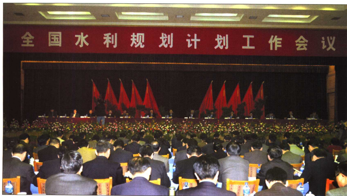
◆ 2001年2月18~21日，全国水利规划计划工作会议在云南昆明召开。水利部部长汪恕诚、副部长张基尧出席会议