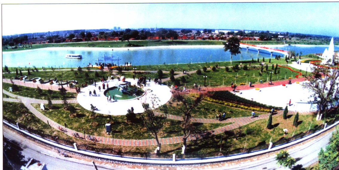
◆ 天津北运河防洪综合治理工程自屈家店闸至子牙河、北运河汇流口，全长15.017km。该工程于2000年12月20日开工，2001年9月28日竣工