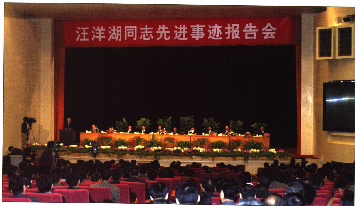
◆ 2001年10月25日，由中纪委、中组部、中宣部、水利部、吉林省委联合举行的汪洋湖同志先进事迹报告会在北京人民大会堂举行