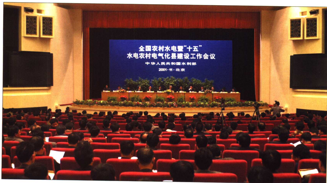
◆ 2001年11月21~22日,全国农村水电暨“十五”水电农村电气化县建设工作会议在北京人民大会堂召开。中共中央政治局委员、书记处书记、国务院副总理温家宝致信祝贺。水利部部长汪恕诚,副部长敬正书、张基尧、陈雷、索丽生,部党组成员、中纪委驻部纪检组组长刘光和出席会议