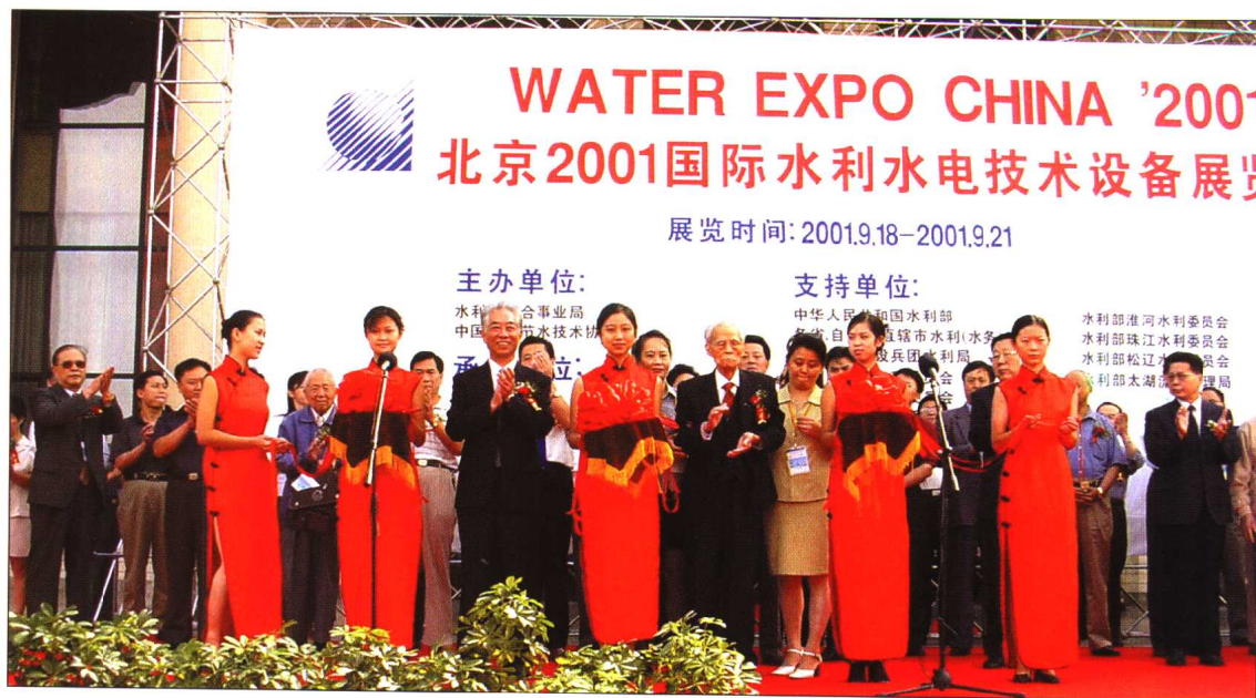
◆ 2001年9月18~21日，北京2001国际水利水电技术设备展览会在北京开幕。全国人大常委会副委员长程思远为开幕式剪彩，水利部部长汪恕诚致开幕词