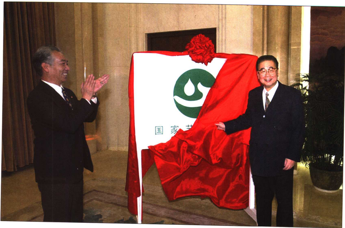
◆ 2001年3月22日，在第9届“世界水日”和第14届“中国水周”到来之际，中共中央政治局常委、全国人大常委会委员长李鹏为“国家节水标志”揭牌