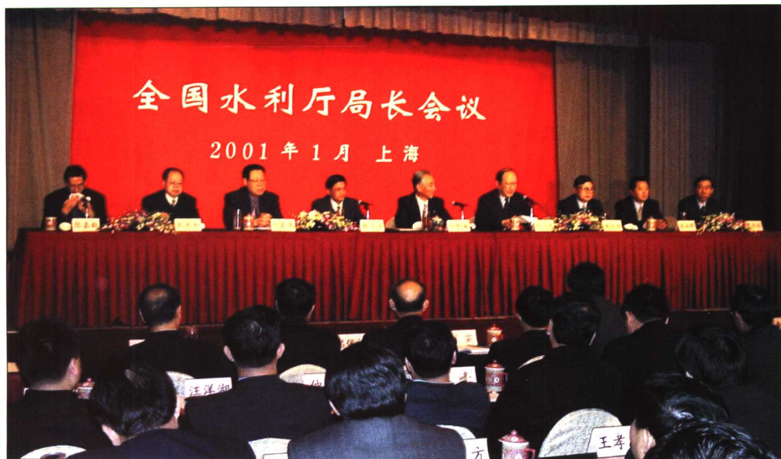
◆ 2001年1月12~15日，全国水利厅局长会议在上海召开。水利部部长汪恕诚，上海市市长徐匡迪，水利部副部长敬正书、周文智、张基尧、翟浩辉，部党组成员、中纪委驻水利部纪检组组长刘光和出席会议