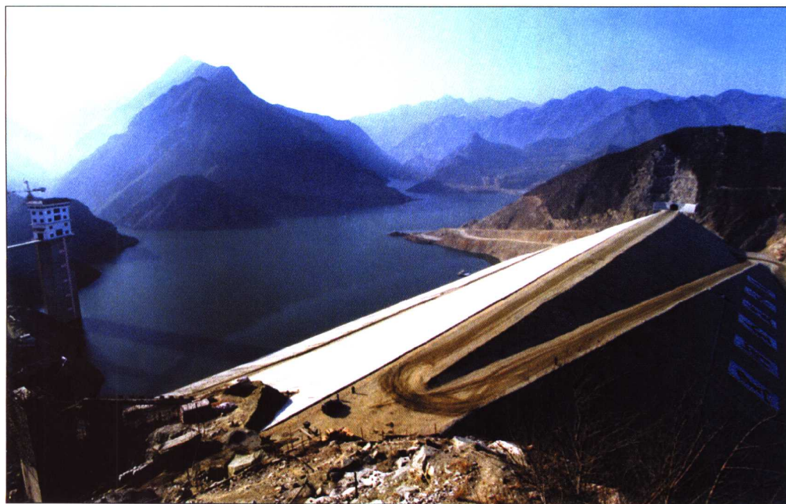
◆ 2001年12月19日，西安黑河金盆水利枢纽主体工程建成