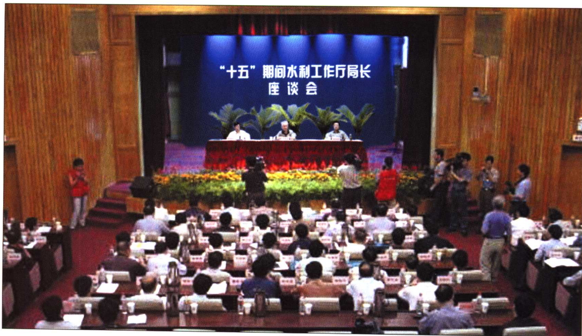
◆ 2001年9月20~22日,“十五”期间水利工作厅局长座谈会在三峡工地召开。水利部部长汪恕诚发表重要讲话