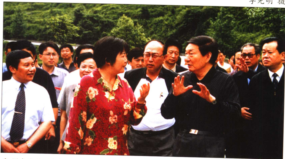
◆ 国务院总理朱镕基对发展小水电，保护和改善生态环境十分重视。2001年4月、6月、8月，他先后在湖南、四川和贵州三省考察时多次强调，要大力发展小水电