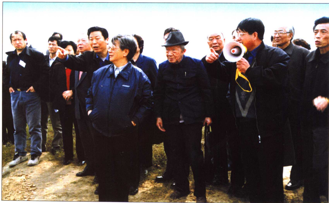
◆ 2001年10月15日，全国政协副主席钱正英率领全国政协委员、中国工程院院士考察渭河治理