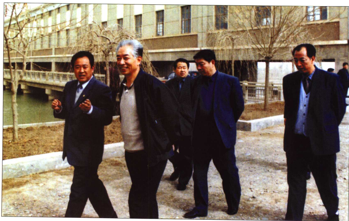
◆ 2001年4月，水利部部长汪恕诚在黑河流域考察工作