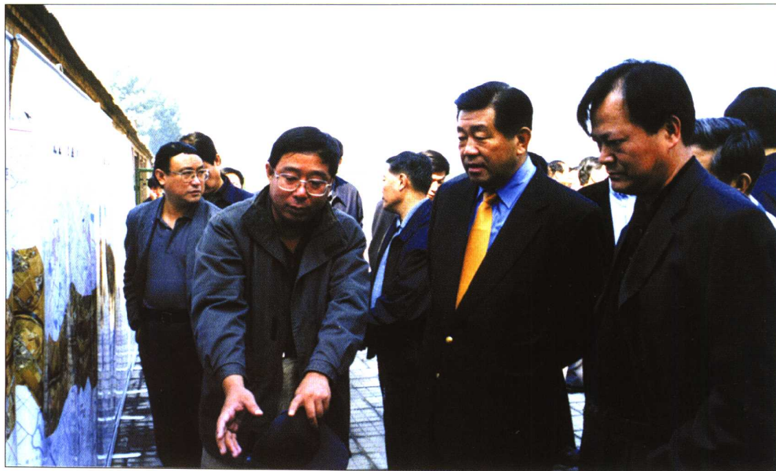
◆ 2001年10月13日，中共中央政治局委员、北京市委书记贾庆林在温榆河流域调研