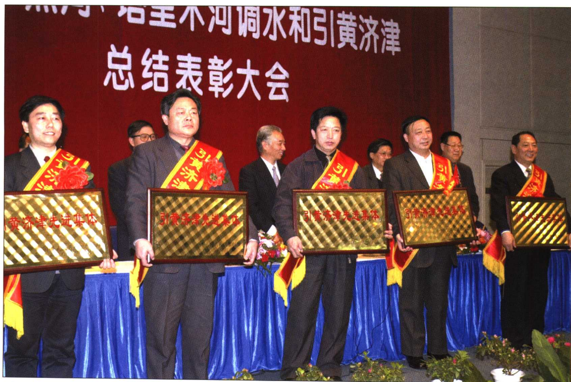
◆ 2001年2月15日，黄河、黑河、塔里木河调水和引黄济津总结表彰大会在北京召开。水利部部长汪恕诚，副部长敬正书、周文智、张基尧，中纪委驻水利部纪检组组长刘光和出席会议，并为先进集体和先进个人颁奖