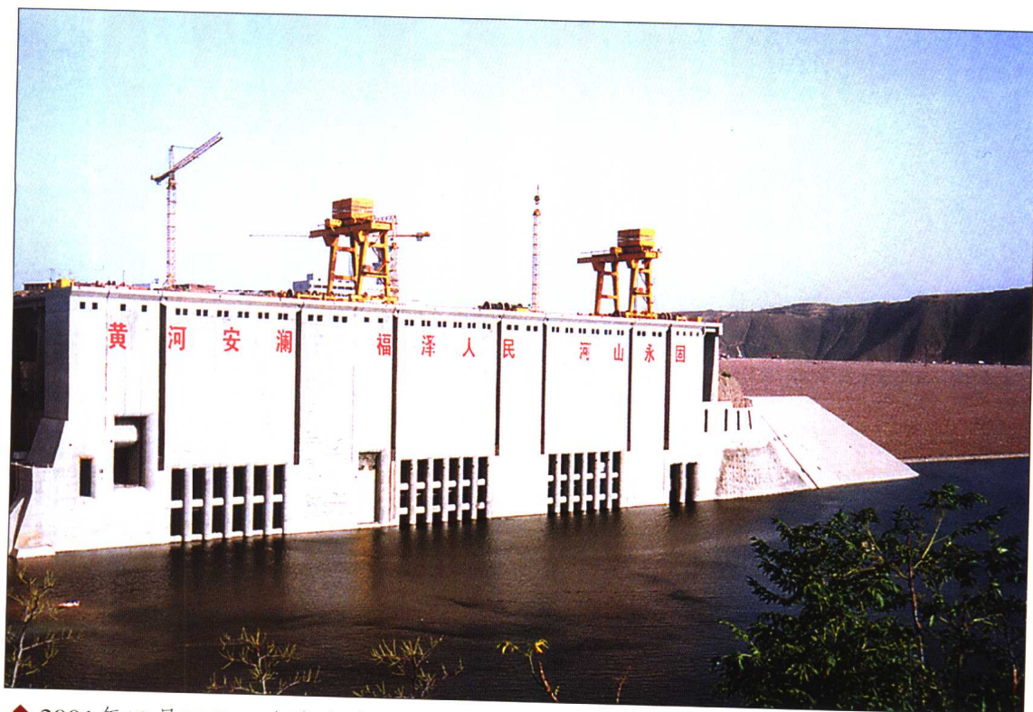
◆ 2001年12月27日，小浪底水利枢纽第6台机组正式投产发电。这标志着小浪底水利枢纽主体工程全部完工。图为小浪底大坝