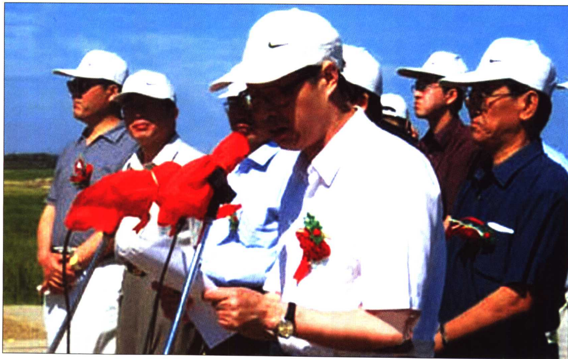
◆ 2001年7月12日，水利部副部长索丽生在扎龙湿地应急补水仪式上宣布“开闸放水”。这是水利部门首次向湿地自然保护区补水