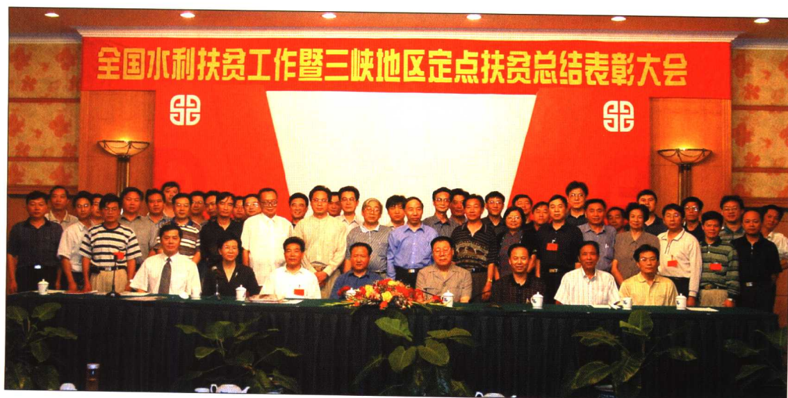
◆ 2001年10月全国水利扶贫工作暨三峡地区定点扶贫总结表彰大会在北京召开