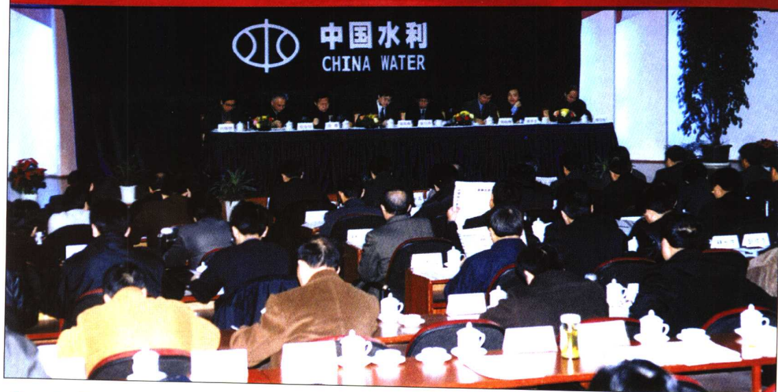
◆ 2001年12月20~21日，水利部贯彻《长江河道采砂管理条例》座谈会在武汉召开