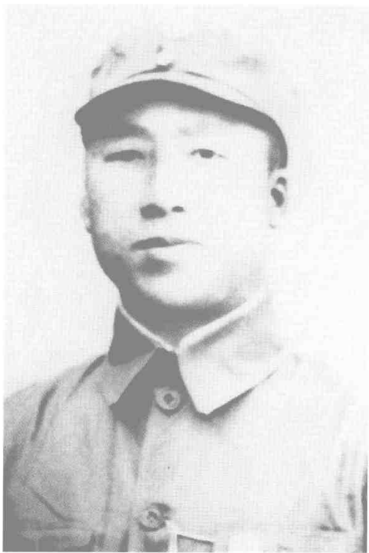
1934年2月，时任中革军委总动员武装部部长的滕代远在瑞金。