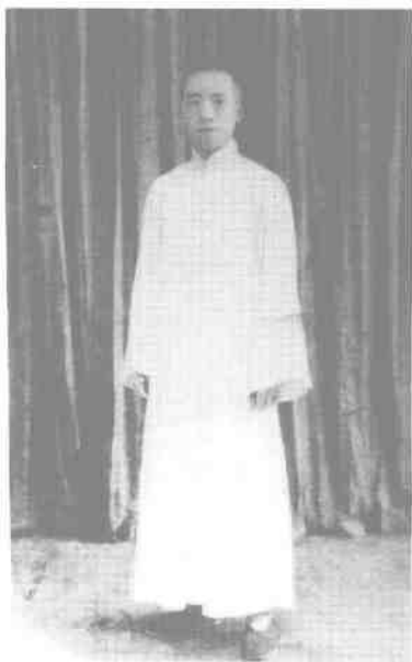
1934年8月,三十岁的滕代远作为中共代表团成员赴苏联莫斯科参加共产国际第七次代表大会,行前在上海留影。