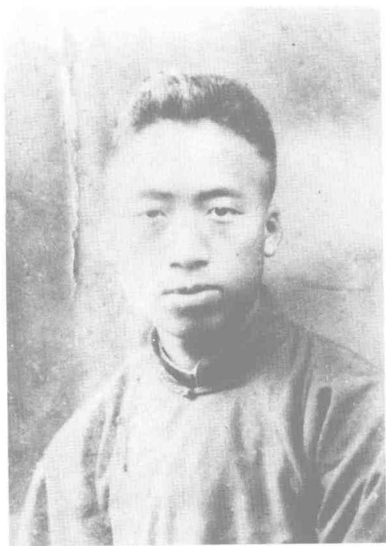
1930年5月，滕代远作为红军代表在上海出席全国苏维埃区域代表大会和全国红军代表会议。