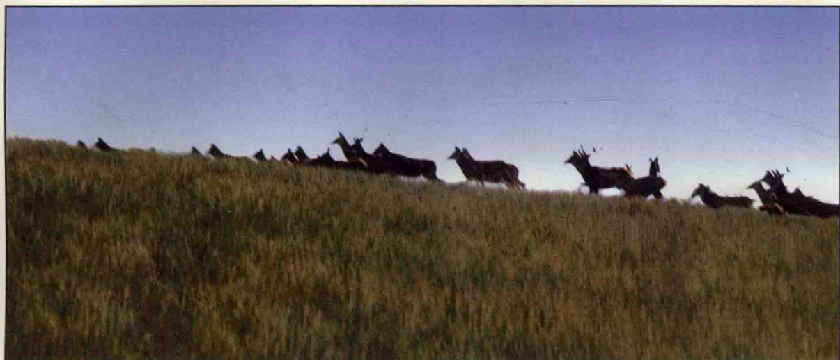
站立观望的白唇鹿群