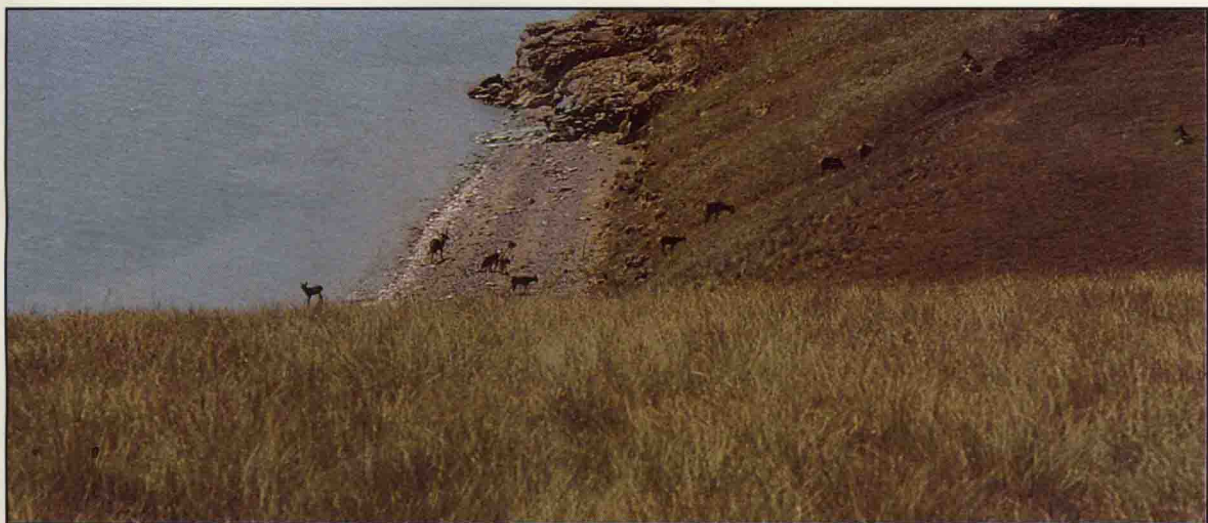
青海省玛多县扎陵湖岛上休憩的白唇鹿群