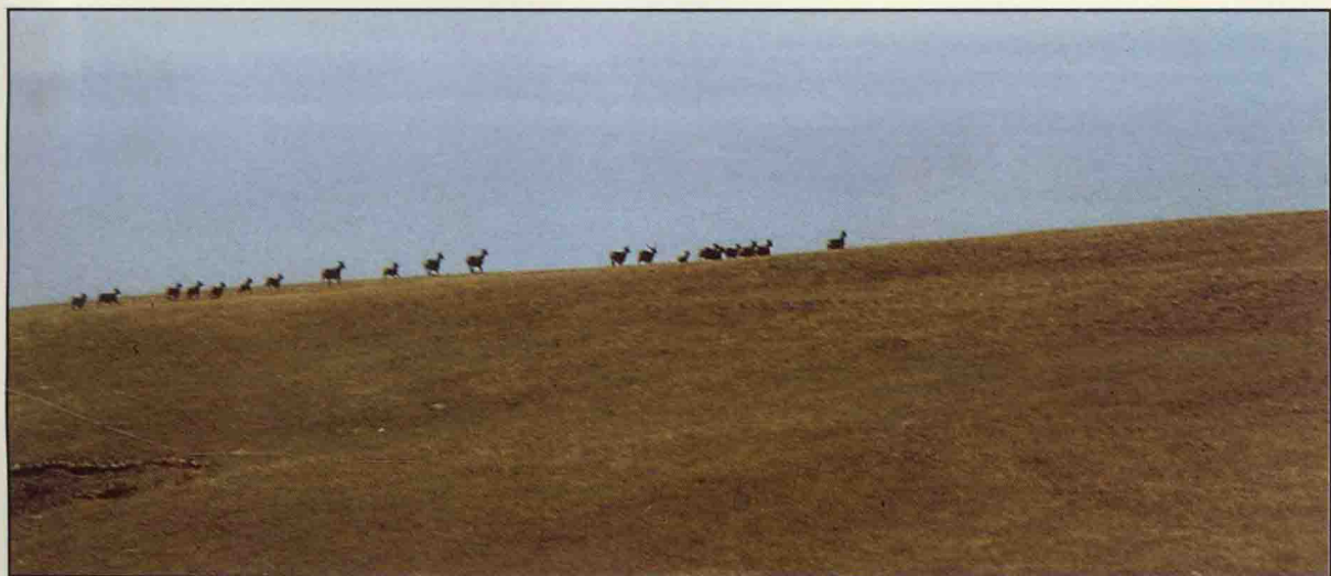
奔跑中的白唇鹿群