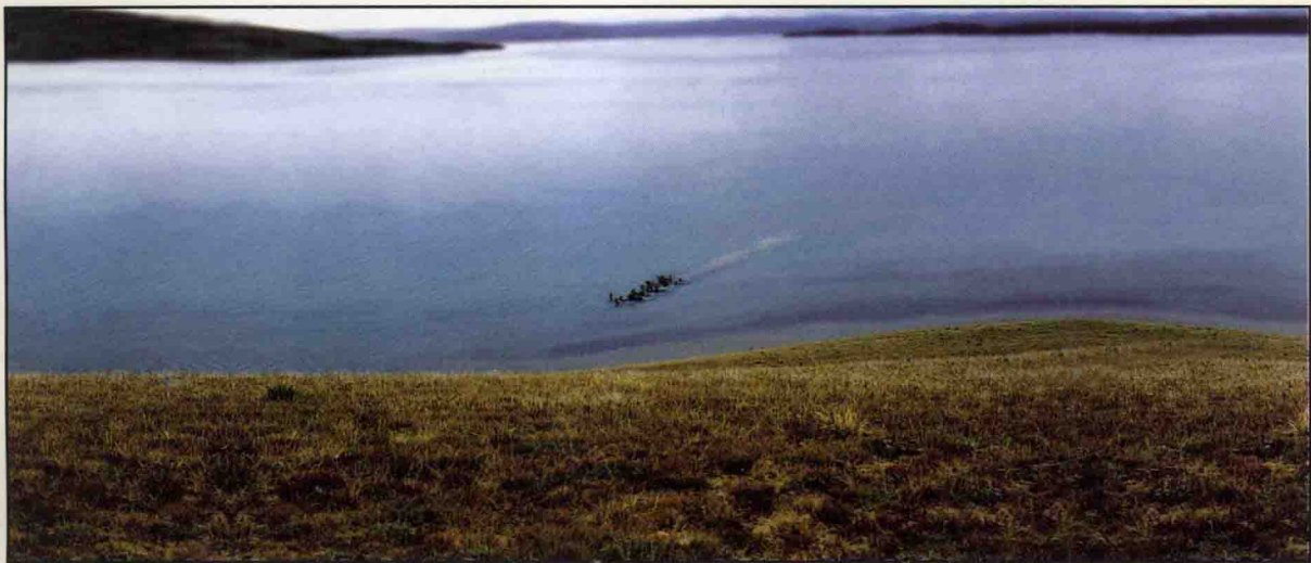
在青海省玛多县扎陵湖中游水的白唇鹿群