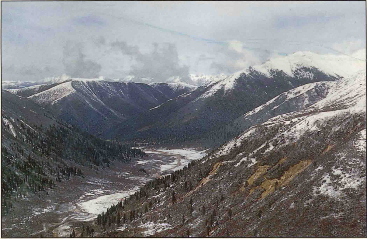
四川省白玉县白唇鹿栖息地的自然景观