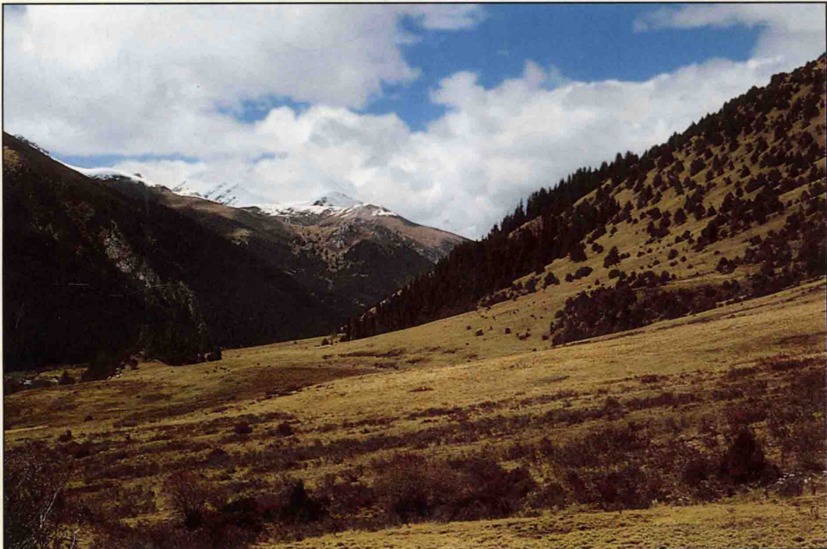
青海省治多县白唇鹿栖息地的自然景观