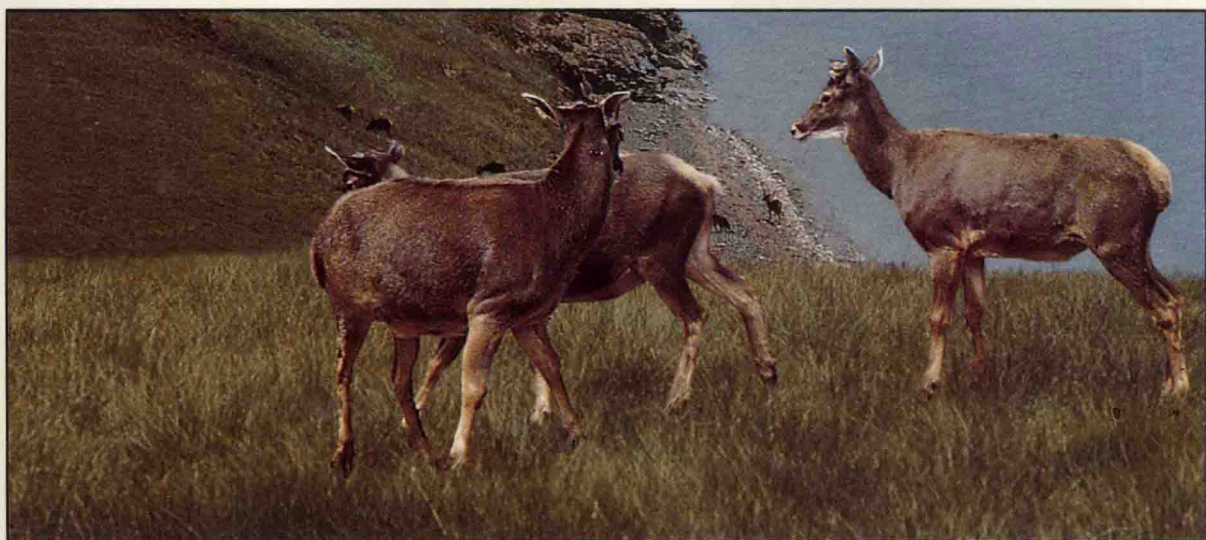
白唇鹿外观形体高大、毛色黄褐