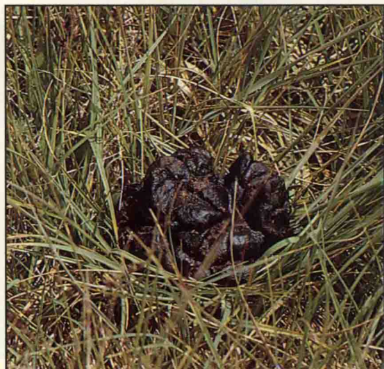
白唇鹿的夏季粪便呈堆状