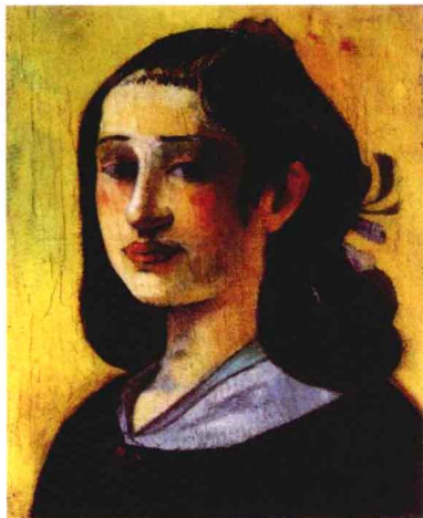
母亲的肖像 高更 布面油画 1890年

来就严重的心脏疾病恶化。在麦哲伦海峡的法明港（Port Famine）登陆时，他在小艇中病倒了，死于动脉瘤破裂。