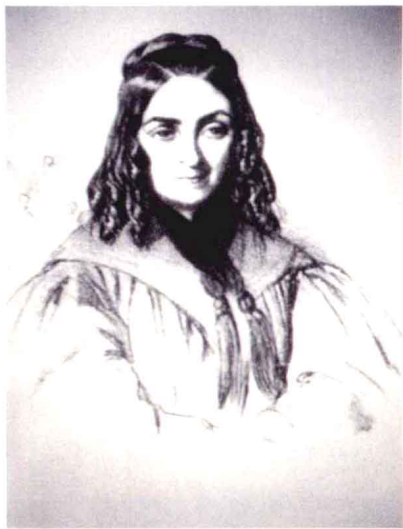
高更的外祖母弗罗拉·特里斯坦