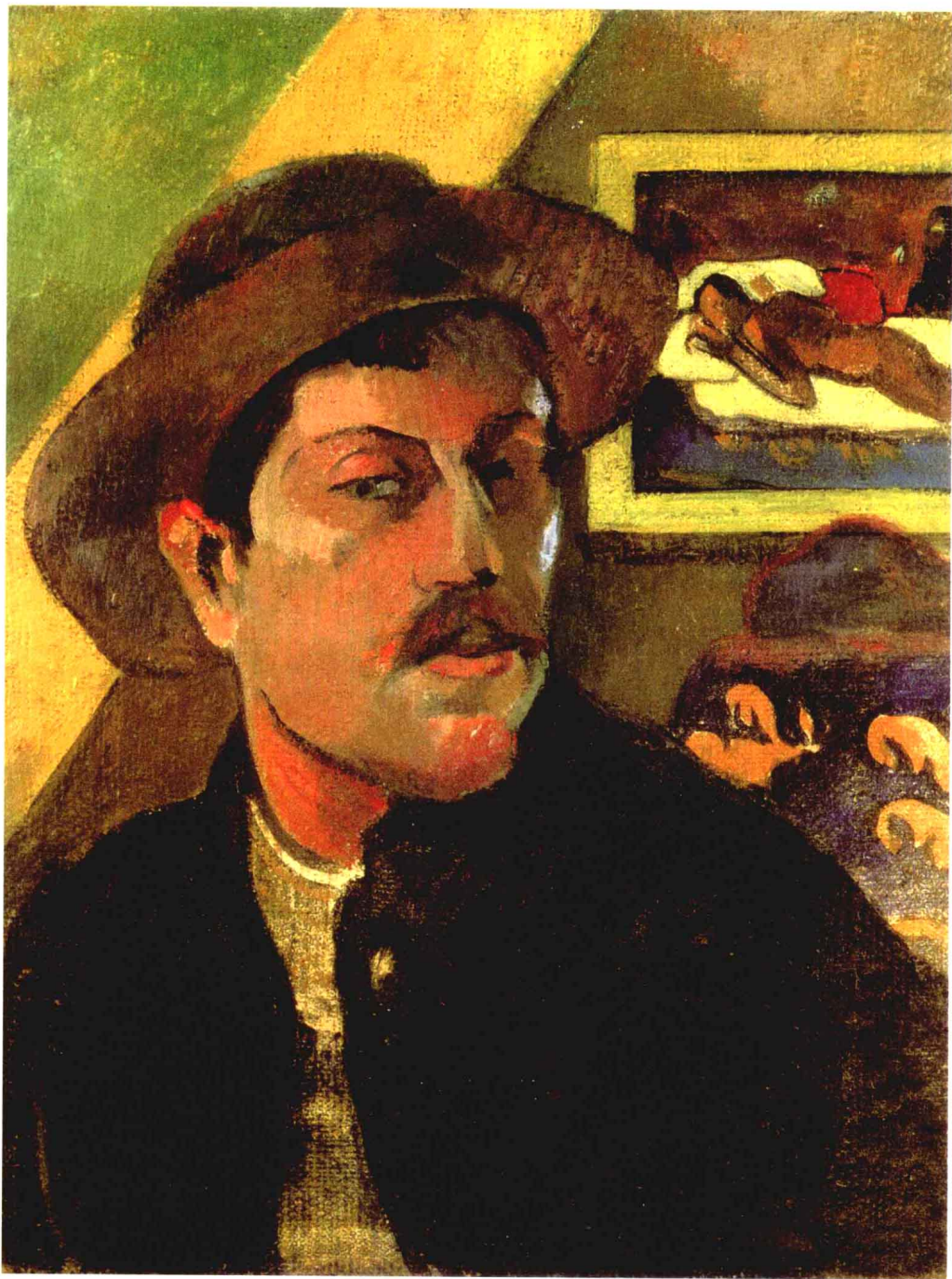
戴帽子的自画像 高更 布面油画 46cm×38cm 1894年