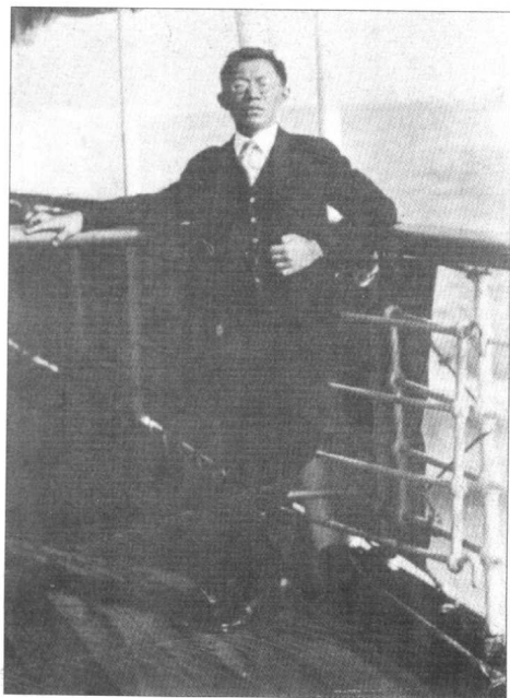
1922年羅家倫由美赴歐時攝于船上