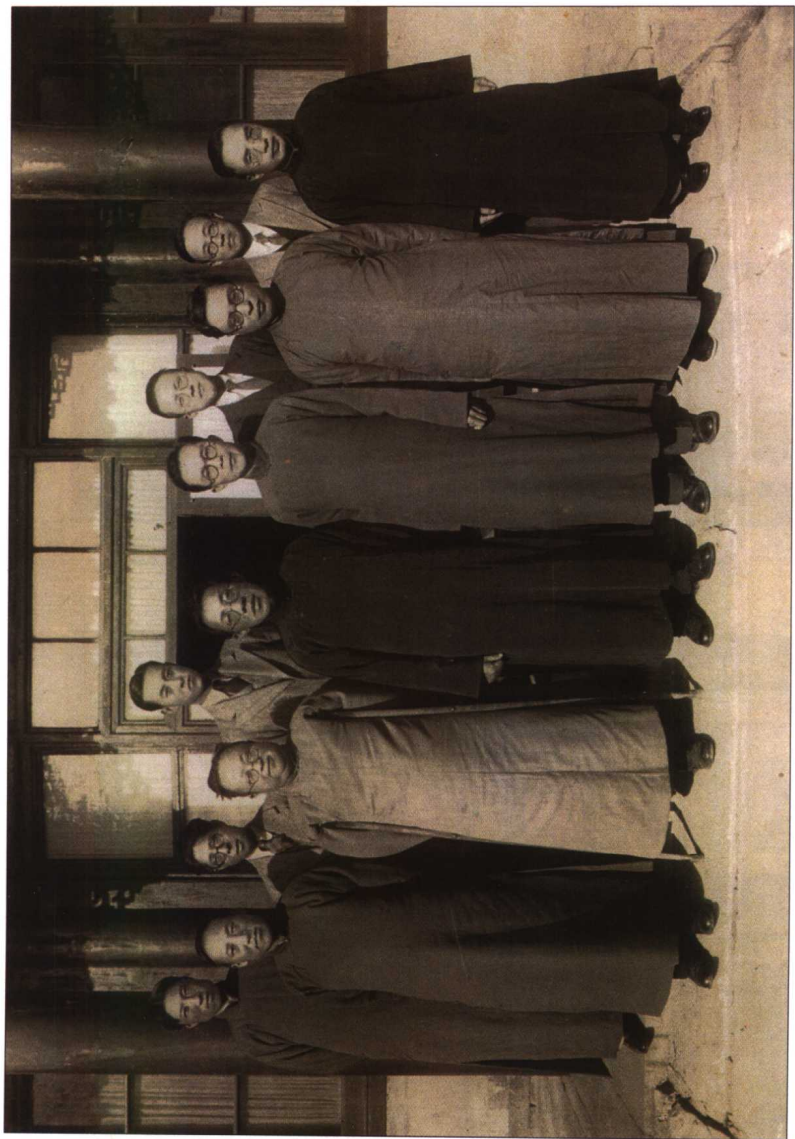
1929年至1930年间在清华大学留影 (前排左起叶企孙、潘光旦、罗家伦、梅贻琦、冯友兰、朱自清 后排左二浦薛凤、左三陈岱孙、左四顾毓琇)