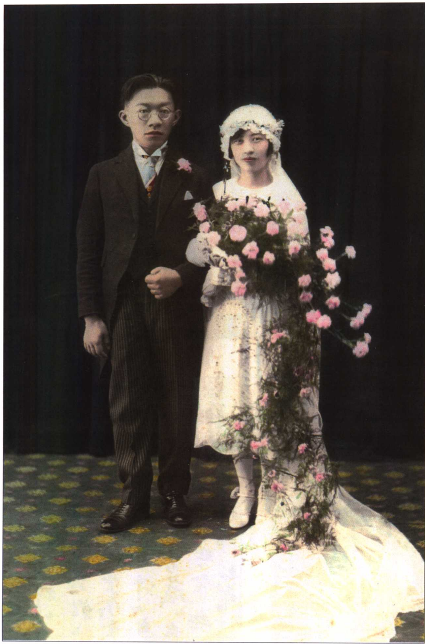
1927年11月13日在上海罗家伦与张维桢结婚照