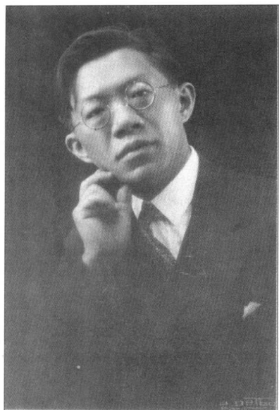
罗家伦 1926 年春于巴黎