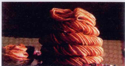
维吾尔族群 众喜爱的馓子