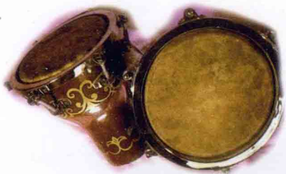
维吾尔族打 击乐器纳格拉