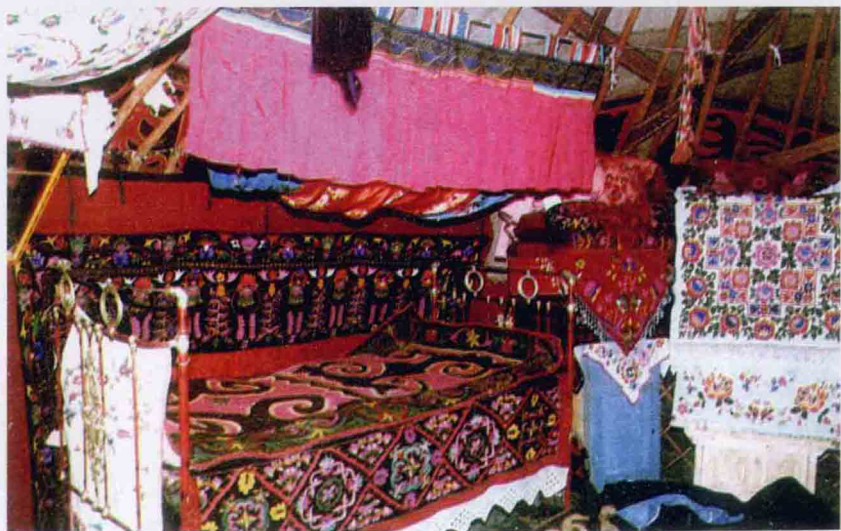
哈萨克牧民毡房里的一角