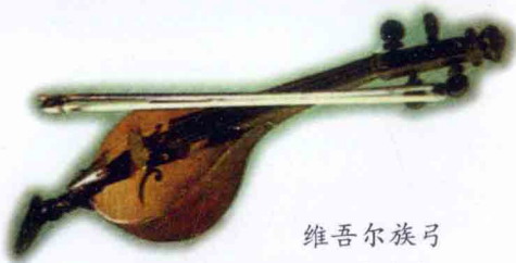
维吾尔族弓 弦乐器胡喜它尔