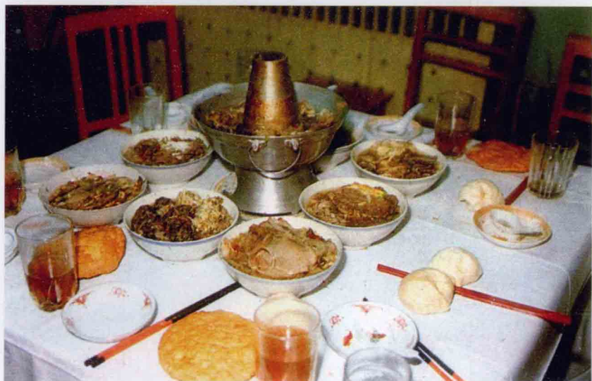
回族的筵席“九碗三行”