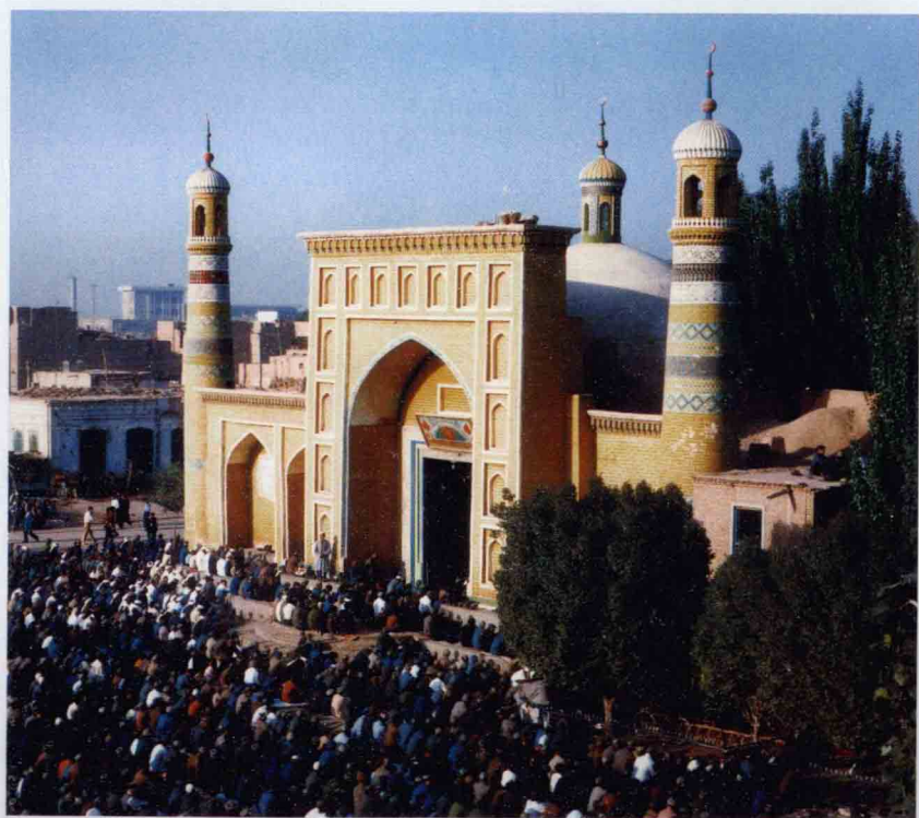
新疆喀什艾提卡尔清真寺外景