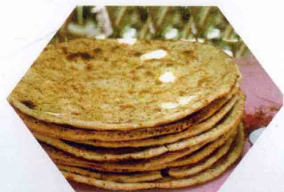
维吾尔族的艾买克馕