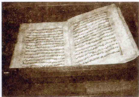
北京东四清真寺珍藏之中国最早的《古兰经》抄本（穆罕默德·伊本·阿布杜拉赫曼于元延祐五年——1318年抄写）