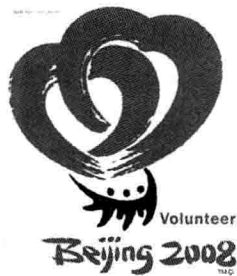
图1-1 2008年北京奥运会志愿者标志

2008年8月8日,万众瞩目的北京奥运会召开。在奥运会顺利进行的过程中,中国的志愿者们给世界人民留下了深刻的印象(志愿者标志见图1-1)。据统计,在北京奥运会、残奥会期间,共有10万赛会志愿者直接为赛会提供服务,40万城市志愿者在城市