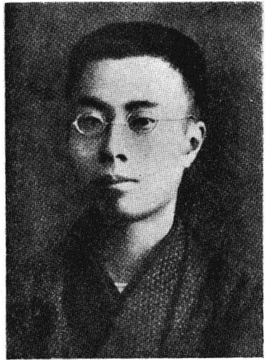
廿八歲在日本東京