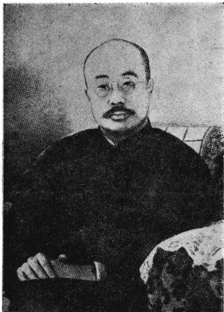
一九四五年在北京