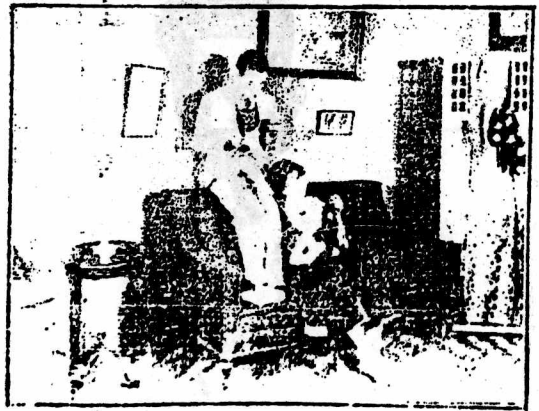
人 中 男 自 公 司 出 品