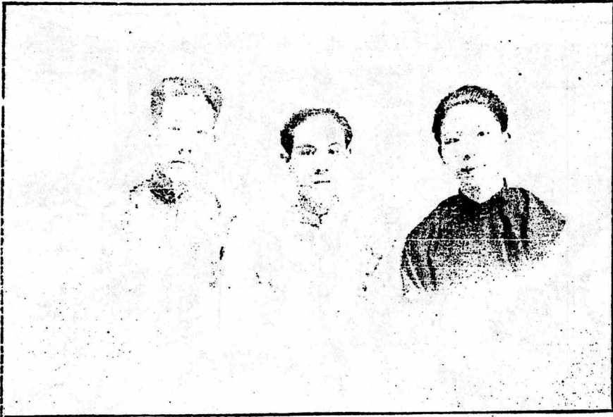
任 主 術 美 刊 本