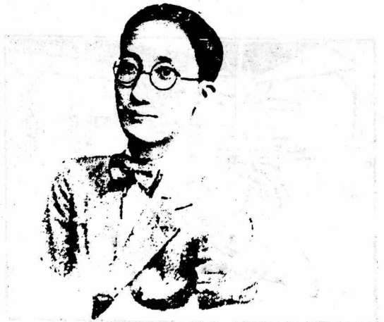
梅 寒 莫