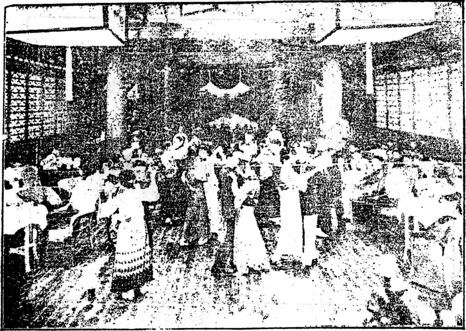
明 星 公 司 出 品 之 同 男 愛