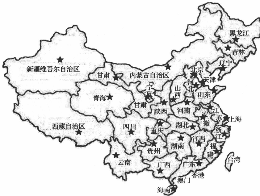
图 1-2 样本的地域分布