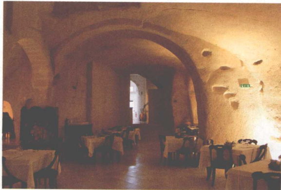
圣天使酒店的餐厅