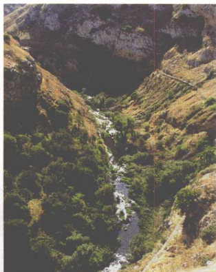
奇维塔峡谷及水流

马泰拉地形地貌丰富多样，包括高原区，山谷地带和天然地陷。城市古老的中心位于70~80m深的峡谷悬崖处，被称为奇维塔峡谷，现属于穆尔吉亚公园历史保护区（Murgia Park）的一部分。格拉维纳河（Gravina River）曾经流经这里，湍急的水流穿过峡谷深处；现在是长满树木的绿色悬崖和废