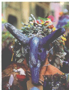
古老的圣母纪念日游行活动