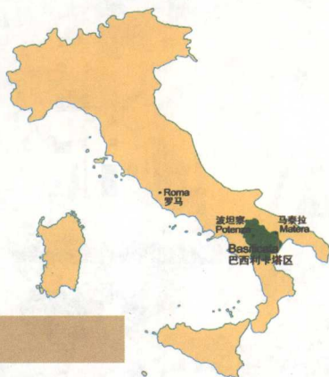
巴西利卡塔区位置图