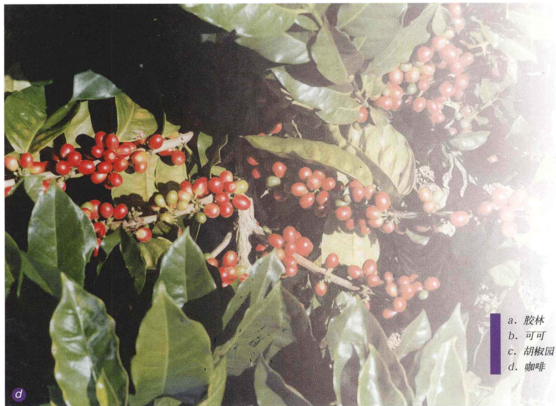
a. 胶林 b. 可可 c. 胡椒园 d. 咖啡