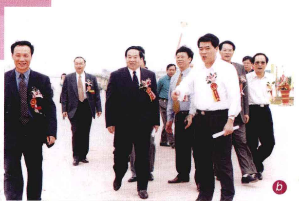
a. 广东省副省长欧广源、省政府副秘书长周炳南及中国蓝田总公司总经理瞿兆玉在广东农产品中心批发市场奠基仪式上 b. 省、市领导与中国蓝田总公司总经理一起共商广东农产品中心批发市场建设、发展大计 c. 市场“金农网”主页