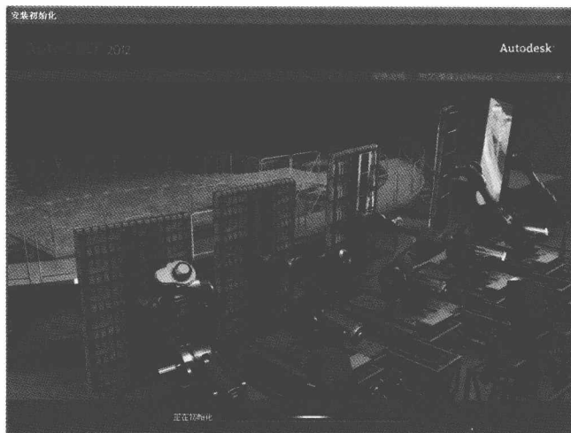
图 2-1 安装初始化界面

AutoCAD 2012 软件包以光盘形式提供，光盘中存有名为 SETUP.EXE 的安装文件。执行 SETUP.EXE 文件(将 AutoCAD 2012 安装盘放入光驱后，系统可以自动执行 SETUP.EXE 文件)，首先系统弹出如图 2-1 所示的初始化界面。