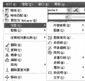
图 2-5 “修改”下拉菜单

菜单栏是 AutoCAD 2012 的主菜单。利用 AutoCAD 2012 提供的菜单可以执行 AutoCAD 的大部分命令。选择菜单栏中的某一选项，系统会弹出相应的下拉菜单。如图 2-5 所示为“修改”下拉菜单。