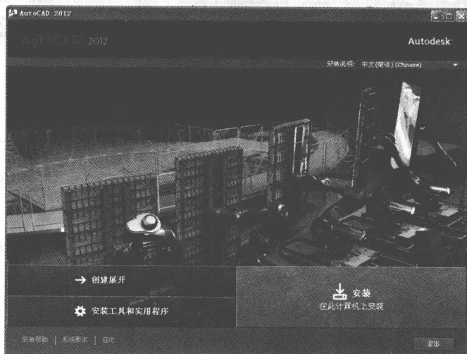
图 2-2 安装选择界面

此时单击“安装 在此计算机上安装”项,即可进行相应的安装操作,直至软件安装完毕。需要说明的是,安装 AutoCAD 2012 时,用户应根据需要进行必要的选择。