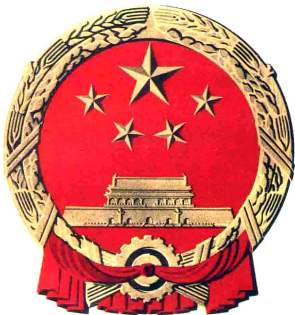
中华人民共和国国徽