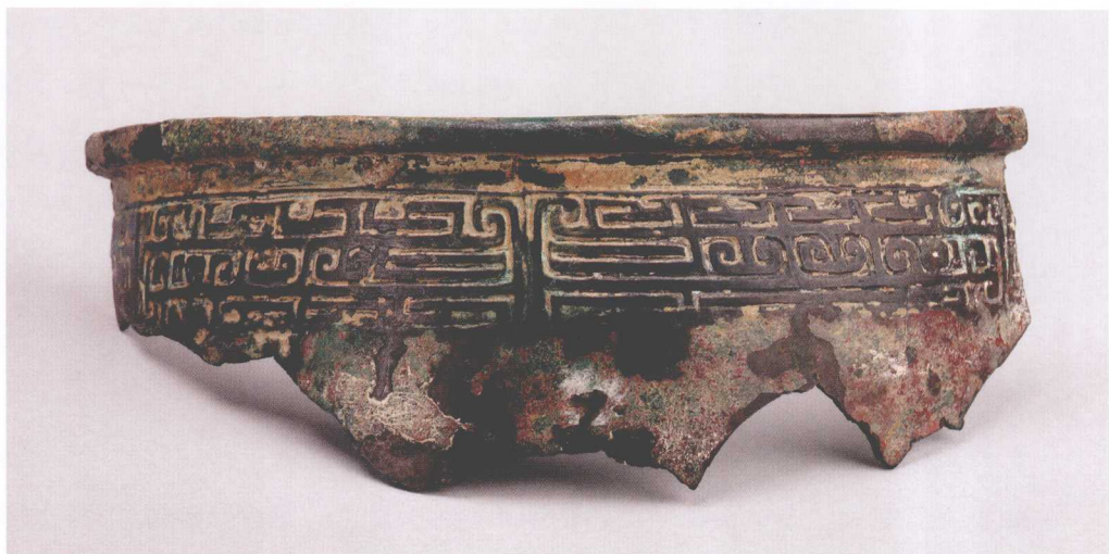
插图二 子作父宝尊残件