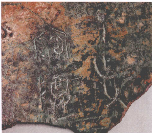
插图三 子作父宝尊铭文

兵马俑坑出土的铍极为相似，镌刻金文，有明确的纪年、机构和工匠名称，铸造精湛，锐利无比，在扬州地区出土文物中极为罕见。