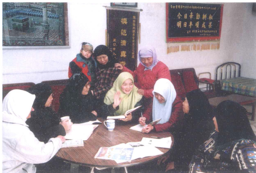
▲ 学习《圣训》(周口陈州街清真寺)