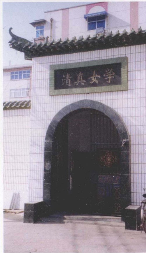
▲ 开封王家胡同女寺