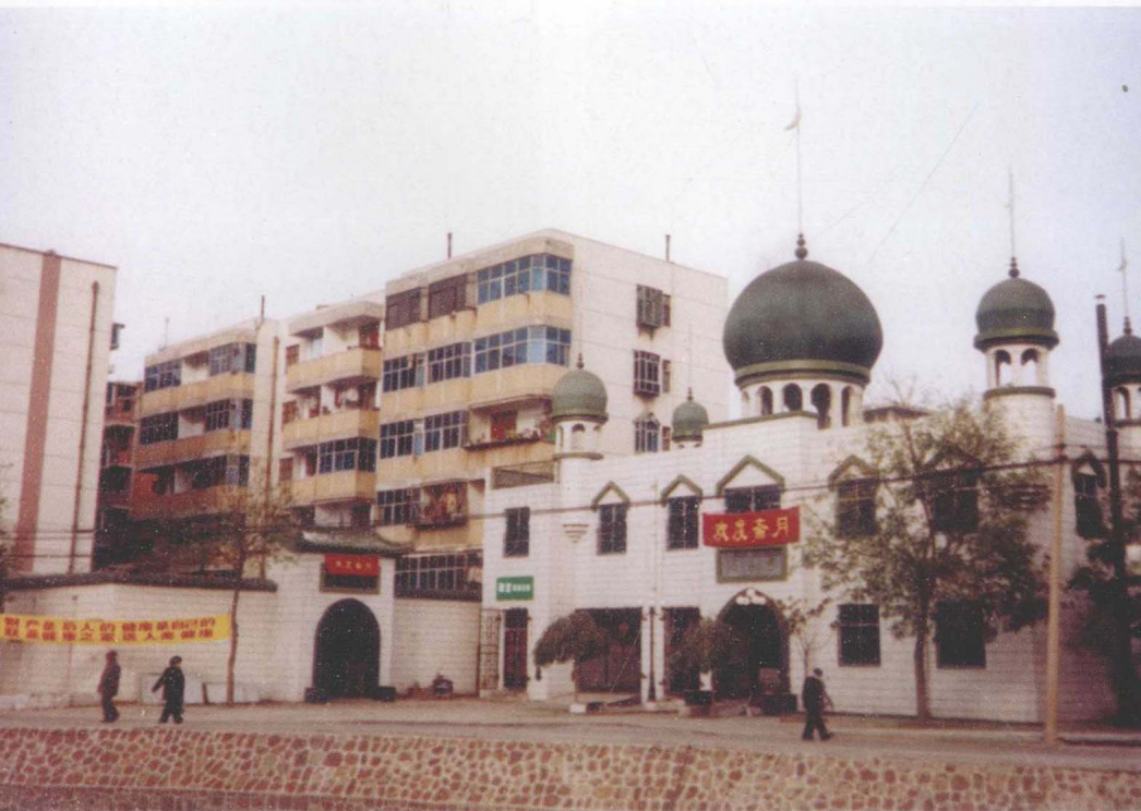
▲ 相邻的男寺和女寺，一高一矮，一阿一中。(河南郑州)