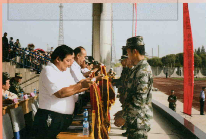
2009年8月27日, 军事大比武颁奖仪式