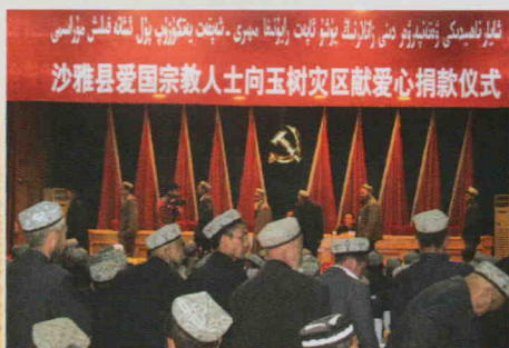
沙雅县爱国宗教人士向玉树灾区献爱心捐款仪式