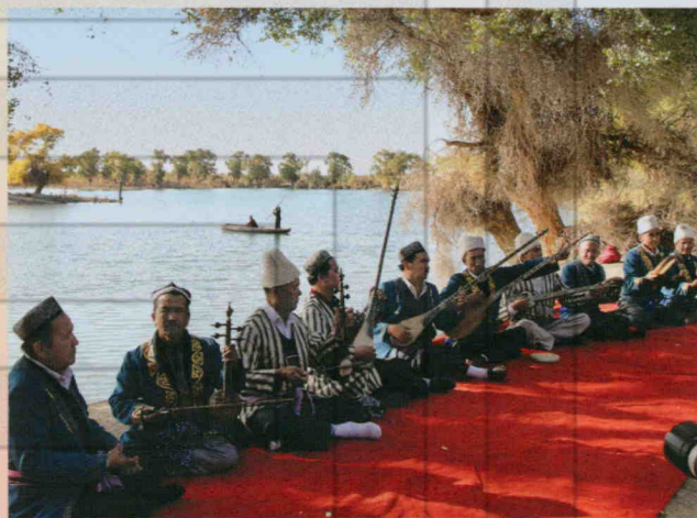
民间艺人弹唱木卡姆