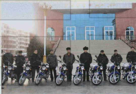
乡镇统战民宗干事配备专用摩托车