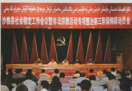
沙雅县社会稳定工作会议暨非法宗教活动专项治理第三阶段转段动员会