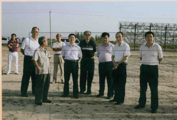
2009年8月29日,专家建言献策