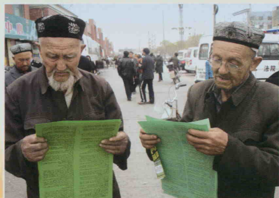
群众认真阅读信访条例宣传材料