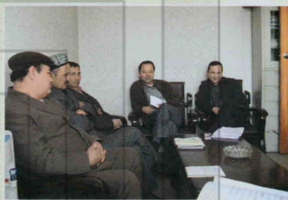
开展退休干部座谈会