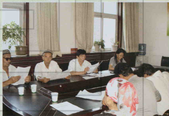
信访局组织退休干部政治学习