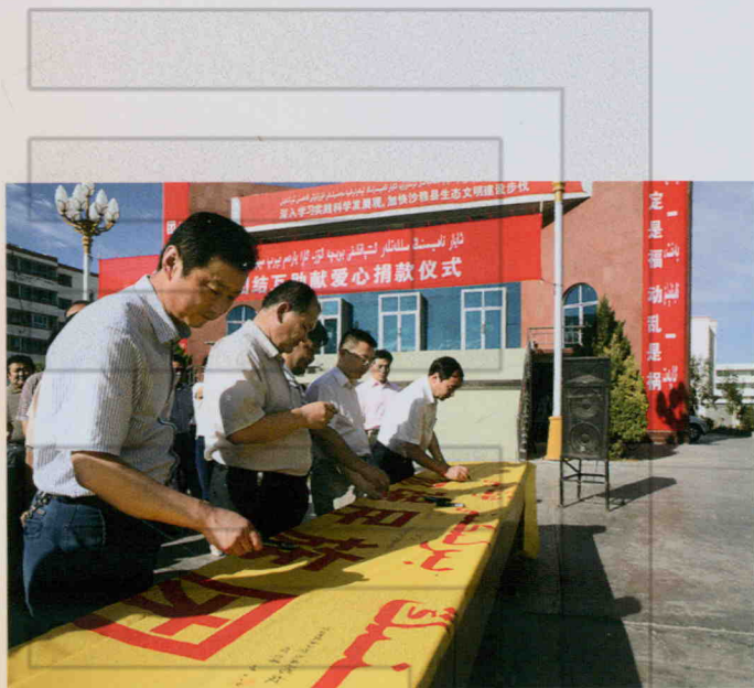
2009年7月14日, 民族团结千人签名