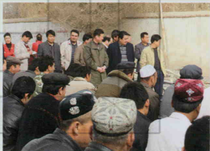
县领导下乡开展非法宗教活动专项治理