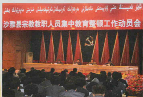
沙雅县宗教教职人员集中教育整顿工作动员会