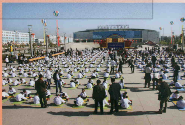
“民族团结杯”千名少儿围棋表演赛