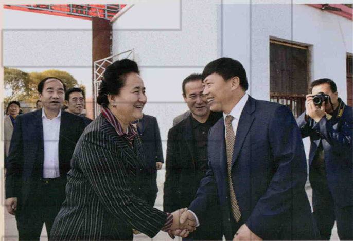
2009年11月6日,自治区 工商联领导在沙雅县调研