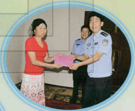
慰问贫困民警家属