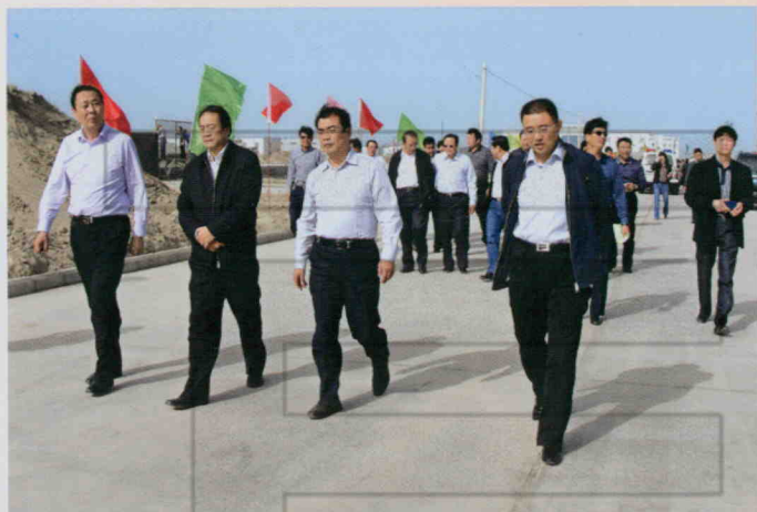
2010年10月16日,地委书记 黄三平(右二)在沙雅县调研