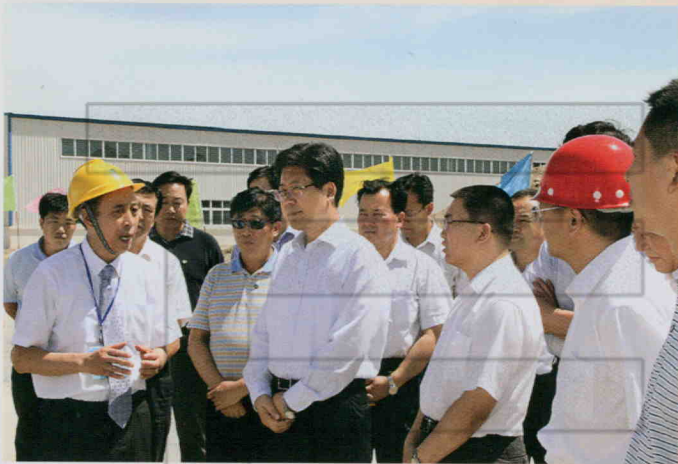
2009年9月6日，自治区 党委书记张春贤（前排左二）在 沙雅县调研