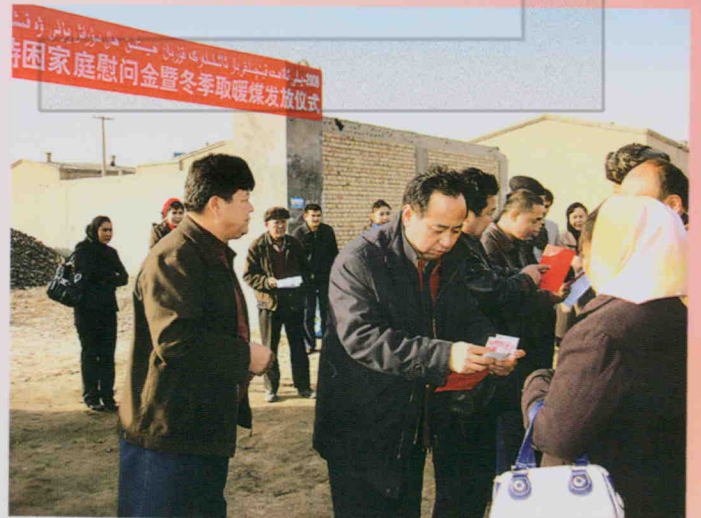
2009年10月13日,沙雅县举行特困家庭 慰问金暨冬季取暖煤发放仪式