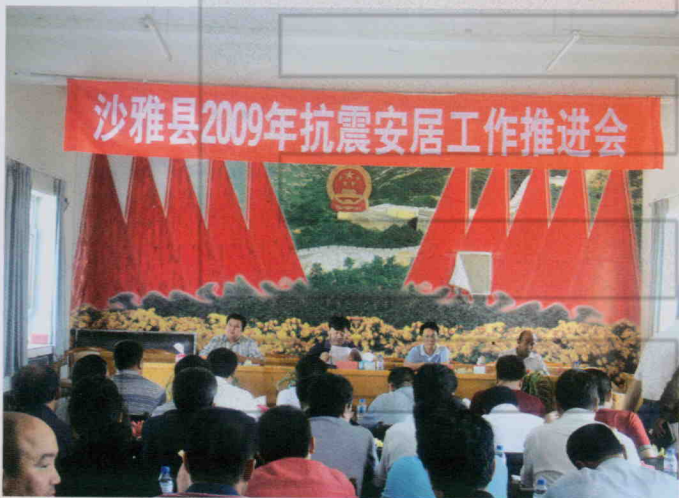
2009年5月26日,沙雅县召开 2009年抗震安居工作推进会