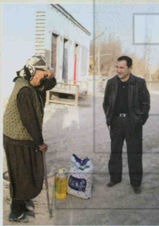
慰问对口帮扶村贫困户