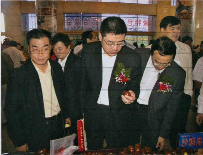
2009年9月18日,地区领导与客商在乌洽会上参观沙雅县特色产品展