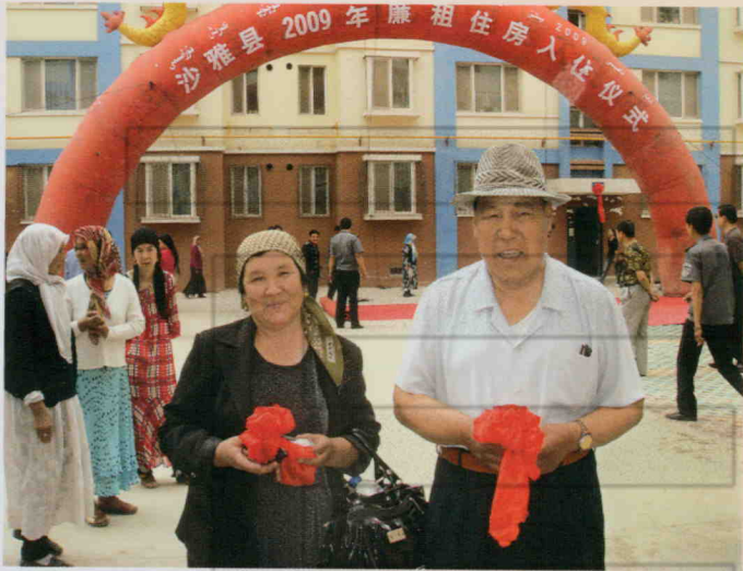
2009年5月21日,沙雅县举行 2009年廉租住房入住仪式