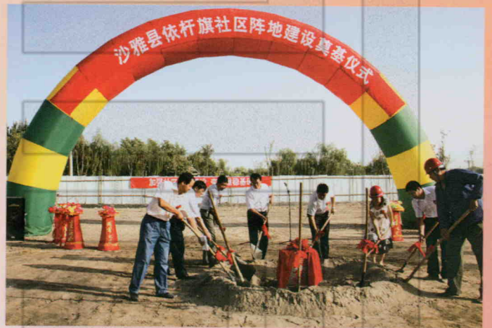
2009年7月日,沙雅县举行依杆 旗社区阵地建设奠基仪式