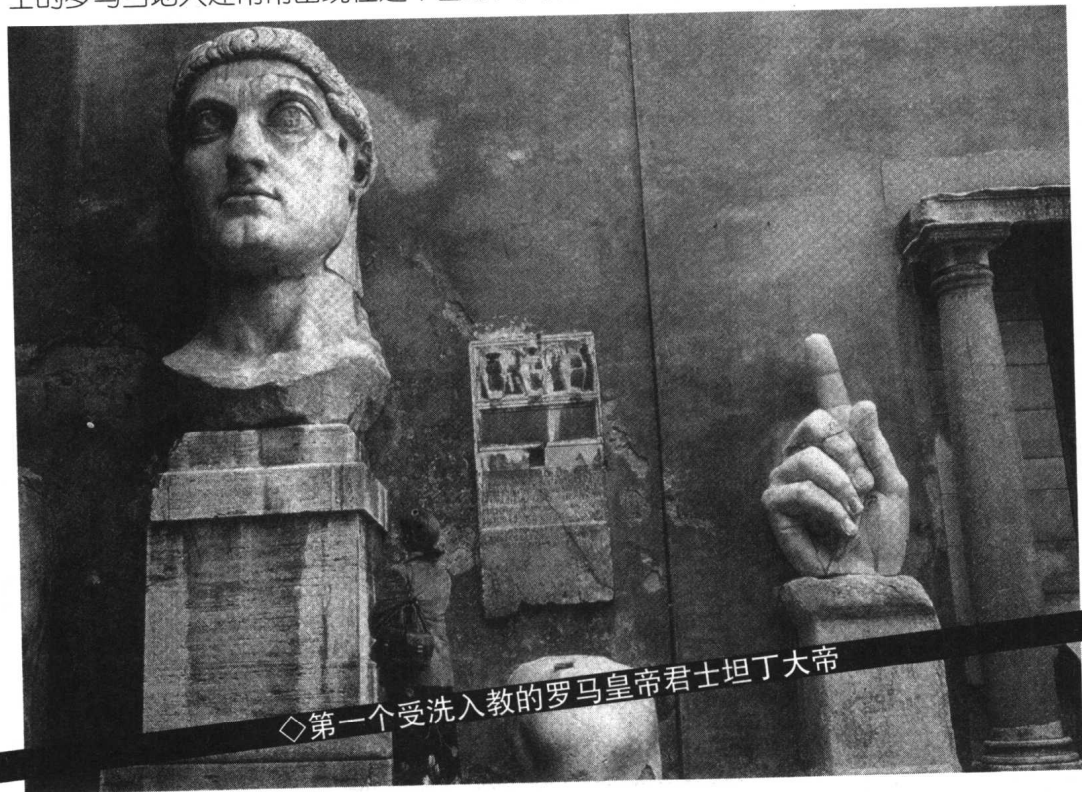
◇第一个受洗入教的罗马皇帝君士坦丁大帝

公元403年以后，罗马的圆形竞技场不再举行角斗。然而在现代的罗马城，装扮成角斗士的罗马当地人还常常出现在这个圆形大剧场的废墟周围，从拍照的游客那里赚取“高