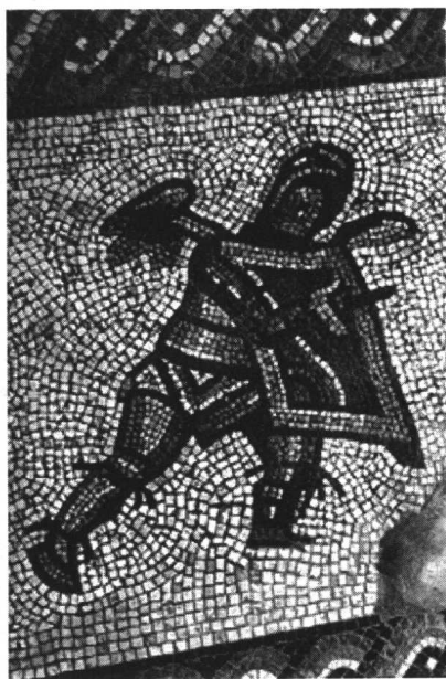
◇角斗士形象(马赛克)