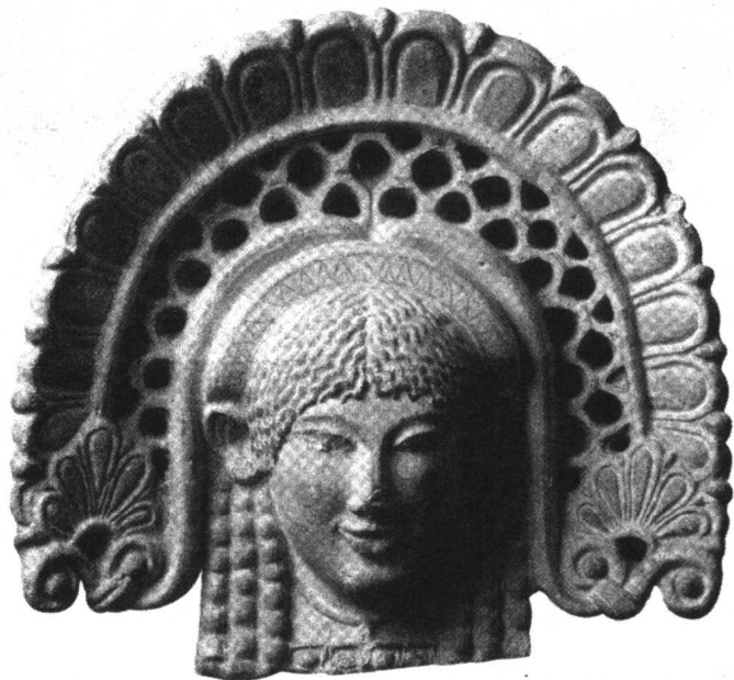
◇埃特鲁斯坎人头像图

角斗娱乐一般被认为源于埃特鲁斯坎(Etruria)人,我们如今所看到的几乎90%以上的相关资料都是这样写的,亦即:角斗娱乐不是罗马人自己创造的,而是从埃特鲁斯坎人那里吸取的。