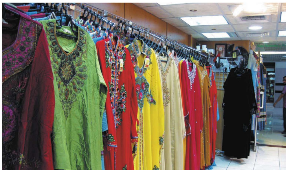
世界上许多国家都有着悠久的刺绣历史。