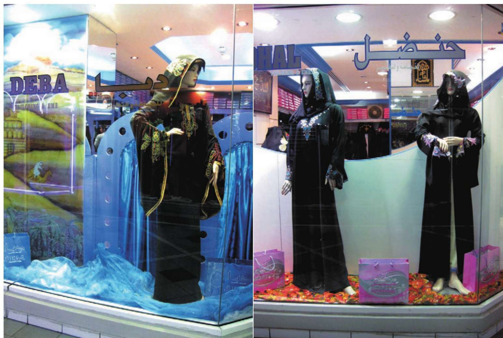
图为笔者2010年在阿联酋迪拜拍摄的穆斯林女性绣花黑袍和居家绣花长裙。刺绣大多集中在服装的胸口、领口、袖口及盖头上面。刺绣图案有各种花卉等纹样，十分美观大方，并常常在刺绣纹样中装饰以华丽的珠宝，极富立体感。