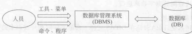
图 1-2 数据库系统的基本结构

数据库系统(DataBase System, DBS)是由实现有组织地、动态地存储大量的相关数据以及方便多用户访问的计算机软、硬件资源组成的系统。DBS 就是为完成某一应用目标而进行数据处理的整个计算机系统。广义地讲,数据库系统由以下 5 部分组成:硬件系统、数据库集合、数据库管理系统及相关软件、数据库管理人员和用户。在 DBS 中,以数据库管理系统为工具,在硬件系统和相关软件的支持下,用系统工具、菜单、命令和程序等多种方式对数据库进行操作,其基本结构如图 1-2 所示。