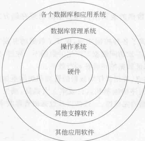
图 1-3 软件系统的层次结构

数据库管理系统(DataBase Management System,DBMS)是一种负责数据库的定义、建立、操纵、管理、维护的软件系统,是数据库系统的核心部分。如 SQL Server、Oracle、Sybase、Informix、DB2、Visual FoxPro 等产品都是比较著名的 DBMS。在计算机软件体系中,从层次上看,数据库管理系统和数据库之间的关系如图 1-3 所示。