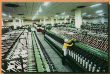
二十九团工业龙头企业——银纺公司