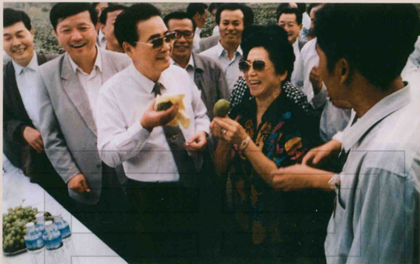
1996年9月6日,国务院总理李鹏(前右三)携夫人朱琳(前右二)来二十九团视察工作。