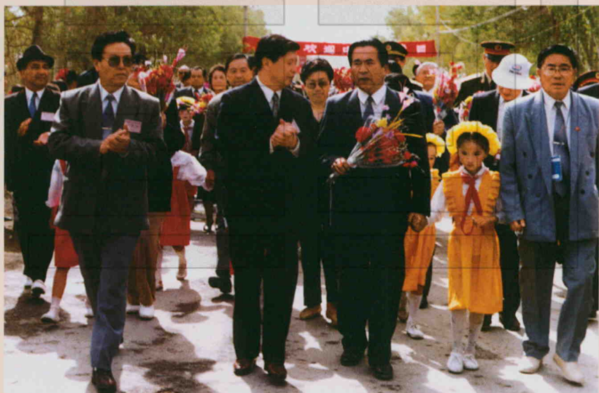
1995年10月3日,全国人大常委会副委员长铁木尔·达瓦买提(前左三)率中央代表团来二十九团慰问,受到当地群众的热烈欢迎。农二师政委王建臻(前左二)、二十九团政委杨逢春(前左一)等陪同。