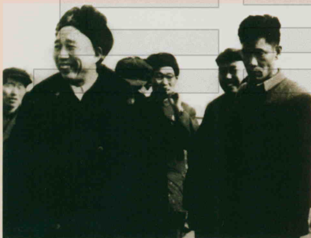
1960年冬，国家 农垦部部长王震（前左 一）视察六团农场（今 二十九团）。