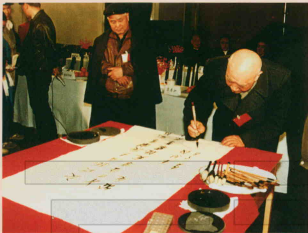
1992年1月25日，二十九团在乌鲁木齐市兴建的孔雀大厦举行开业典礼，全国政协副主席王恩茂（右一）参加了剪彩仪式，并题词慰勉。