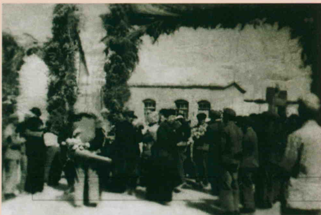
1952年10月， 中央代表团亲切慰问 十八团（今二十九 团）官兵。