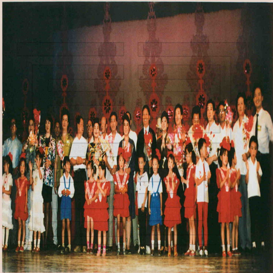
1990年，中央“心连心”艺术团来二十九团慰问演出。