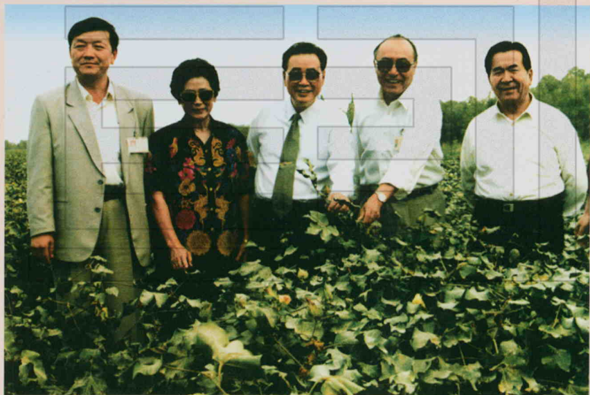
1996年9月6日,国务院总理李鹏(左三)携夫人朱琳(左二)来二十九团视察,与全国人大常委会副委员长铁木尔·达瓦买提(左五)、二十九团团团长张昌霖(左一)、政委李征(左四)在棉田合影留念。