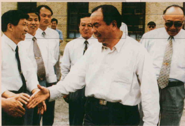
1996年5月19日，新疆维吾尔自治区党委书记、兵团第一书记、第一政委王乐泉（前中）来到二十九团，在二十九团政委李征（右一）、副政委赵文进（左一）、副团长魏银新（左二）、副团长邹跃斌（左三）、总会计师李忠华（左四）的陪同下视察工作。