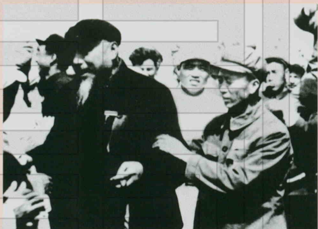
1954年，中国人民 解放军慰问团慰问农六 团（今二十九团）战士。