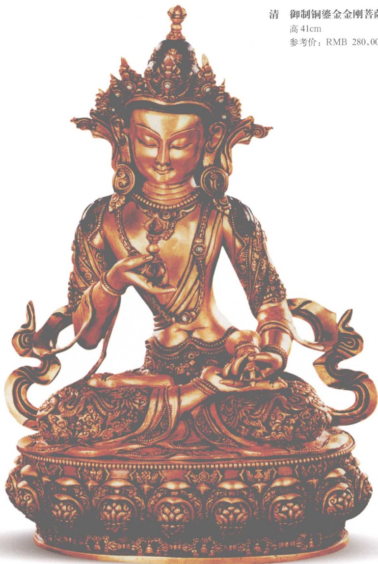
清 御制铜鎏金金刚菩萨 高 41cm 参考价：RMB 280,000 元