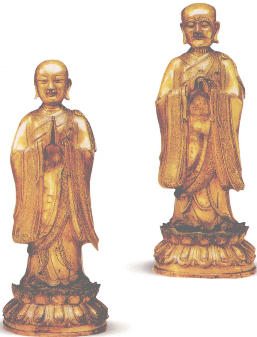
明 铜鎏金罗汉（一对）