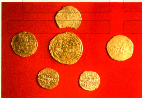
达勒特古城出土的金币

另据当地老人介绍,20世纪60年代末期,在达勒特古城遗址的周围,还有3至5座约80米见方的小城和8个高约20余米的土台,后来由于人口增多,开辟荒地,才逐渐平毁,这是