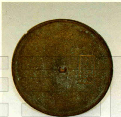
达勒特古城出土的铜镜

从以上对博乐市达勒特古城的简要介绍来看,此城是北疆地区较大的古代城市之一,非历史上重要和繁荣的城市不会有此规模。它的建筑规模之大,形制之复杂,是现今博尔塔拉境内偏西的其他两座古城所不能比的。