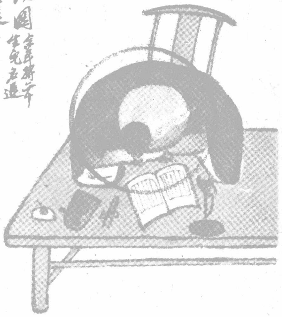
夜 讀 圖