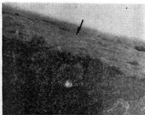
经电子显微镜摄影的横切面照片

注：照片为观察到的镀银片涂覆 BY-2 润滑剂后的横切面情况，箭头所指即为 BY-2 润滑剂涂层，下部为银片断面。电子显微摄影放大4000倍。