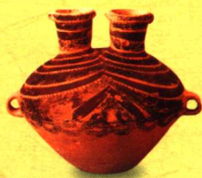
彩陶平行带纹双颈壶

唐人遗留下来的壶相当原始，流装在肩上，很短，大多比注要低些，以防流中还没淌出什么，注那个地方早已泛滥了。强调功能性的壶，流高于腹肩，以防酒水过早地流失掉了。壶柄通常狭小到不足容二指之隙，因此只能捏着，不能拎着或提着，于是大多还要有系，感觉挺累赘——用绳子穿在系上拎了来，放平了，再换过手，小壶用拇指和食