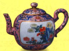
粉彩开光花卉纹执壶