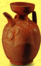
繁昌窑影青釉蝴蝶纹壶