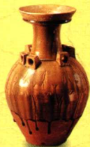
青釉莲瓣纹盘口壶

言归正传。宋代时，除了耀州窑继续着它独特的、满满的浮雕似的刻花、印花艺术表现形式外，类似手法和划花等工艺在北方诸窑系也相当流行，如磁州窑系和定窑系。而定窑更有将造型艺术融入制壶的典型例证，如收藏于首都博物馆的定窑白釉童子诵经壶。童子诵经壶为人形圆雕式壶身，童子当胸捧着的经卷为流，柄在身后，像腰带在背后打了个结，巧妙之极。此外，南方的青白釉在南宋时期有了一个较大的发展，也流传下一些很精