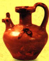
青釉褐斑瓷鸡首壶