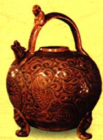
青瓷花卉纹龙首壶