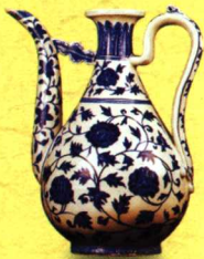
青花缠枝牡丹纹执壶