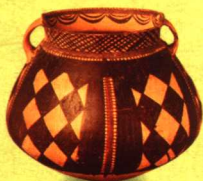
彩陶石叠纹抱付壶