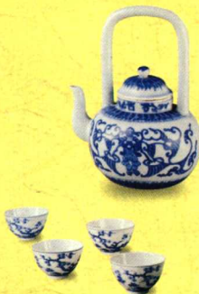
青花提梁壶及茶碗