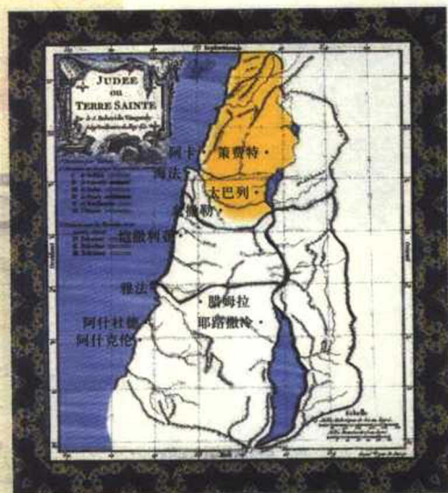
法国人罗伯特·德·范官德于 1790 年绘制的圣地地图上的加利利。