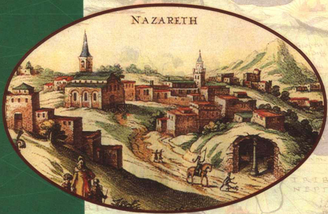
让·让松纽斯所绘地图（局部）