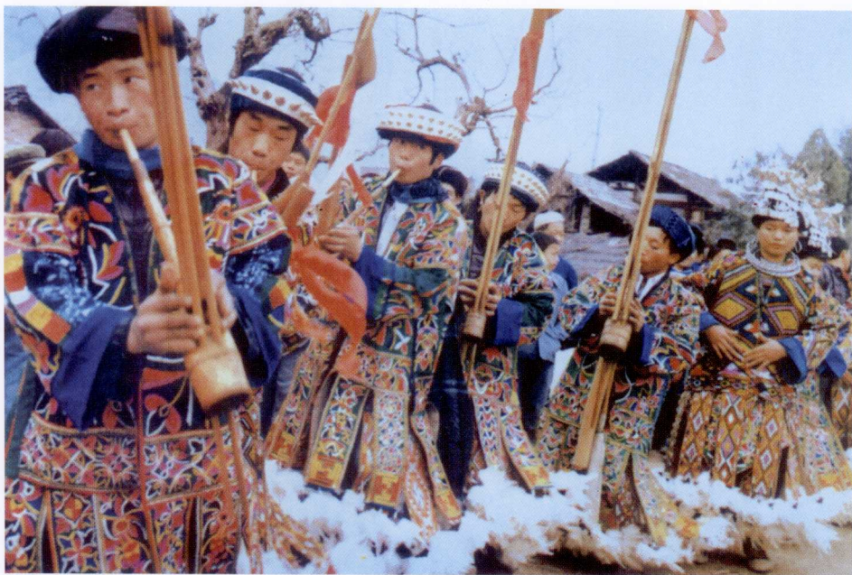
盛装芦笙队