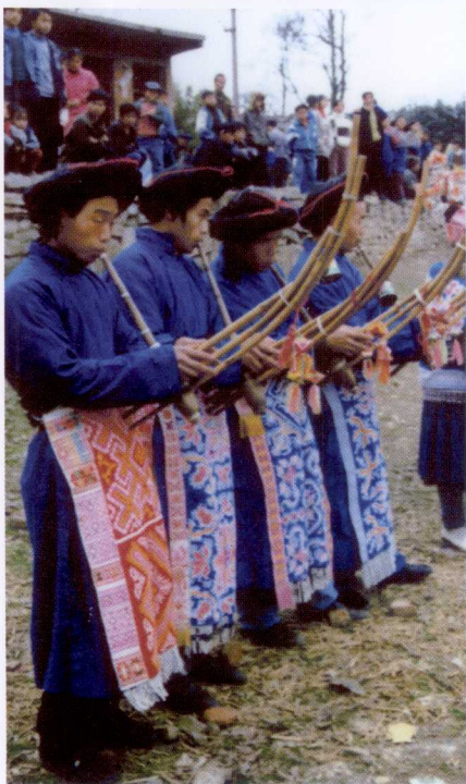
苗族弯管芦笙演奏