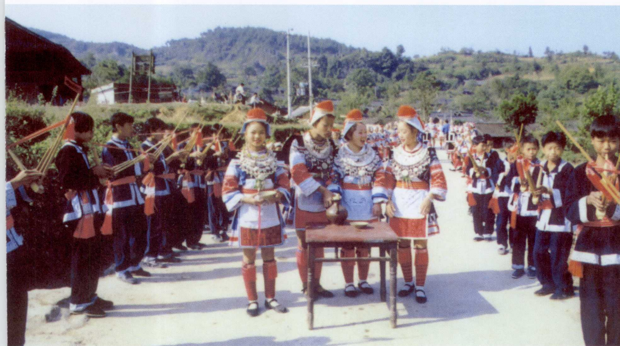
侗家迎客芦笙