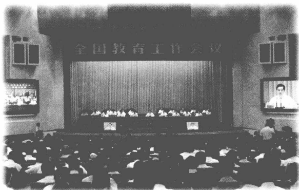
全国教育工作会议在京召开

2010年7月，中共中央、国务院召开全国教育工作会议。胡锦涛总书记在会议上发表重要讲话指出，当今世界的综合国力竞争，说到底就是民族素质竞争。大力发展教育事业，是全面建设小康社会、加快推进社会主义现代化、实现中华民族伟大复兴的必由之路。温家宝总理在会议上也发