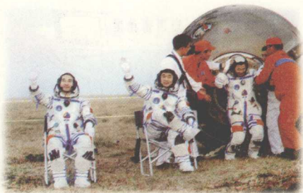
科技创新，为“中国奇迹”提供坚实支撑

加快人才发展是在激烈的国际竞争中赢得主动的重大战略选择。我国正处在改革发展的关键阶段，全面推进经济建设、政治建设、文化建设、社会建设以及生态文明建设，推动工业化、信息化、城镇化、市场化、国际化深入发展，全面建设小康社会，实现中华民族伟大复兴，必须大力提高国民素质，在继续发挥我国人力资源优势的同时，加快形成我国人才竞争比较优势，逐步实现由人力资源大国向人力资源强国的转变。实施人才强国战略是党中央、国务院作出的重大决策，人才强国战略已成为我国经济社会发展的一项基本战略。《国家中长期人才发展规划纲要（2010—2020年）》指出，实施人才强国战略就是要培养造就一批善于治国理政的领导人才，一批经营管理水平高、市场开拓能力强的优秀企业家，一批世界一流水平的科学家、科技领军人才、工程师和高水平的哲学社会科学专家、文学家、艺术家、教育家，一大批技艺精湛的高技能人才，一大批社会主义新农村建设带头人，一大批职业化、专业化的高级社会工作人才，充分发挥高层次人才在经济社会发展和人才队伍建设中的引领作用。我国人才发展的总体目标是：培养和造就规模宏大、结构优化、布局合理、素质优良的人才队伍，确立国家人才竞争比较优势，进入世界人