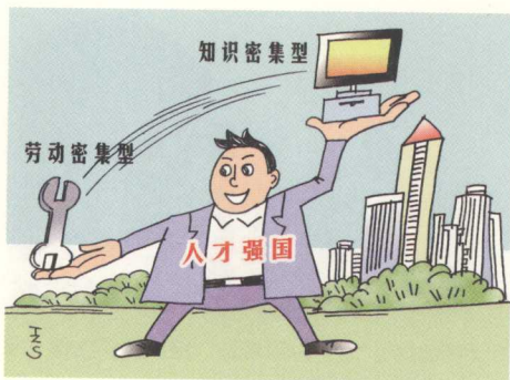
真正的人才强国

才强国行列,为在本世纪中叶基本实现社会主义现代化奠定人才基础。实施人才工程是做好人才工作的重要抓手,《国家中长期人才发展规划纲要(2010—2020年)》设计了12项重大人才工程,既全面覆盖又突出