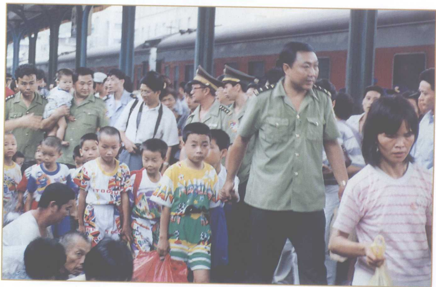
到外地解救被拐妇女儿童回遵的民警受到了英雄般的欢迎