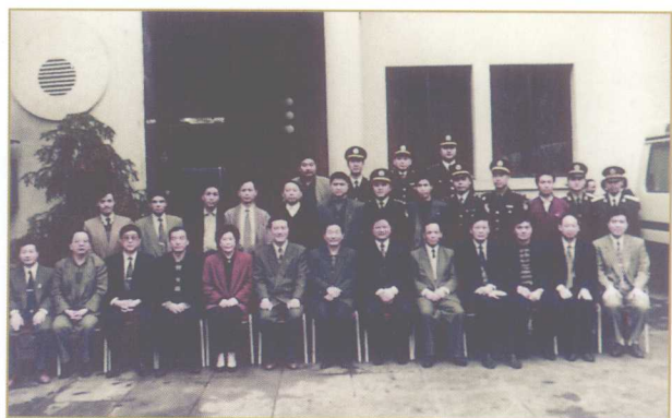
1996年4月25日，中共中央政治局常委、国务院副总理朱镕基（前排左七）在有关领导的陪同下来遵视察，与警卫人员合影。

1995年4月18日，中共中央政治局常委、国务院副总理李岚清（前排左八）在有关领导的陪同下来遵视察，与警卫人员合影。