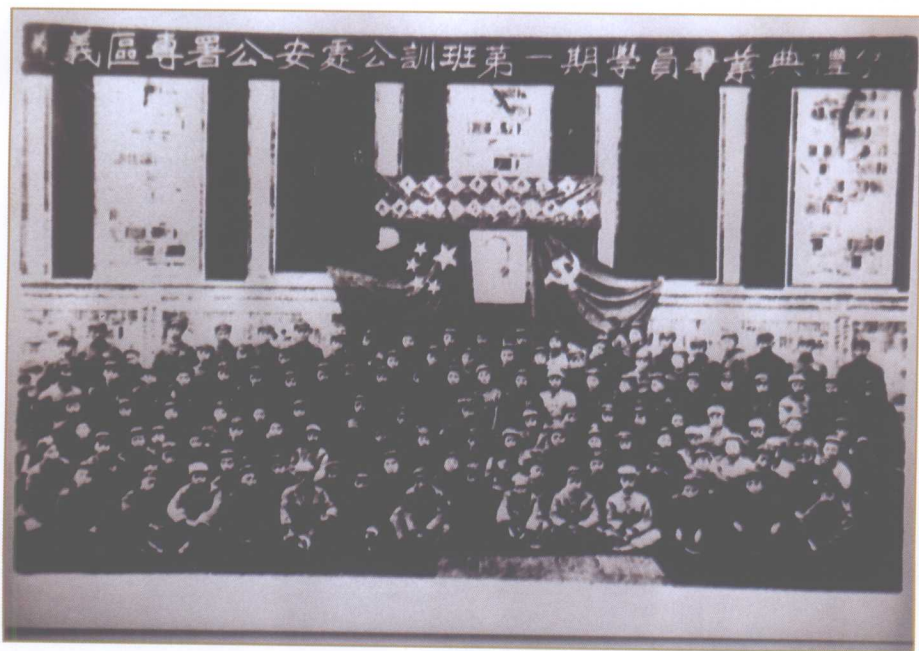
1951年2月，遵义地区专署公安处第一期公训班合影