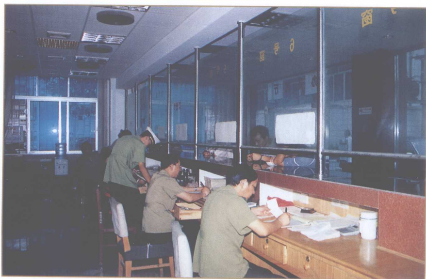
公安局办证处热情服务