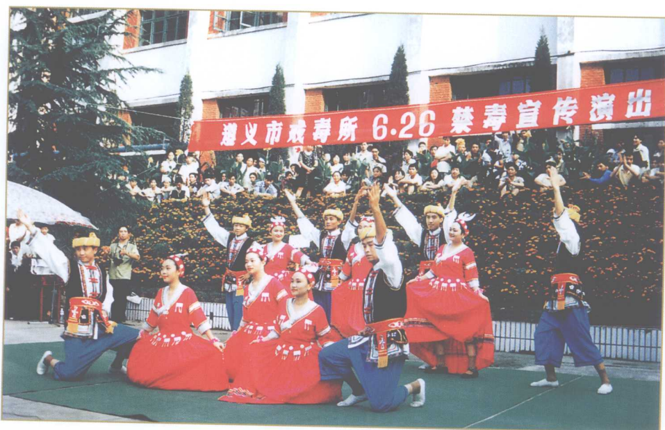
戒毒人员在“6·26”国际禁毒宣传日表演自编自导的文艺节目，以表达戒除毒瘾重获新生的喜悦。