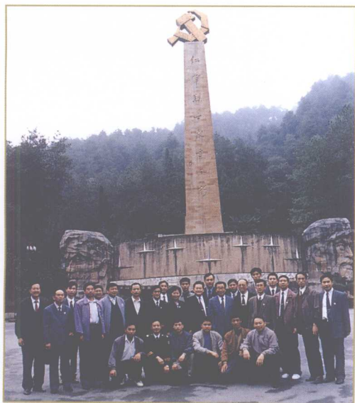
1994年10月17日，中共中央政治局常委、全国政协主席李瑞环（二排右六）在有关领导的陪同下来遵视察，与警卫人员合影。

1996年5月14日，中共中央政治局常委、中央书记处书记、中央党校校长胡锦涛（左二）等有关领导在遵义市公安局听取公安工作情况汇报。