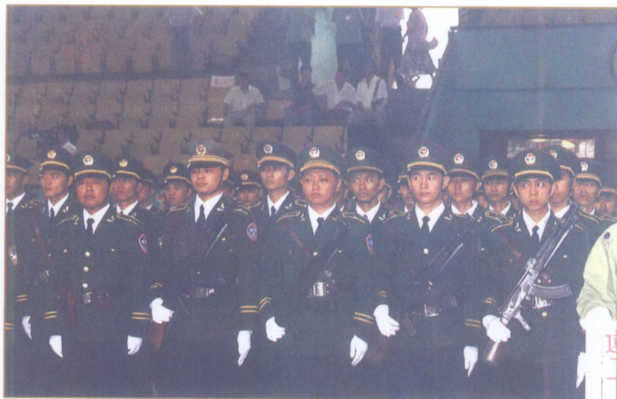
全区经济民警大比武