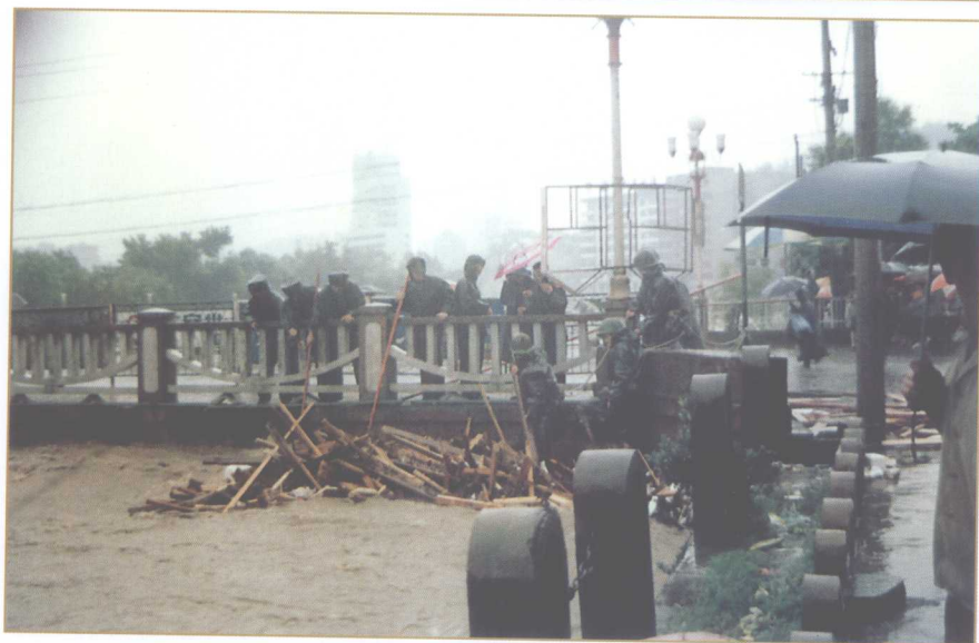
公安民警在抗洪抢险第一线