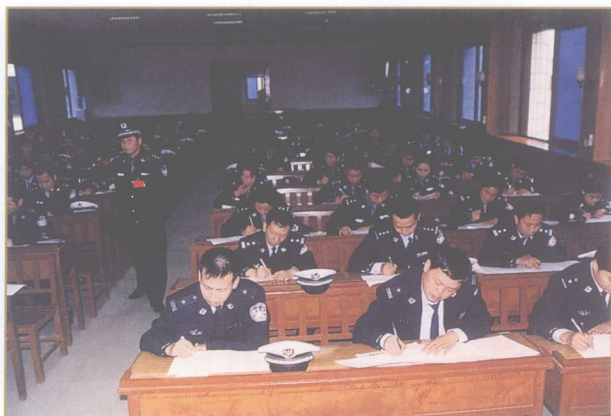
市公安局注重民警业务技能和文化素质的全面提高。图为民警正在参加市局组织的考试。