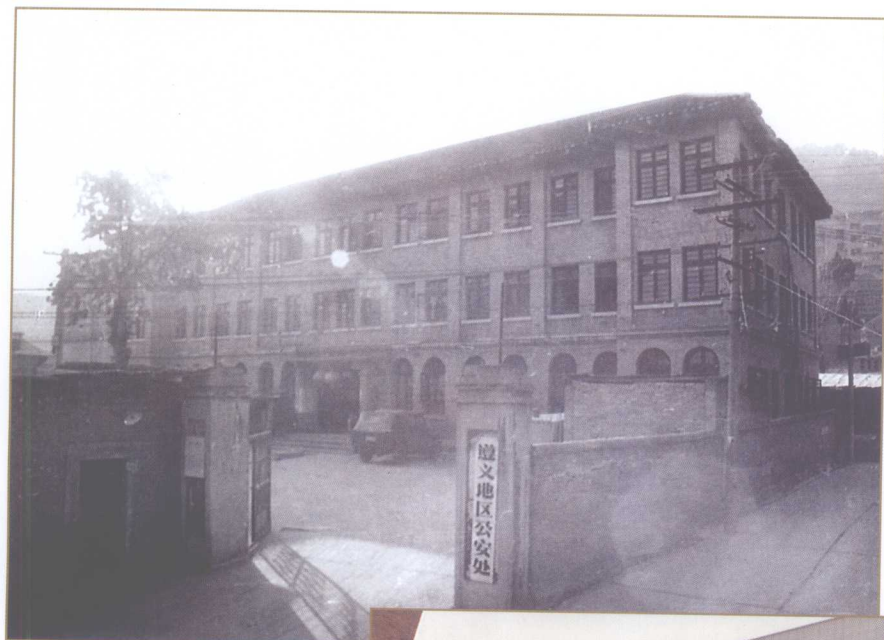
原遵义地区公安处办公大楼