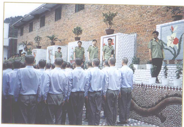
公安部监管局领导参观、考察遵义市公安局看守所。