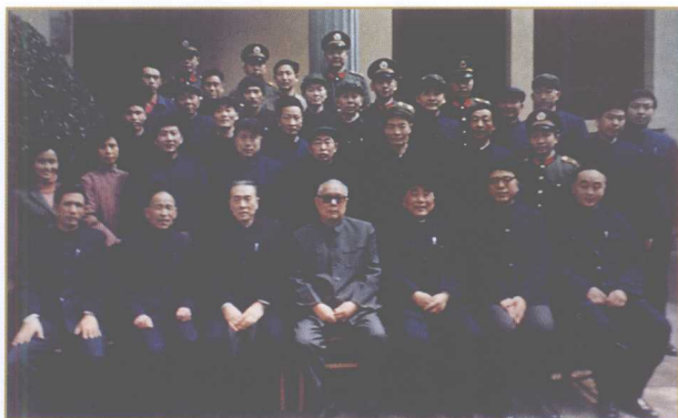
1985年3月17日，中共中央政治局常委、国家主席李先念（前排左四）在有关领导的陪同下来遵视察，与警卫人员合影。