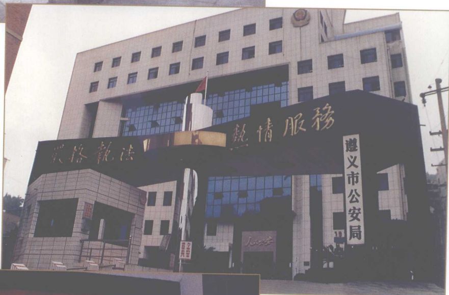
遵义市公安局新办公大楼