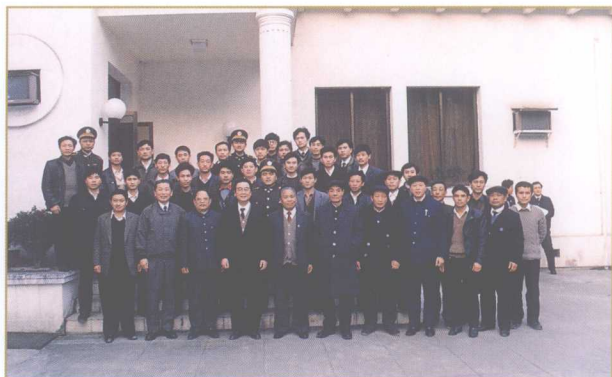
1991年2月8日，中共中央政治局常委、国务院总理李鹏（前排左四）在有关领导的陪同下来遵视察，与警卫人员合影。