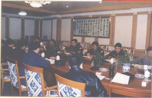
市局党委中心组学习组认真学习中央有关文件。