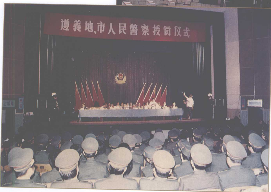
1993年4月，公安民警首次授衔、换装大会