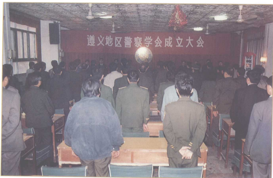
1994年10月11日，遵义地区警察学会成立大会