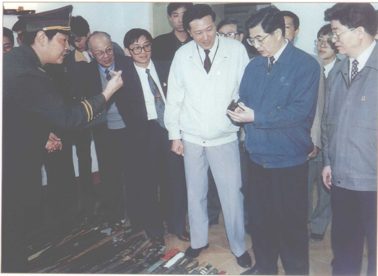
1996年5月14日，中共中央政治局常委、中央书记处书记、中央党校校长胡锦涛（右二）等中央领导同志在省、市领导的陪同下到遵义市公安局视察