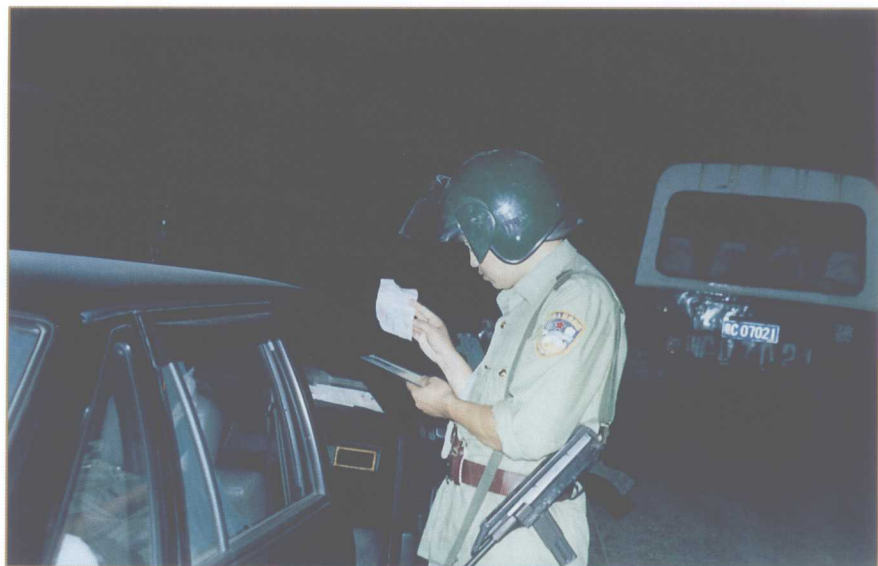
认真盘查可疑人员和车辆