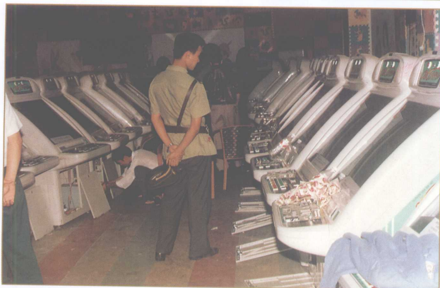
捣毁一批用于赌博的牌机