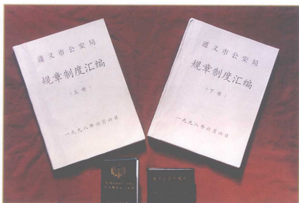
1997年，市公安局党委提出了“所有的工作都在制度的规范之中，全部的执法活动都在法律的监督下，民警的一切行为都在纪律的约束之内。”的队伍建设要求。图为制定的83种制度汇编、警务督察100条扣分标准和民警记分手册。