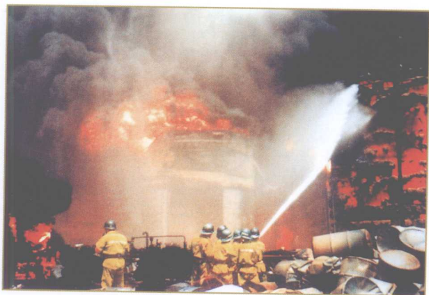
消防战士在灭火战斗中