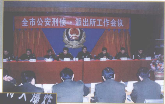
全市公安刑侦、派出所改革工作会议。