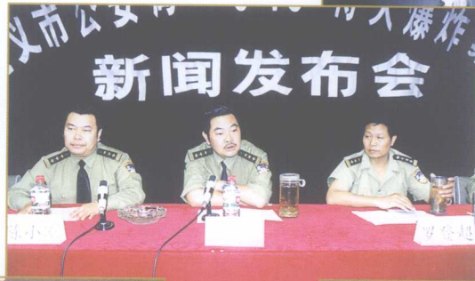
市公安局举行重大案件新闻发布会。