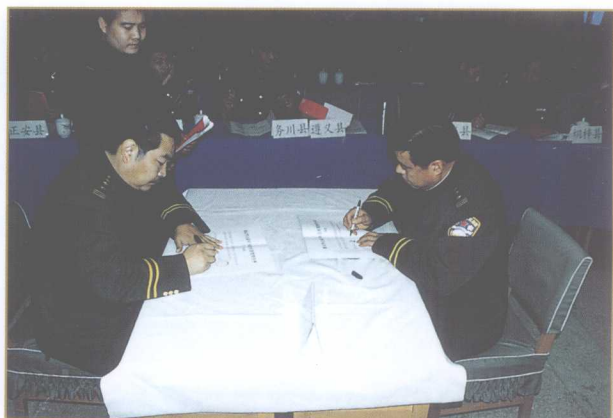
市局领导与各县、自治县、区（市）公安局、分局及市局机关各部门主要负责人签订岗位目标责任状。