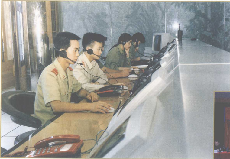
110报警服务台按照“四有四必”的要求，认真接受群众的报警、求助。