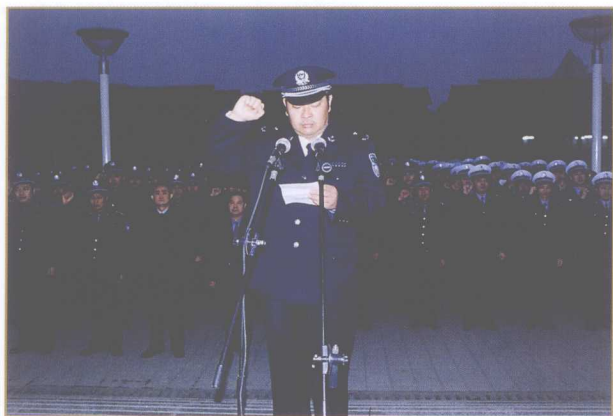
2001年1月1日，市公安局在纪念广场举行换装及升旗仪式。