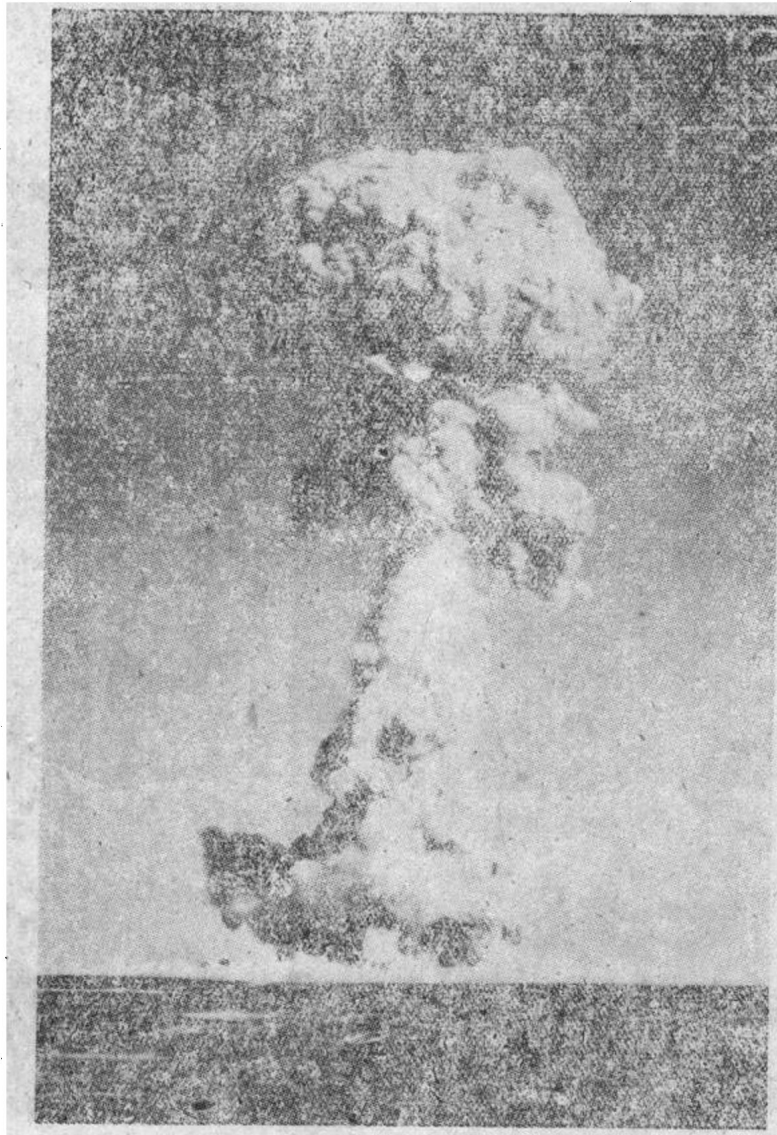
照片2 原子弹爆炸蘑菇状烟云