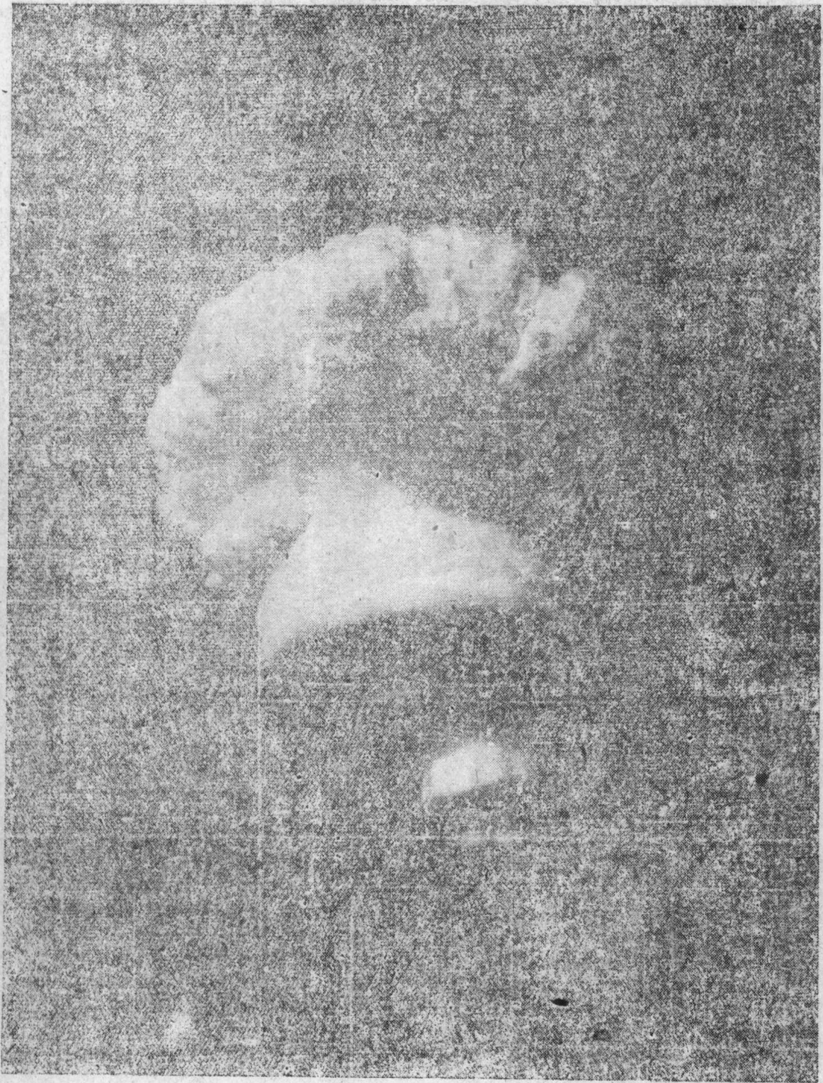
照片3 氢弹爆炸蘑菇状烟云