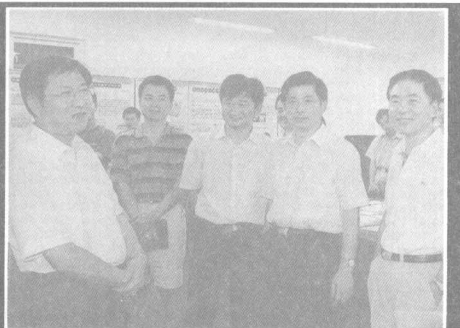
寧波市市長毛光烈與市內各區學生代表合影