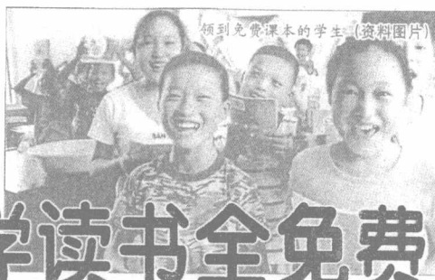
领到免费课本的学生 (资料图片)