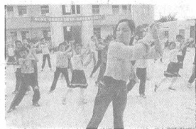
▲八八八集团民工子弟学校民工子弟学校骨干教师授课。