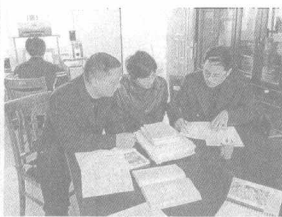
▲实验小学的教师在对其他小学教师进行业务指导。教育共同体组建以后，农村学校教师教育和教学科研都有了很大的依靠。

县教育的失衡，更多在于城乡落差严重。浙江省宁海县近年来推出“1+1”教育共同体，在不打破现行体制的前提下，让城市优质教育资源与农村共同分享，较有效地推动了城乡教育均衡发展。