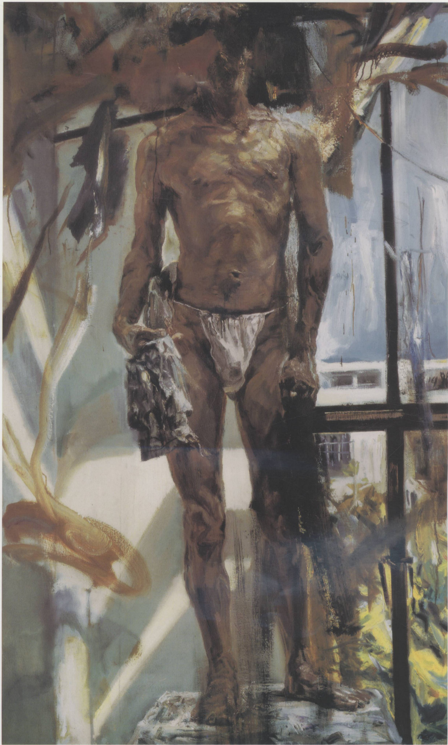
天光教室 160cm × 90cm 崔小冬