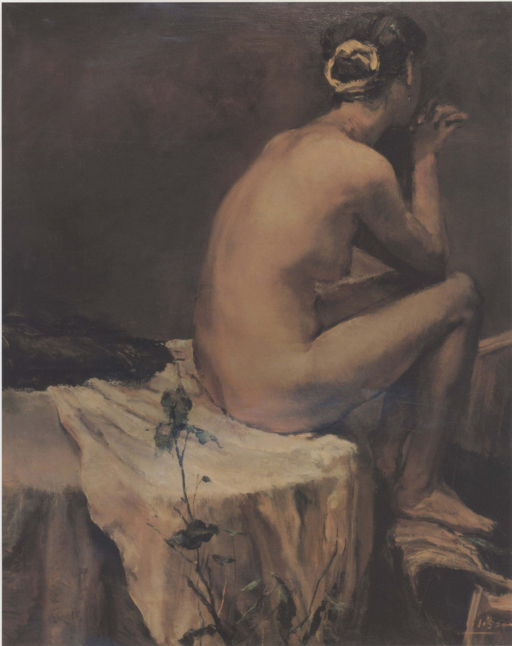
女人体 120cm × 98cm 崔小冬