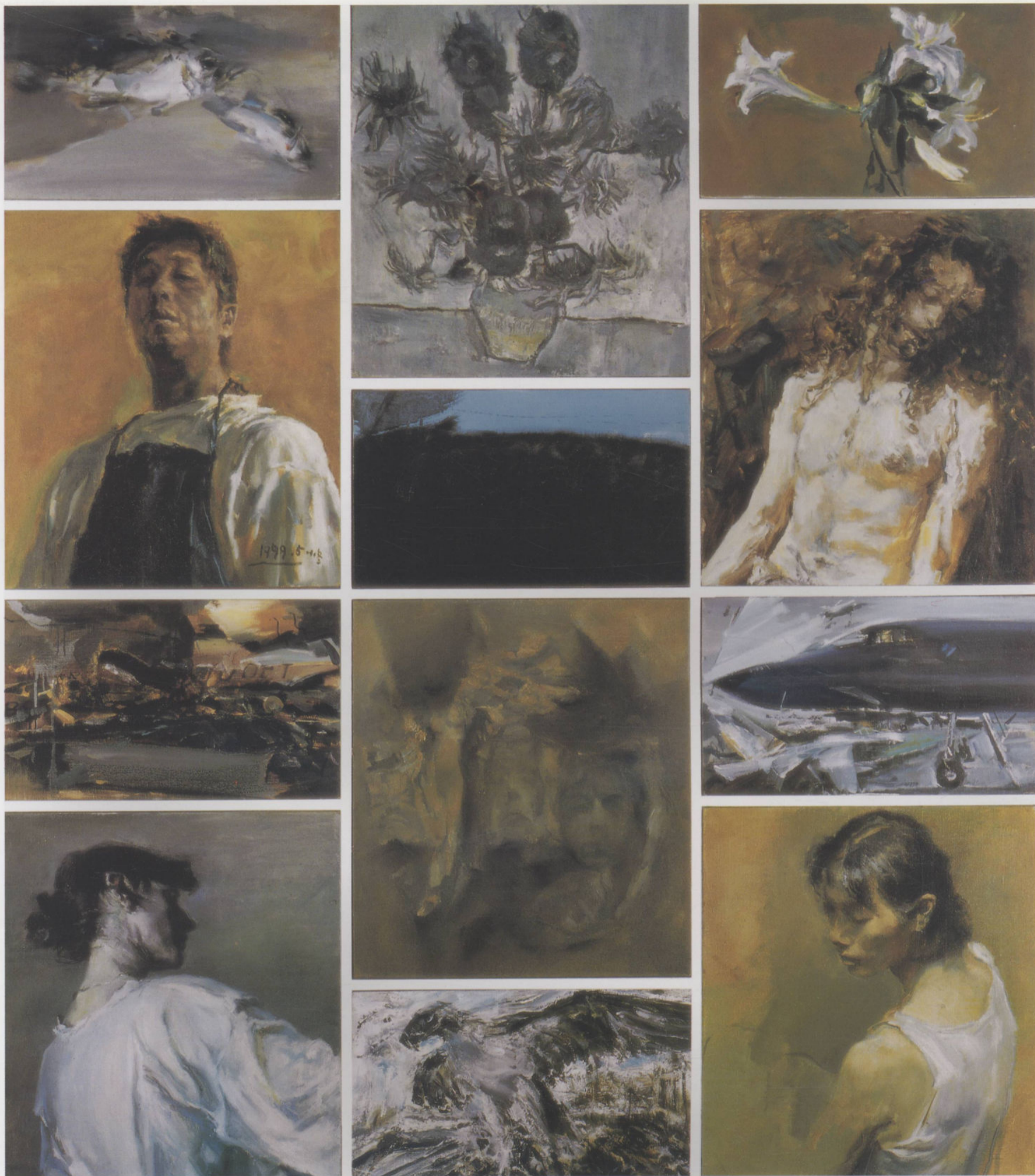
我·kosovo·1999 200cm×150cm 崔小冬