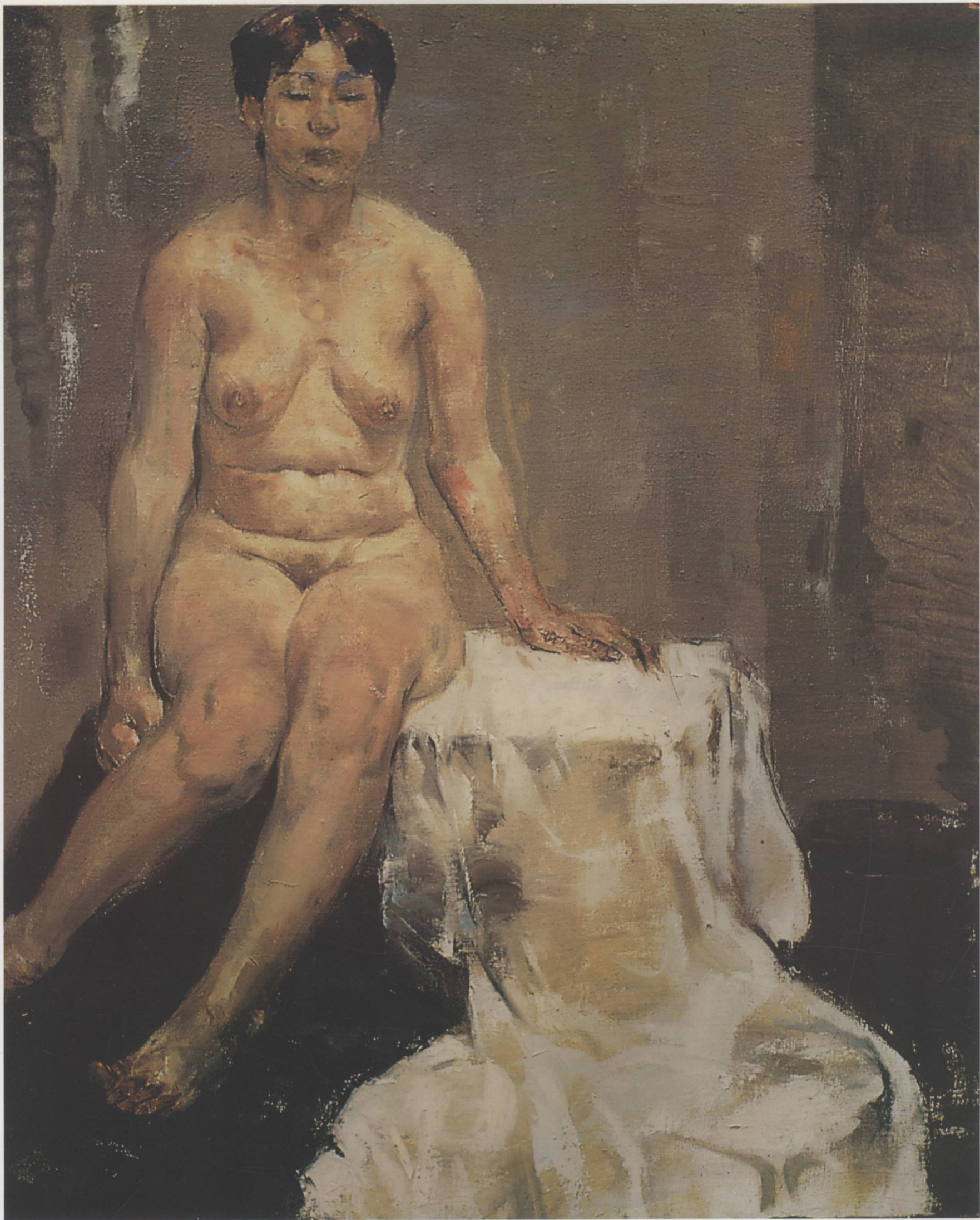
女人体 65cm × 50cm 翁诞宪

作品用笔肯定，灵动的效果与观者的心灵极易达到一种共鸣。对体面、形体结构的强调使画面产生了坚实感。画面笔法上的变化，体现了画家观察真实世界的敏锐眼力。