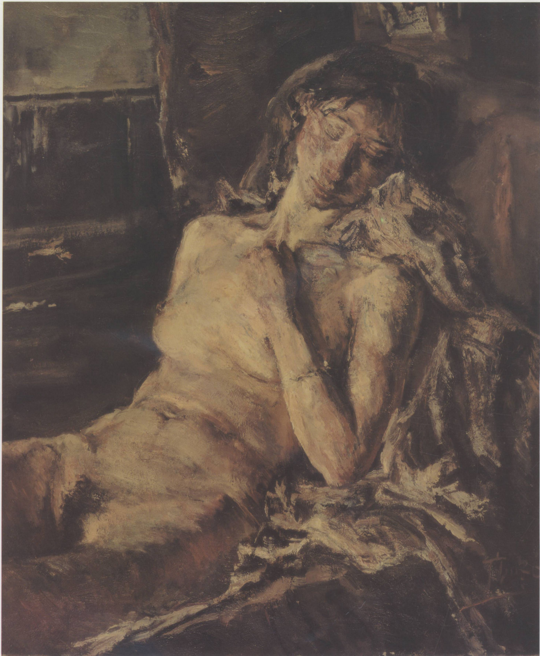
女人体 80cm × 60cm 崔小冬