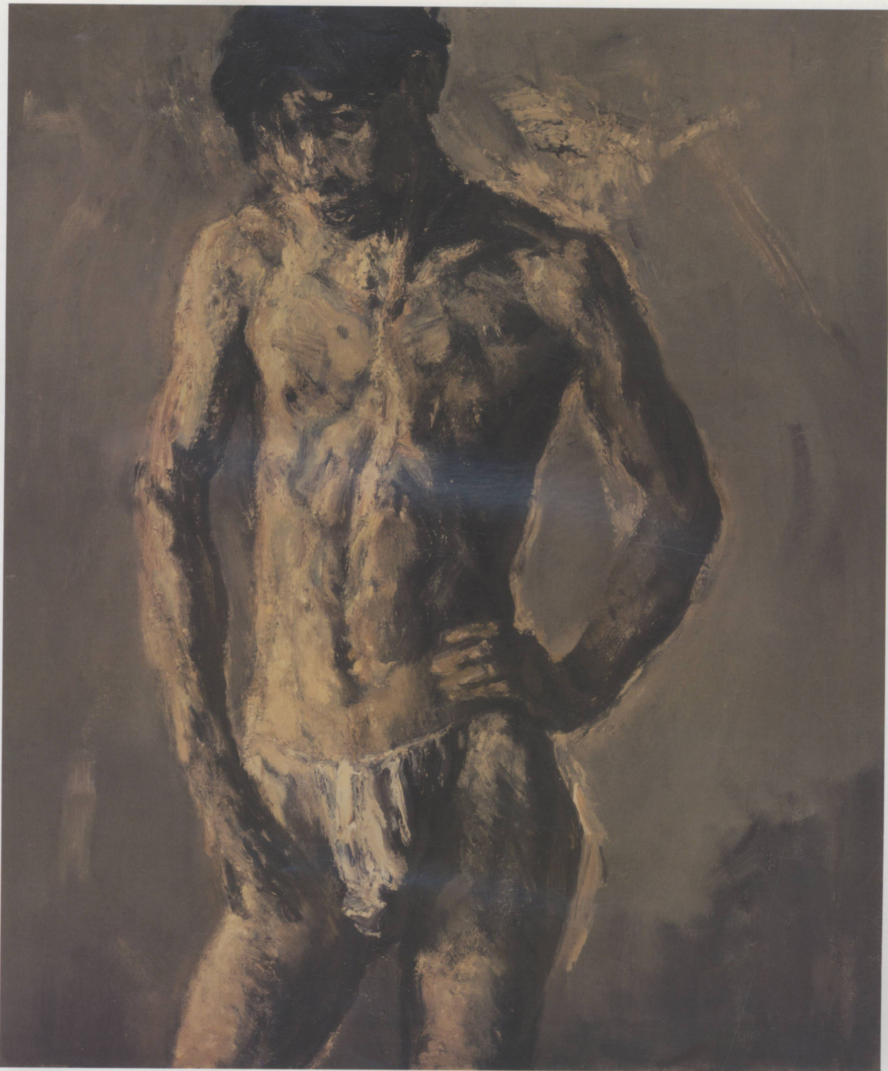
男人体 80cm × 60cm 崔小冬