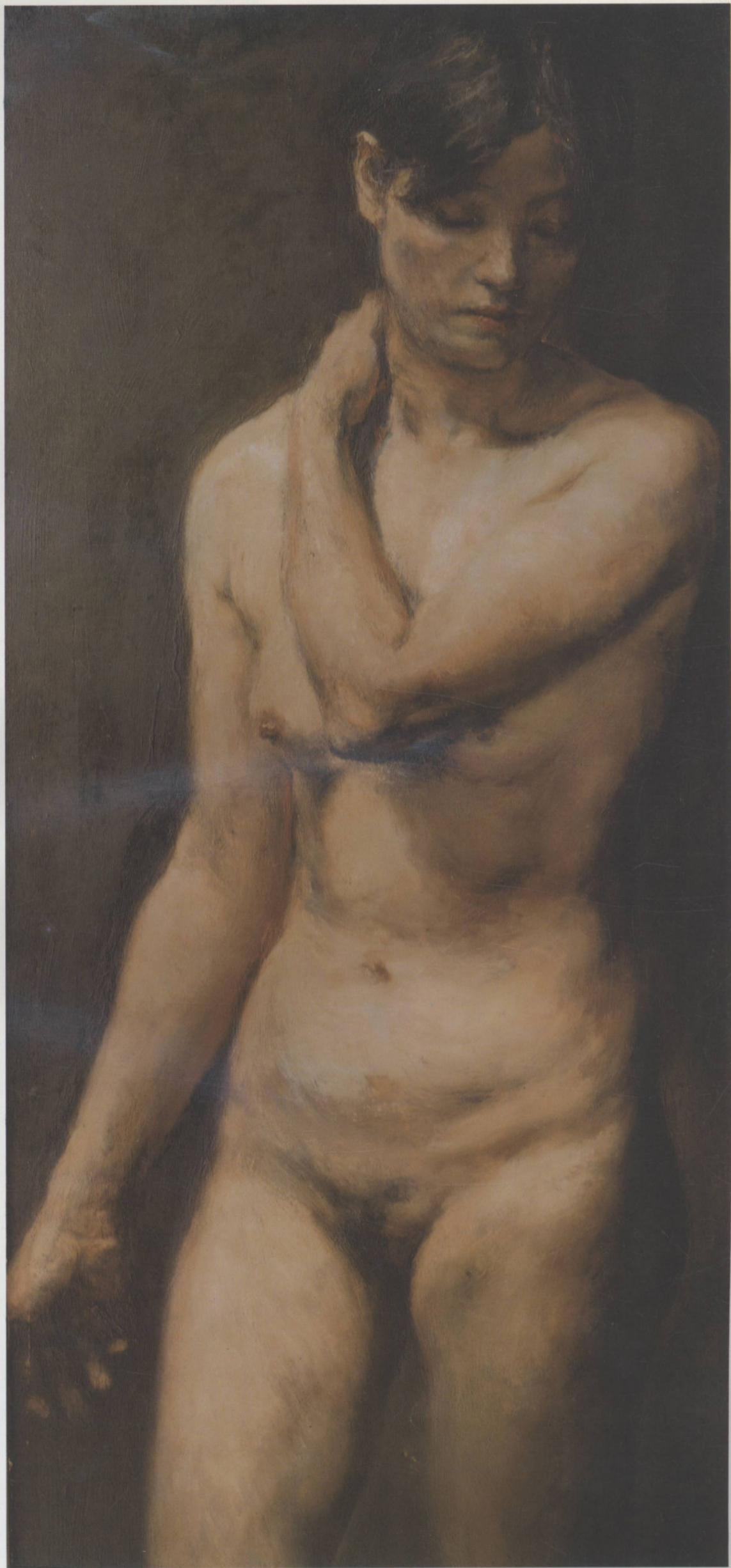
女人体(局部) 160cm × 45cm 崔小冬