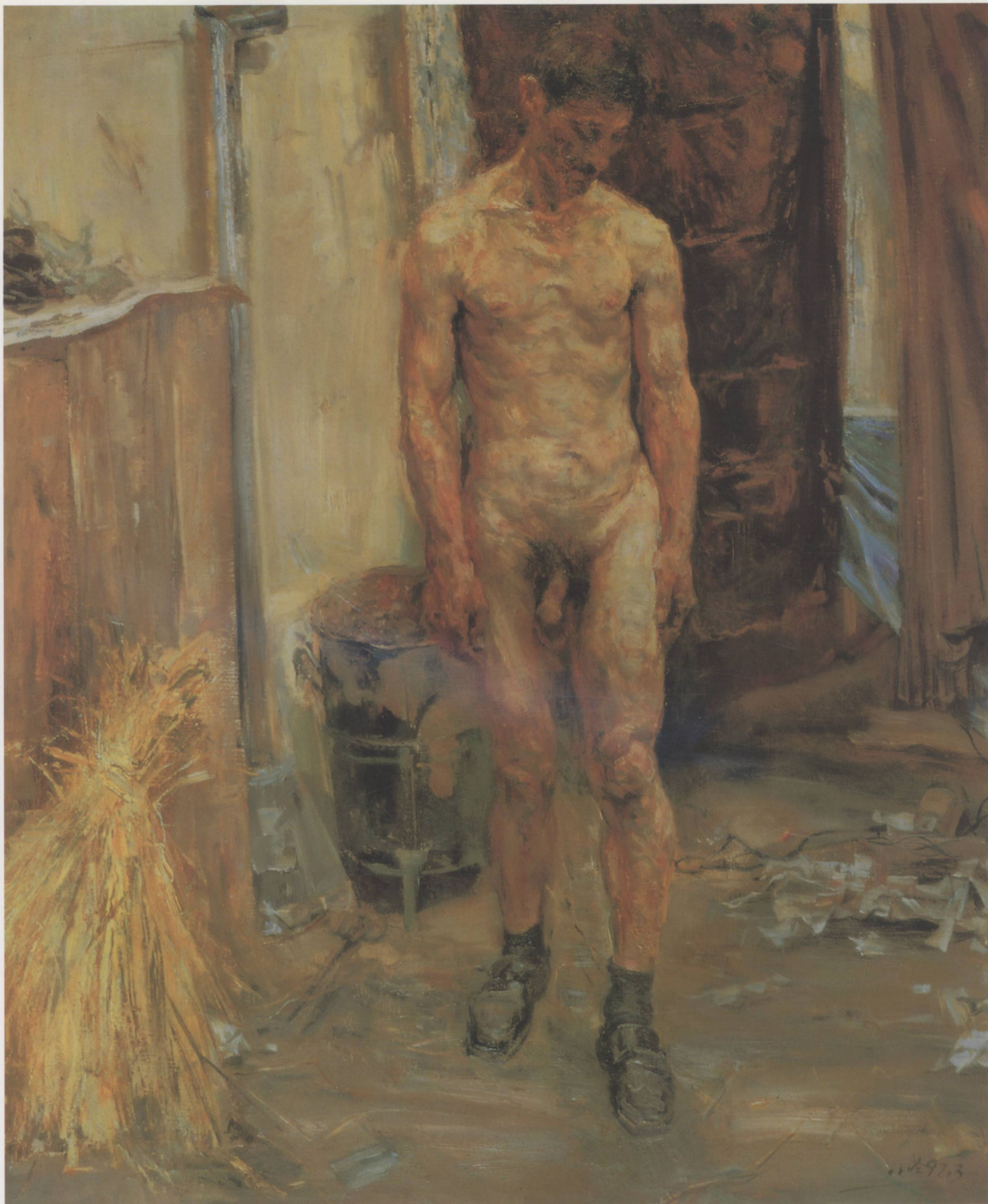
乡村工作室 100cm × 80cm 崔小冬