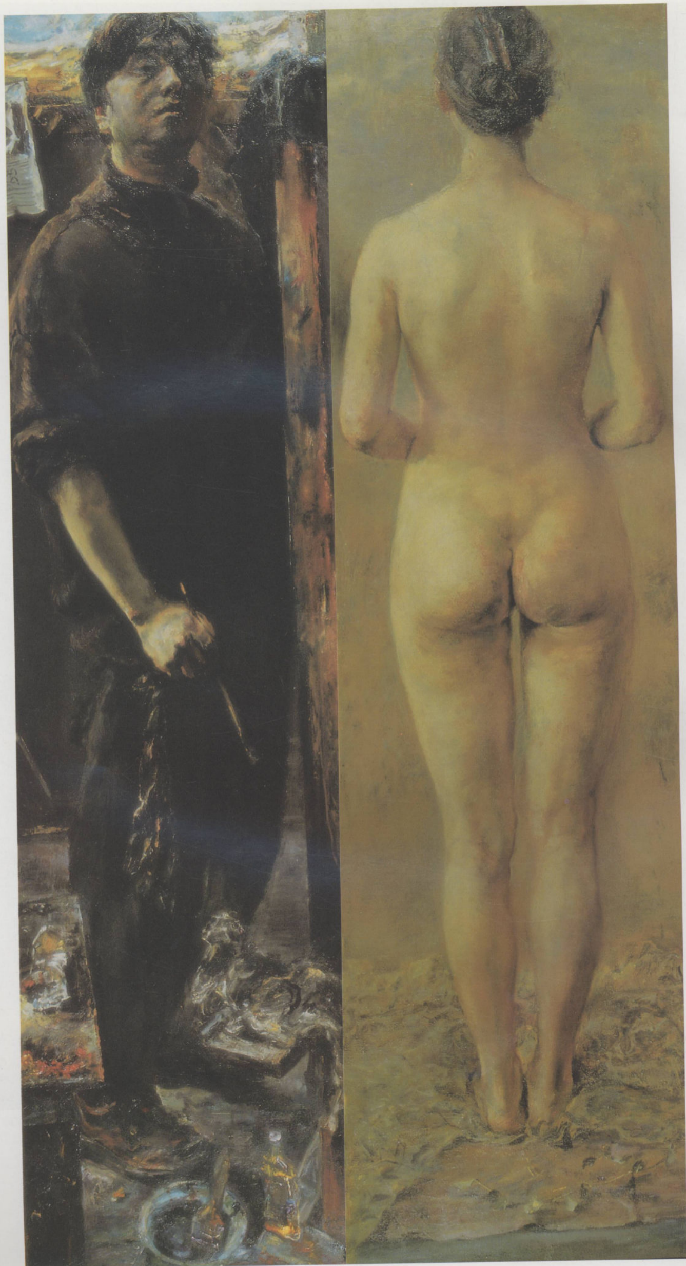
画家与模特 165cm × 90cm 崔小冬