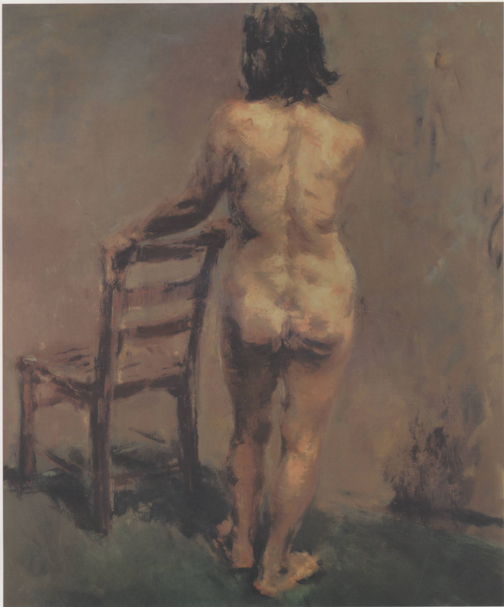
女人体 150cm × 120cm 邬大勇