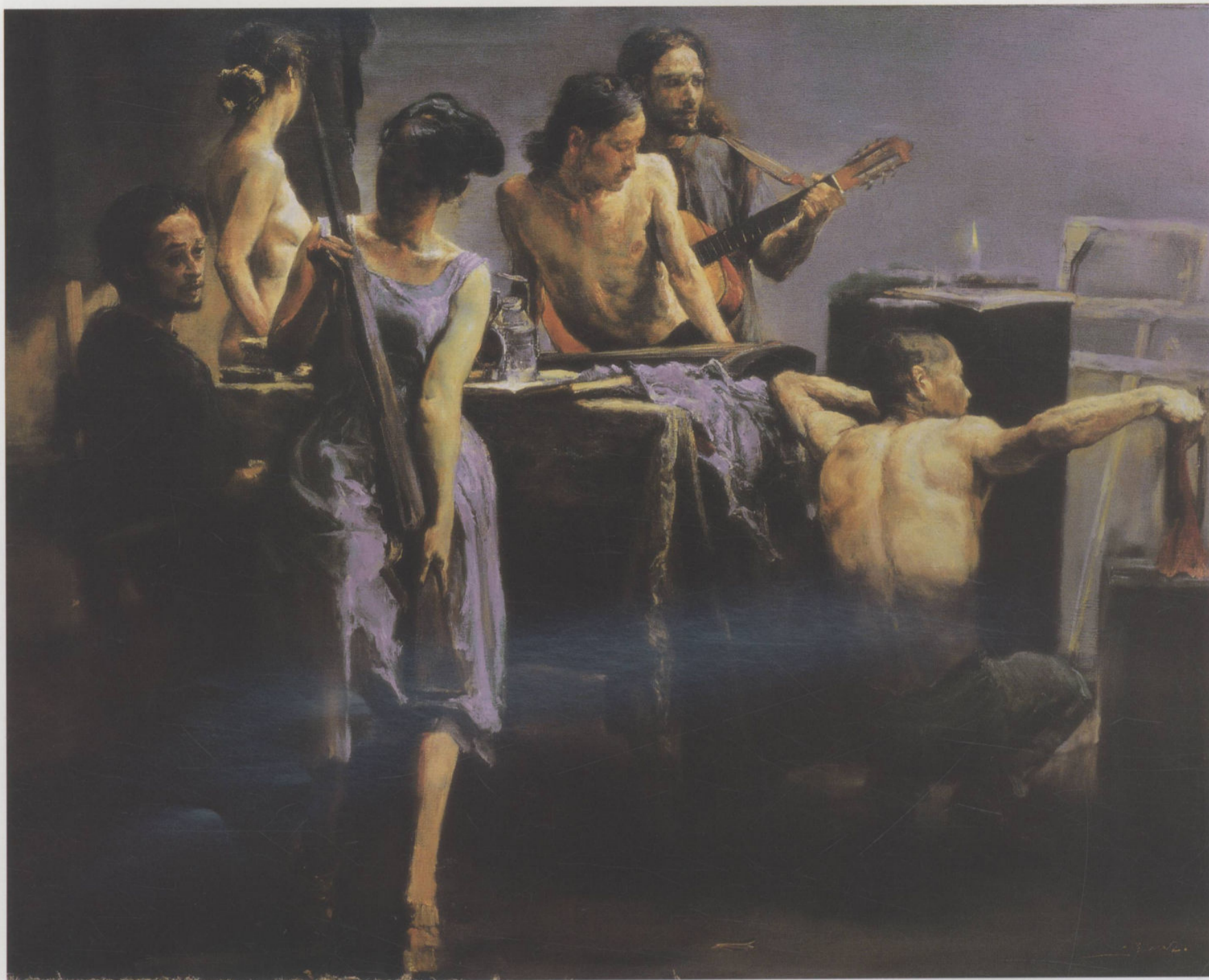
画室 No III 160cm × 130cm 崔小冬