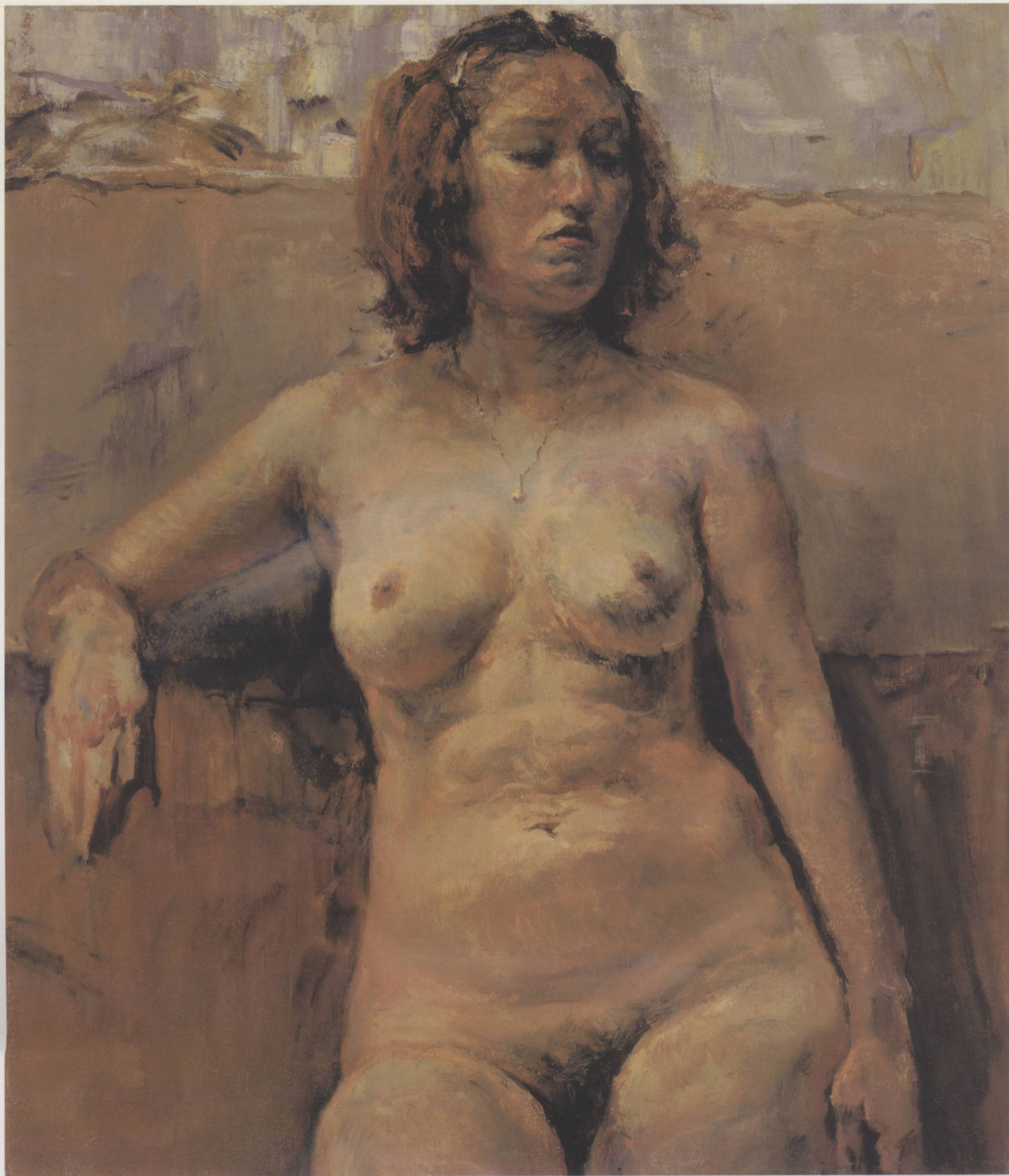
女人体 80cm × 60cm 崔小冬