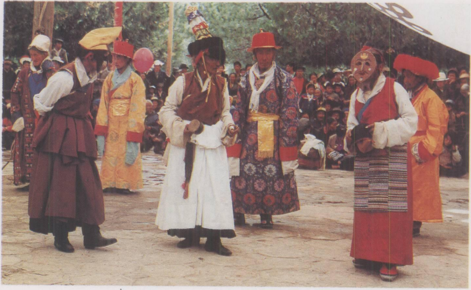
迺巴藏戏《朗萨雯蚌》