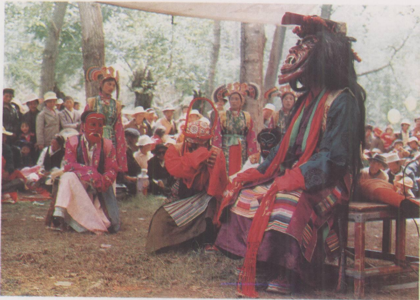
觉木隆藏戏《卓娃桑姆》