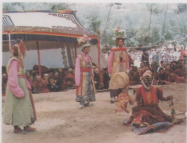
江嘎尔藏戏《诺桑王子》