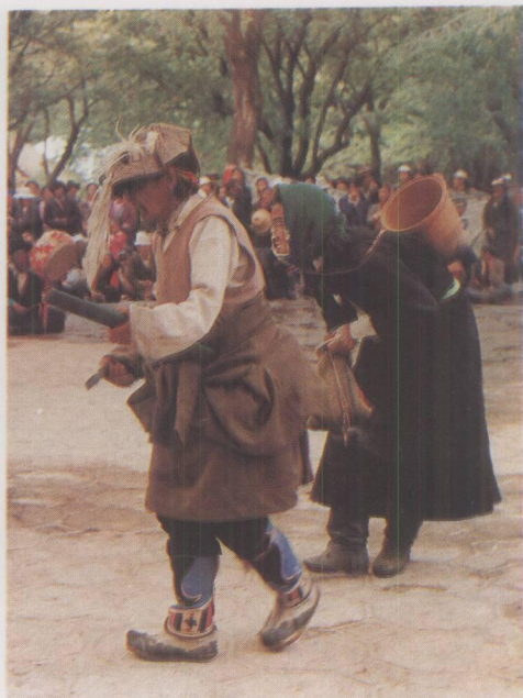
民间藏戏中折嘎的表演