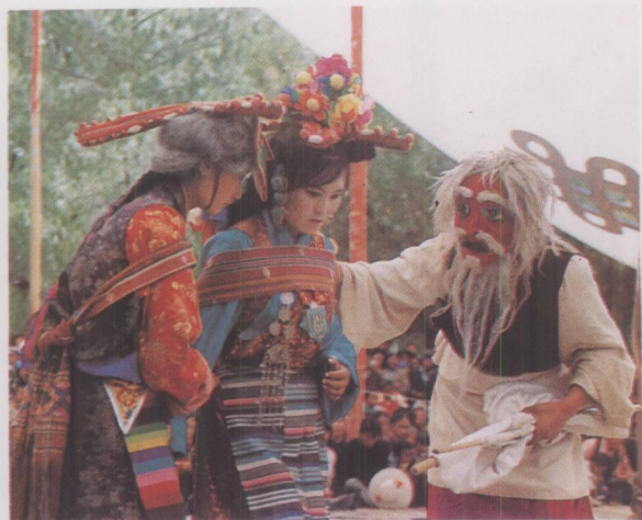
洛扎戏班演出的《卓娃桑姆》