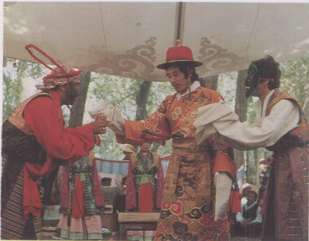
面具与化妆结合的表演