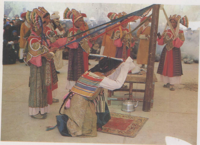
雪巴演出的《白玛文巴》