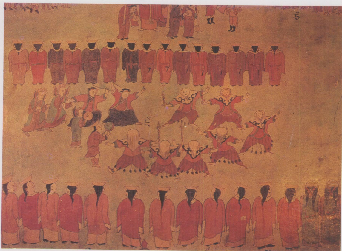
桑耶寺壁画白面具戏