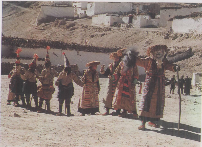
昂仁抗灾歌舞“吉达”