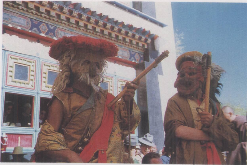
扎什伦布寺跳神中角色巴吾、巴嫫