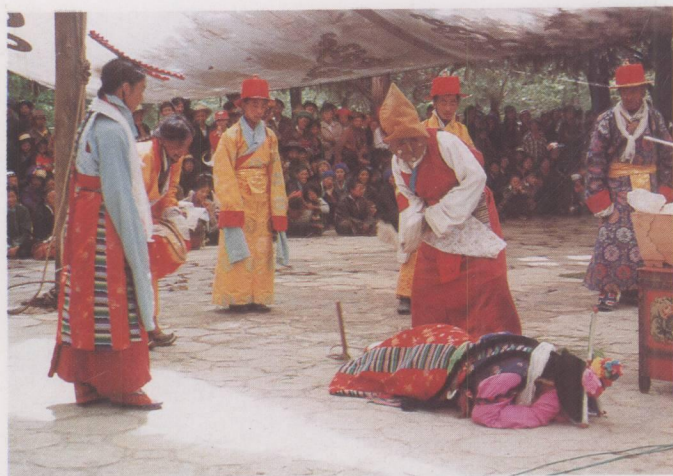
《朗萨雯蚌》中“青稞地里受虐”