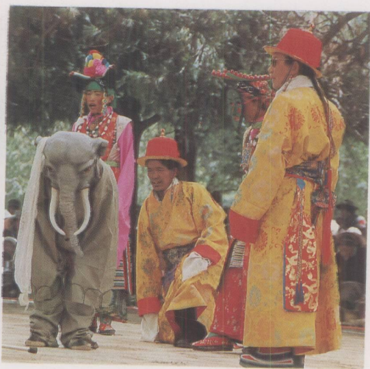
香巴演出的《智美更登》