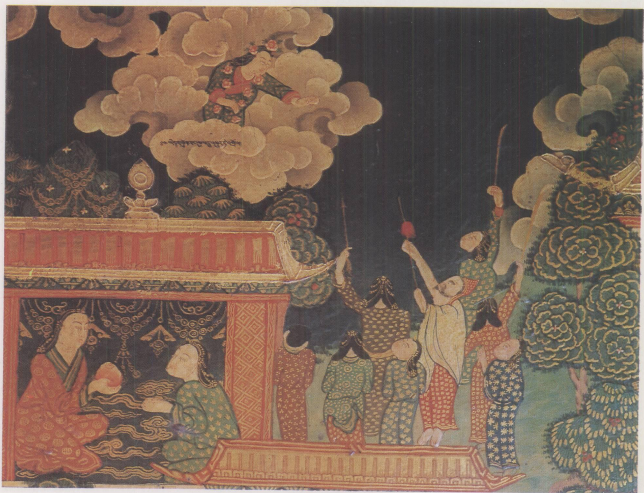
《如意藤·诺桑明言》壁画局部