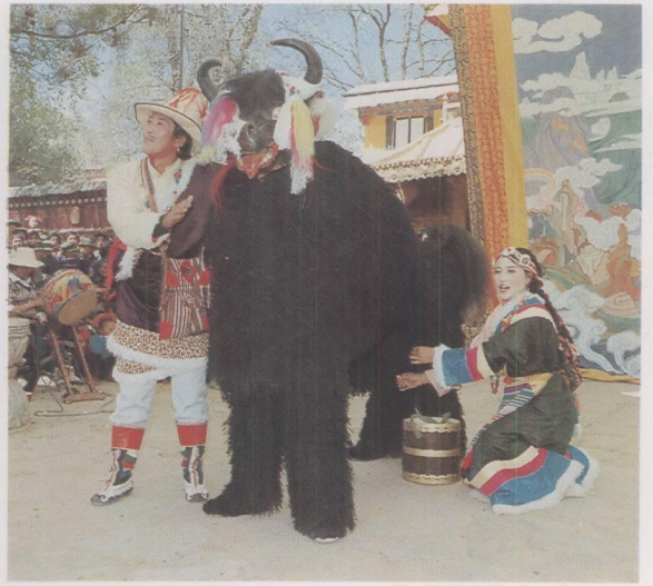
《卓娃桑姆》中“牦牛舞”