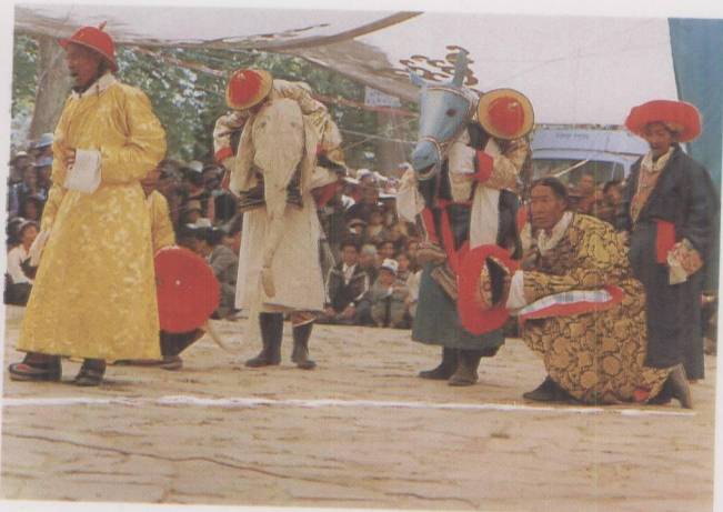
迺巴演出的《顿月顿珠》