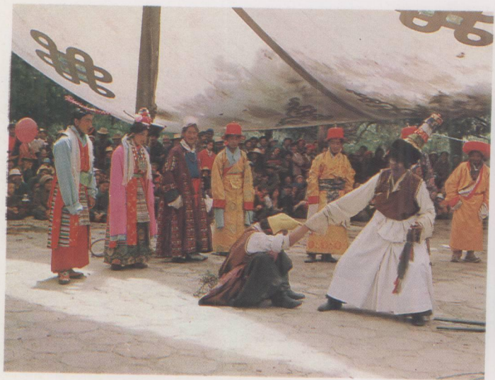
迺巴演出的《朗萨雯蚌》(结布饰云游僧)