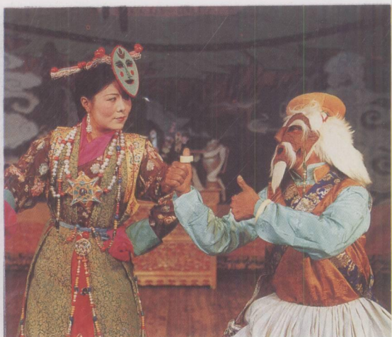
《诺桑法王》中老夫老妻