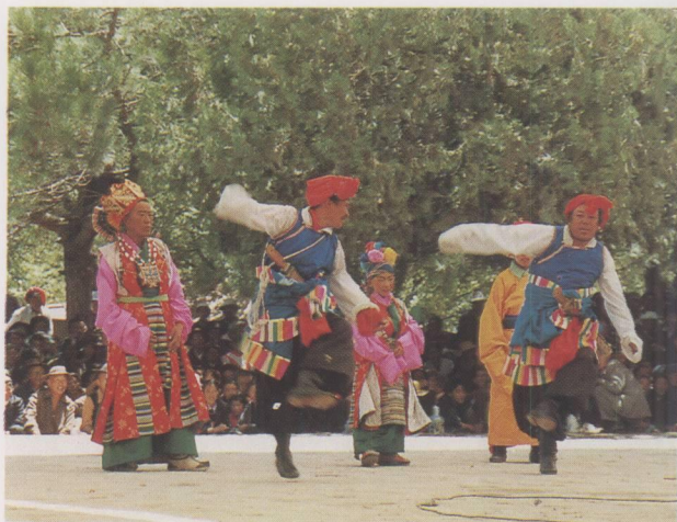
香巴藏戏《智美更登》