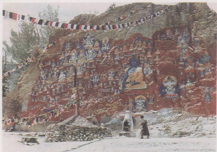
巴热如布前的玛尼堆