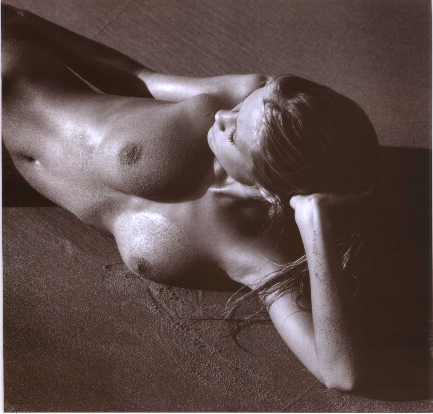
▲ 密斯/雷尼·德·汉 摄