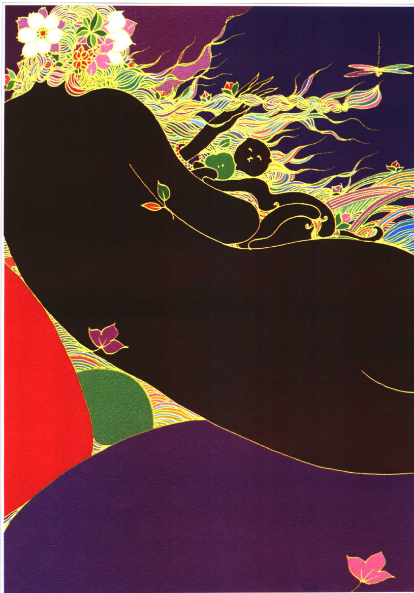
海风 28.5cm × 21cm 2003年