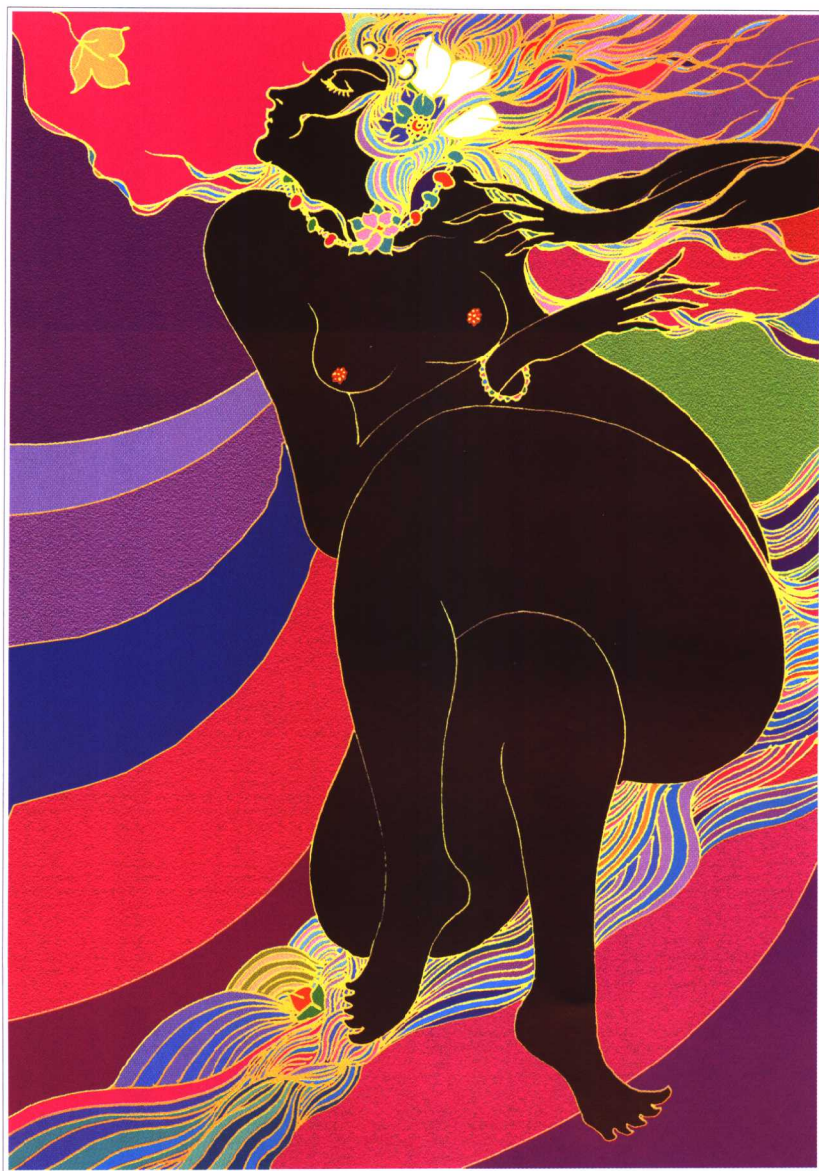
海韵 28.5cm × 21cm 2003年