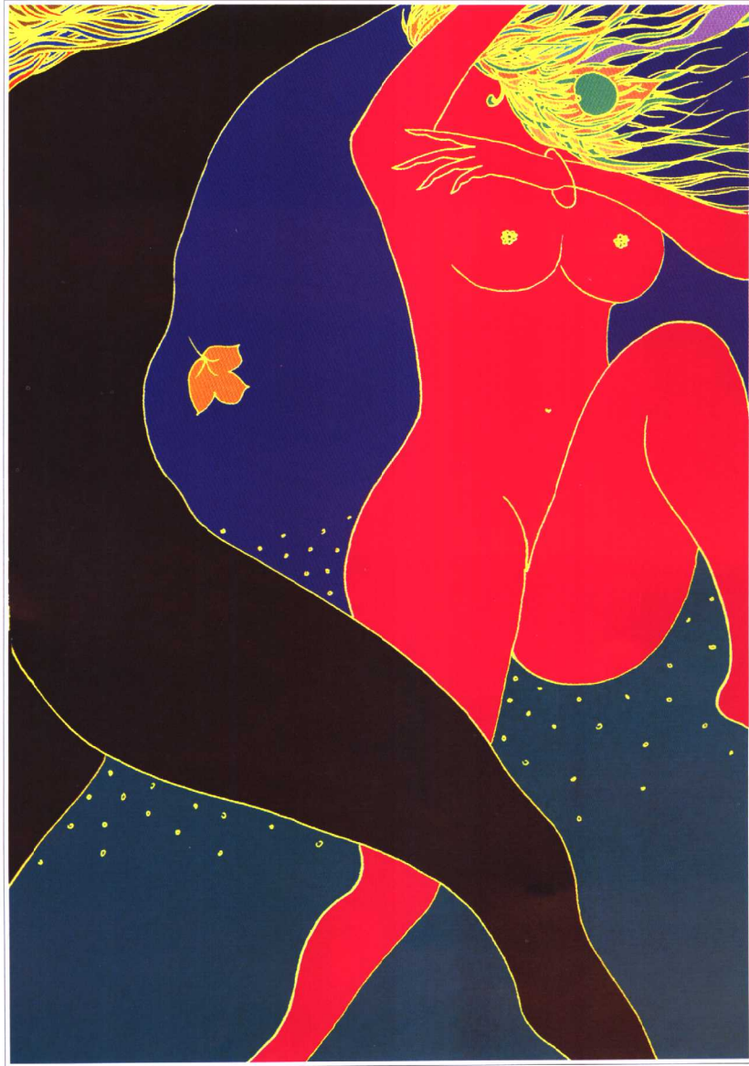
吾语 28.5cm × 21cm 2003年