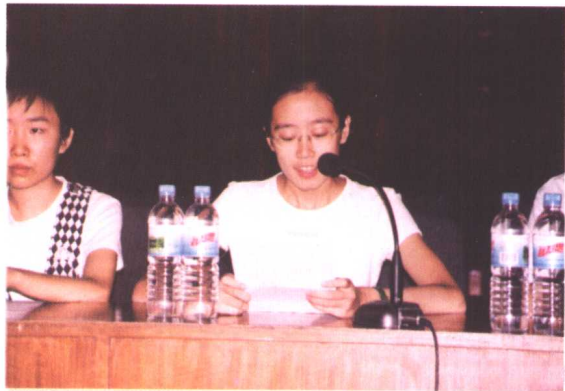
▲ 特困职工子女代表发言