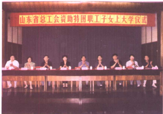
▲ 2001年8月31日，山东省总工会资助特困职工子女上大学仪式在省总工会大厦举行。山东省总工会主席齐乃贵（中）、省总工会副主席陈先宏（左三）、省总工会纪检组组长王绍钟（右二）及省有关厅（委）领导参加了仪式