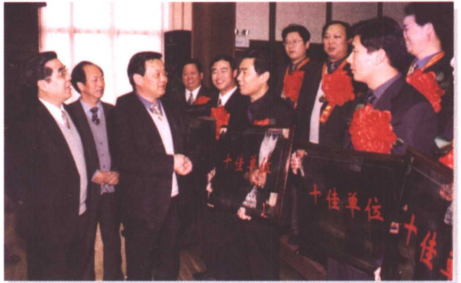
▶ 省委常委、省直工委书记朱正昌(左三),省总工会主席齐乃贵(左一),省委宣传部副部长、省精神文明办主任李凤梧(左二),与职业道德建设“双十佳”代表亲切交谈