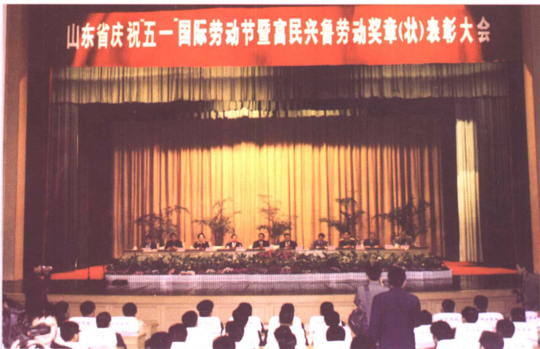
▲ 2001年4月29日,山东省庆祝“五一”国际劳动节暨富民兴鲁劳动奖章(状)表彰大会在济南南郊宾馆召开,中共中央政治局委员、山东省委书记吴官正(左五),省委副书记、省长李春亭(右五),省人大常委会主任赵志浩(左四),省委副书记陈建国(右四),省委常委、省纪委书记赵春兰(左三),省委常委、省直工委书记朱正昌(左二),省委常委、政协副主席崔惟琳(右二),省军区政委赵承凤(右三),省总工会主席齐乃贵(左一),省总工会副主席张召盈(右一)在主席台就座