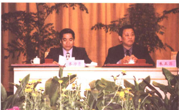
▲ 山东省总工会主席齐乃贵(左)主持会议