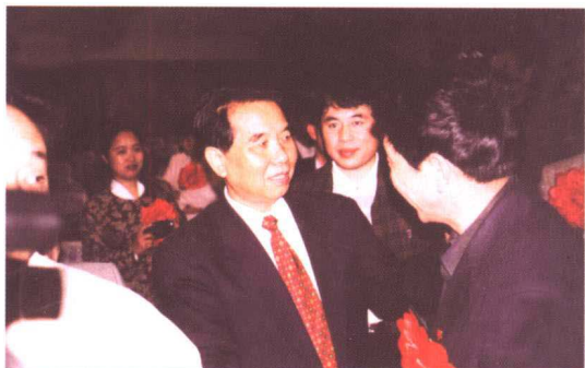
▲ 中共中央政治局委员、山东省委书记吴官正与劳动模范亲切交谈