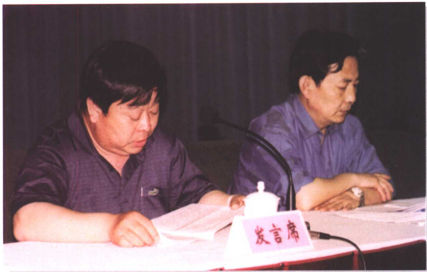
◀ 淄博市总工会代表在全省工会帮扶困难职工群体工作会议上介绍经验