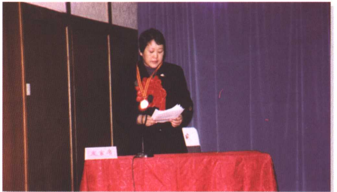
▶ 职业道德建设“双十佳”代表发言