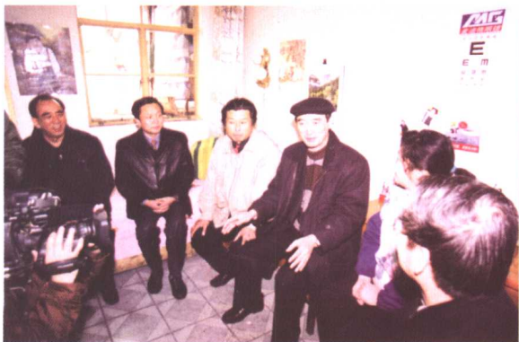
◀ 2001年元旦、春节期间,全国总工会副主席徐锡澄(左一)在省总工会主席齐乃贵(左二)陪同下到济南困难企业“送温暖”