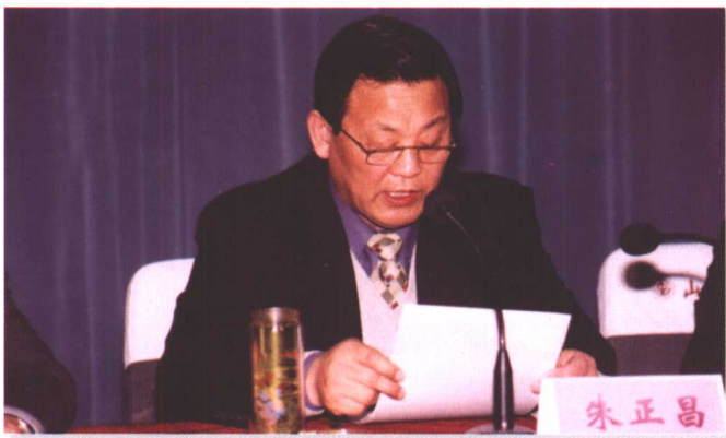
◀ 省委常委、省直工委书记朱正昌在会上讲话