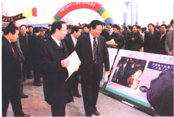
▲ 2001年11月24日，省暨济南市《工会法》宣传活动日在济南泉城广场举行。省人大常委会副主任何宗贵、山东省副省长林廷生、省政协副主席朱铭在省总工会主席齐乃贵等省总领导的陪同下参加了《工会法》宣传活动