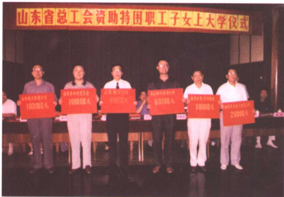
▲ 在山东省总工会资助特困职工子女上大学仪式上，全省各行业积极为特困职工子女献爱心