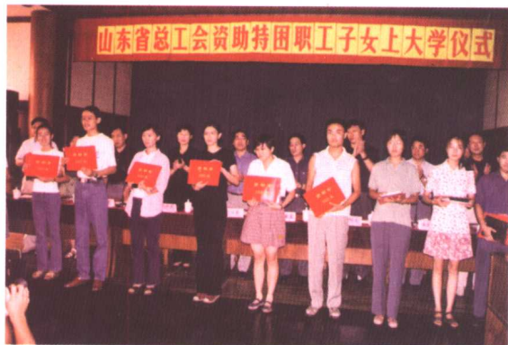
▲ 特困职工子女接受资助金