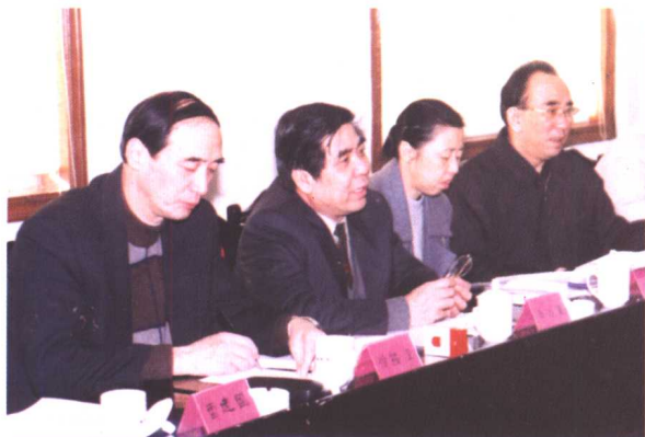
◀ 2001年1月12日,全国总工会副主席徐锡澄(左一),省总工会主席齐乃贵(左二)听取济南市总工会对困难企业和特困职工“送温暖”工作情况汇报。济南市总工会主席朱金河(右一)及有关部门负责人参加会议并汇报了情况