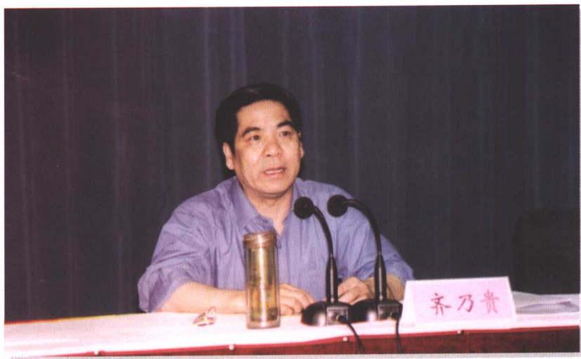
▶ 省总工会主席齐乃贵在全省工会帮扶困难职工群体工作会议上讲话