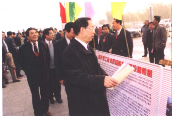
▲ 省人大常委会副主任何宗贵、山东省副省长林廷生、省政协副主席朱铭在省总工会主席齐乃贵等省总领导的陪同下认真观看并询问《工会法》宣传学习情况