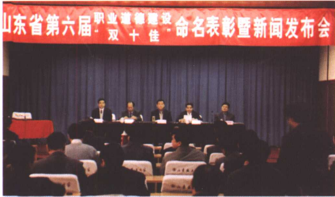
◀ 2001年11月30日,山东省第六届职业道德建设“双十佳”命名表彰暨新闻发布会召开。省委常委、省直工委书记朱正昌(左三),省总工会主席齐乃贵(右二),省委宣传部副部长、省精神文明办主任李凤梧(左二),省经贸委副主任张国敏(右一)参加了会议