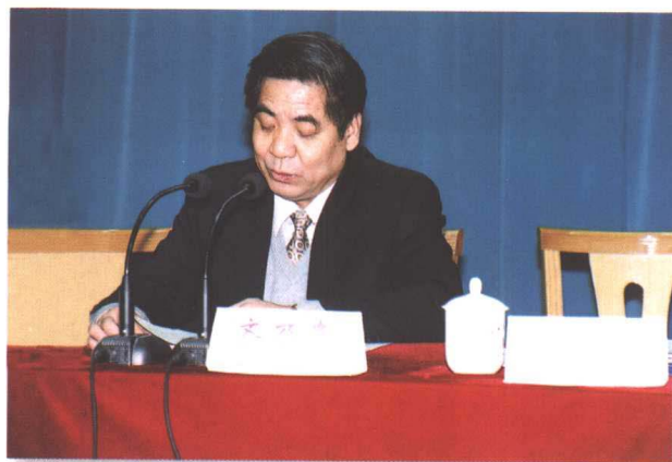
▲ 山东省总工会主席齐乃贵向大会作工作报告