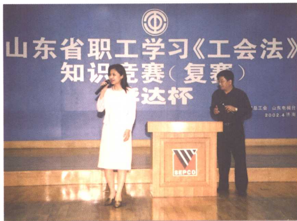
▲ 2002年4月，山东省职工学习《工会法》知识竞赛在济南举行