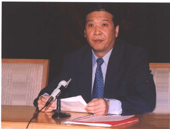
▲ 山东省委副书记姜大明出席大会并讲话