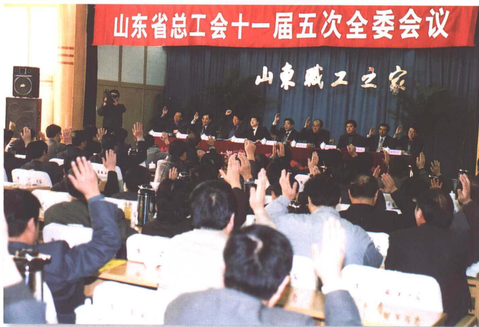
▲ 2002年1月17至18日，山东省总工会十一届五次全委会议在济南召开