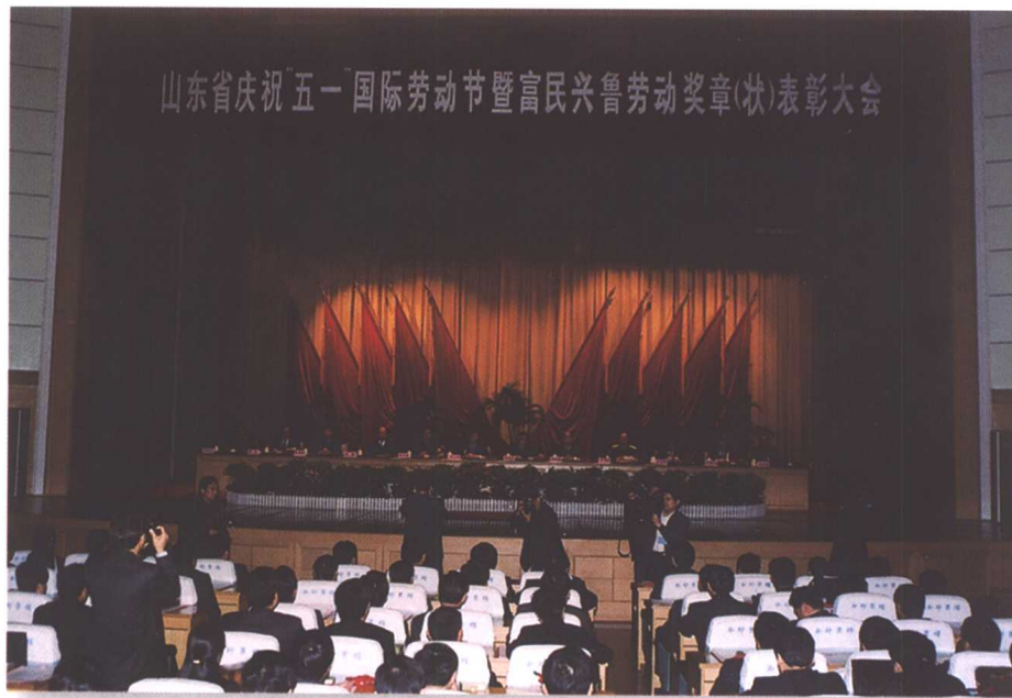
▲ 2002年4月28日,山东省庆祝“五一”国际劳动节暨富民兴鲁劳动奖章(状)表彰大会在济南召开