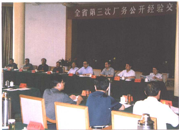
▲ 2002年6月19日，全省第三次厂务公开经验交流会议在济南召开