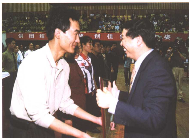
▲ 山东省委副书记姜大明为获奖代表队颁奖