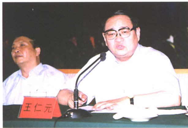
▲ 山东省委副书记姜大明(左)、副省长王仁元出席会议并讲话