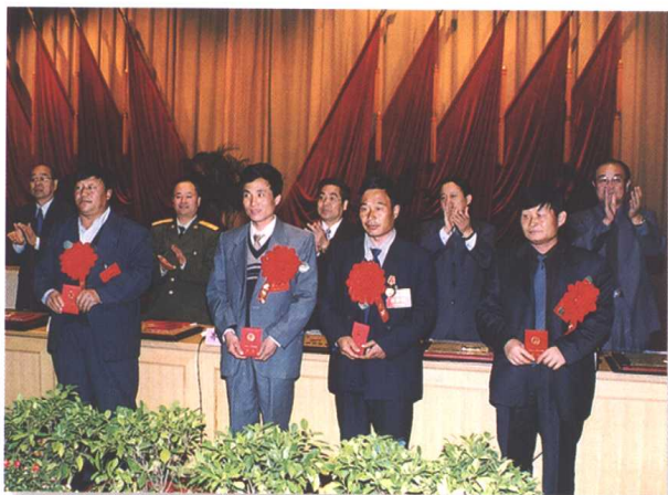
▲ 省领导为获奖个人颁发证书