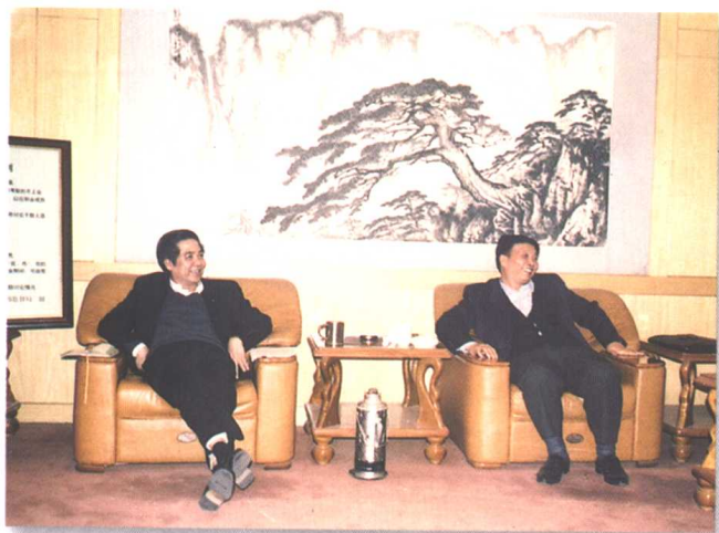
▲2002年4月5日，山东省委副书记姜大明(右)到省总工会视察，听取工作汇报