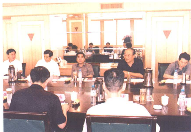
▲ 省总工会领导与华东六省一市工会主席研讨会代表交流工作和思想