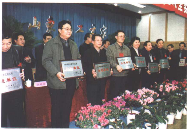
▲ 领导同志向2002年度全省工会工作先进单位颁奖