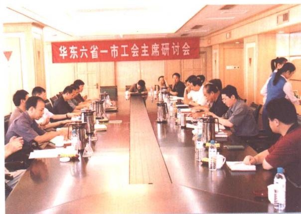
▲ 2002年7月15日至19日,华东六省一市工会主席研讨会在济南召开