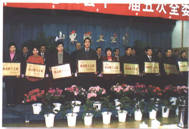
▲ 领导同志向全省模范职工之家颁奖