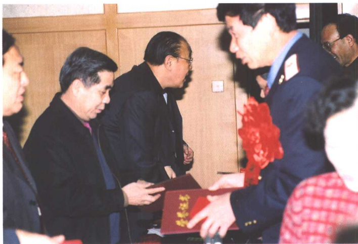
▲ 省及省总工会领导为获奖单位和个人颁发荣誉证书