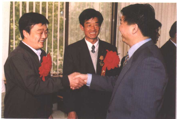
◀ 2002年4月26日, 山东省委副书记姜大明(右)在济南接见进京劳模代表