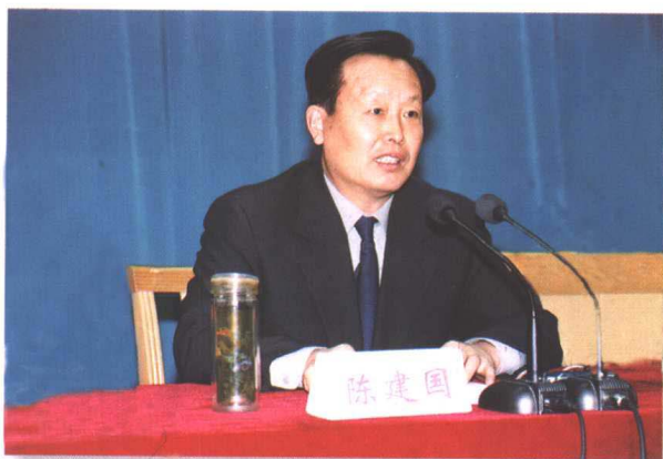
▲ 山东省委副书记陈建国出席会议并讲话