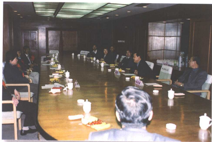
▶ 山东省委、省总工会领导与进京劳模代表座谈