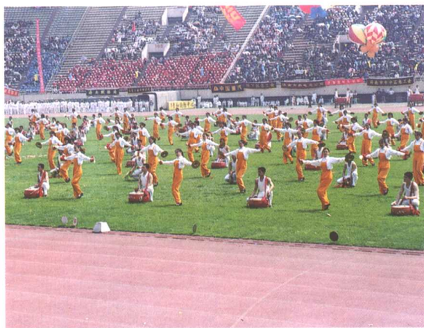
▲ 开幕式大型艺术表演