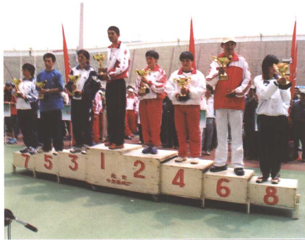
▲ 田径比赛获奖代表队在领奖台上