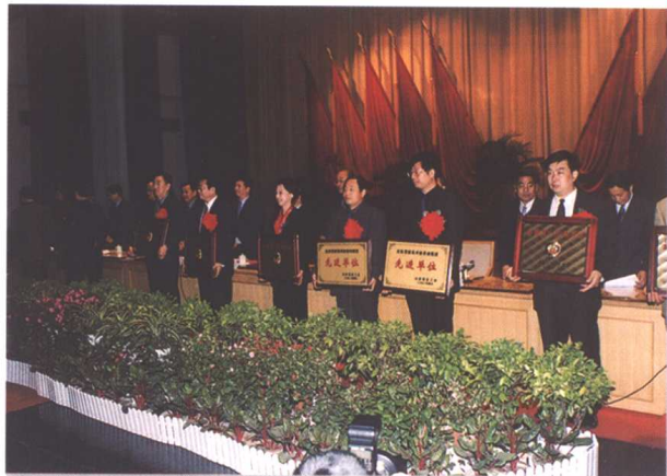
▲ 省领导为获奖单位颁发奖牌