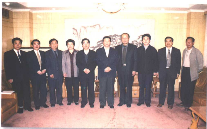
▲山东省委副书记姜大明(右五)与省总工会领导班子合影