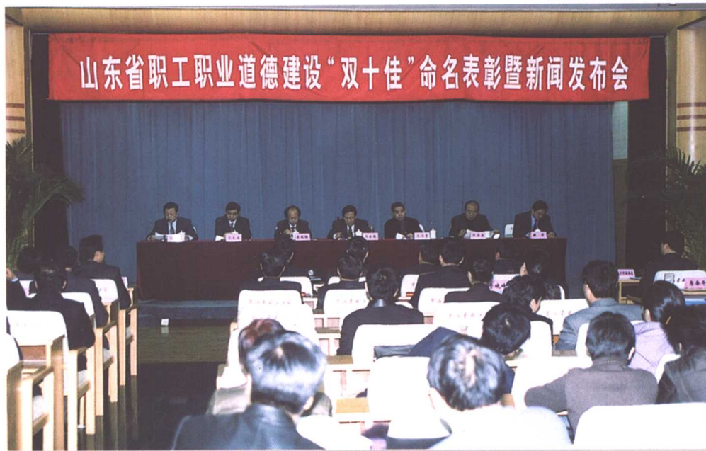
▲ 2002年12月11日，省职工职业道德建设“双十佳”命名表彰暨新闻发布会在济南召开