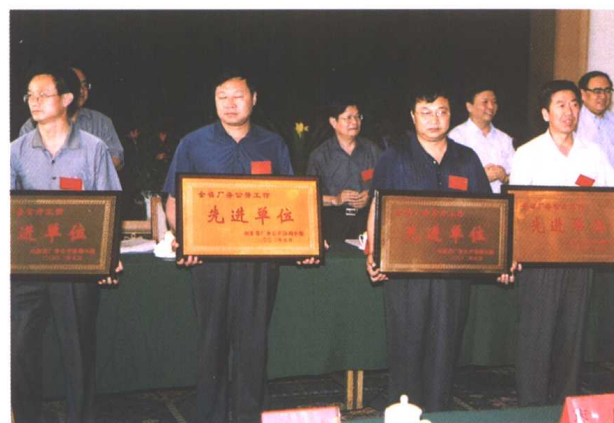
▲ 省领导为全省厂务公开工作先进单位颁奖