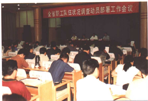
▲ 2002年8月19日,全省职工队伍状况调查动员部署工作会议在济南召开