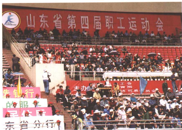
▲ 2002年5月18日，山东省第四届职工运动会开幕式在省体育中心举行