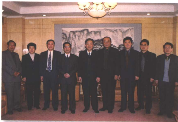
▲全国总工会副主席孙宝树(中)与省总工会领导合影