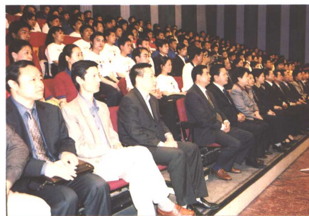
▲ 省及省总工会领导与观众观看比赛