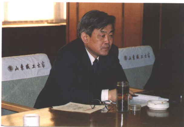
▲全国总工会副主席孙宝树听取省总工会汇报并讲话