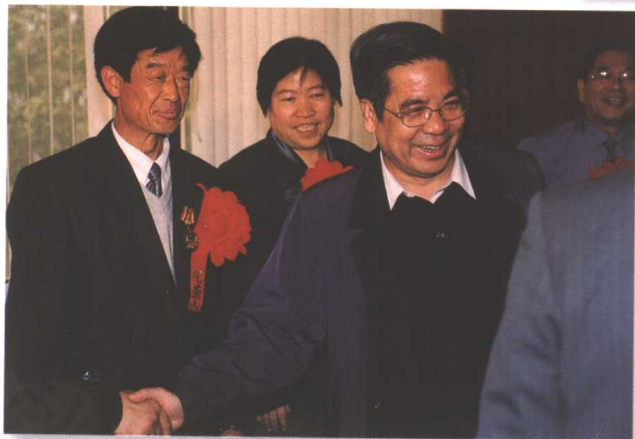
◀ 山东省总工会主席齐乃贵(左三)接见进京劳模代表