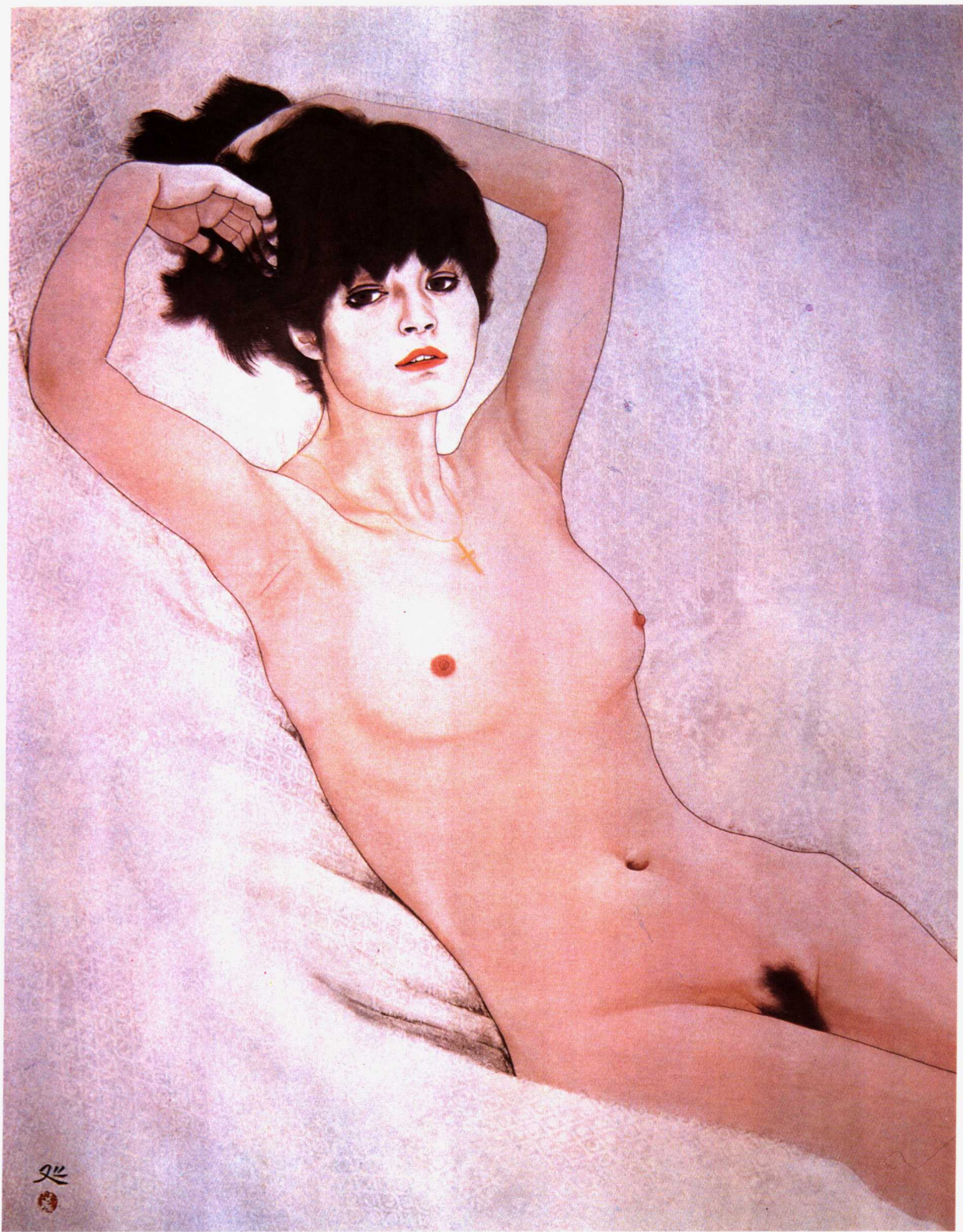
1. 裸体习作 1974年 113×86cm