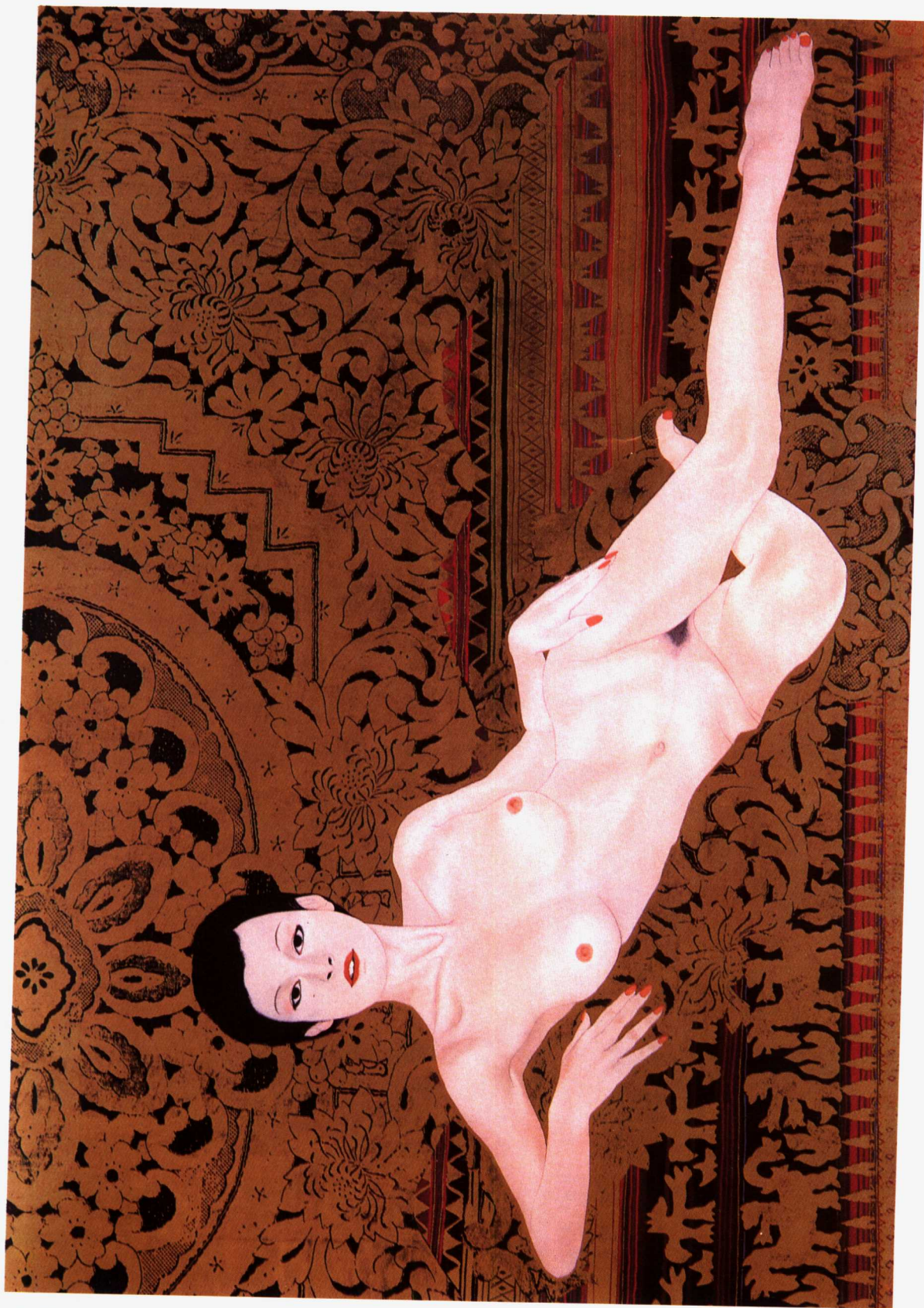
4. 裸妇习作 1976年 79×115.5cm