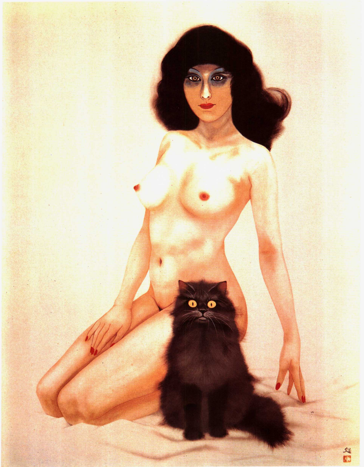
3. 波斯猫 1972年 130×97cm