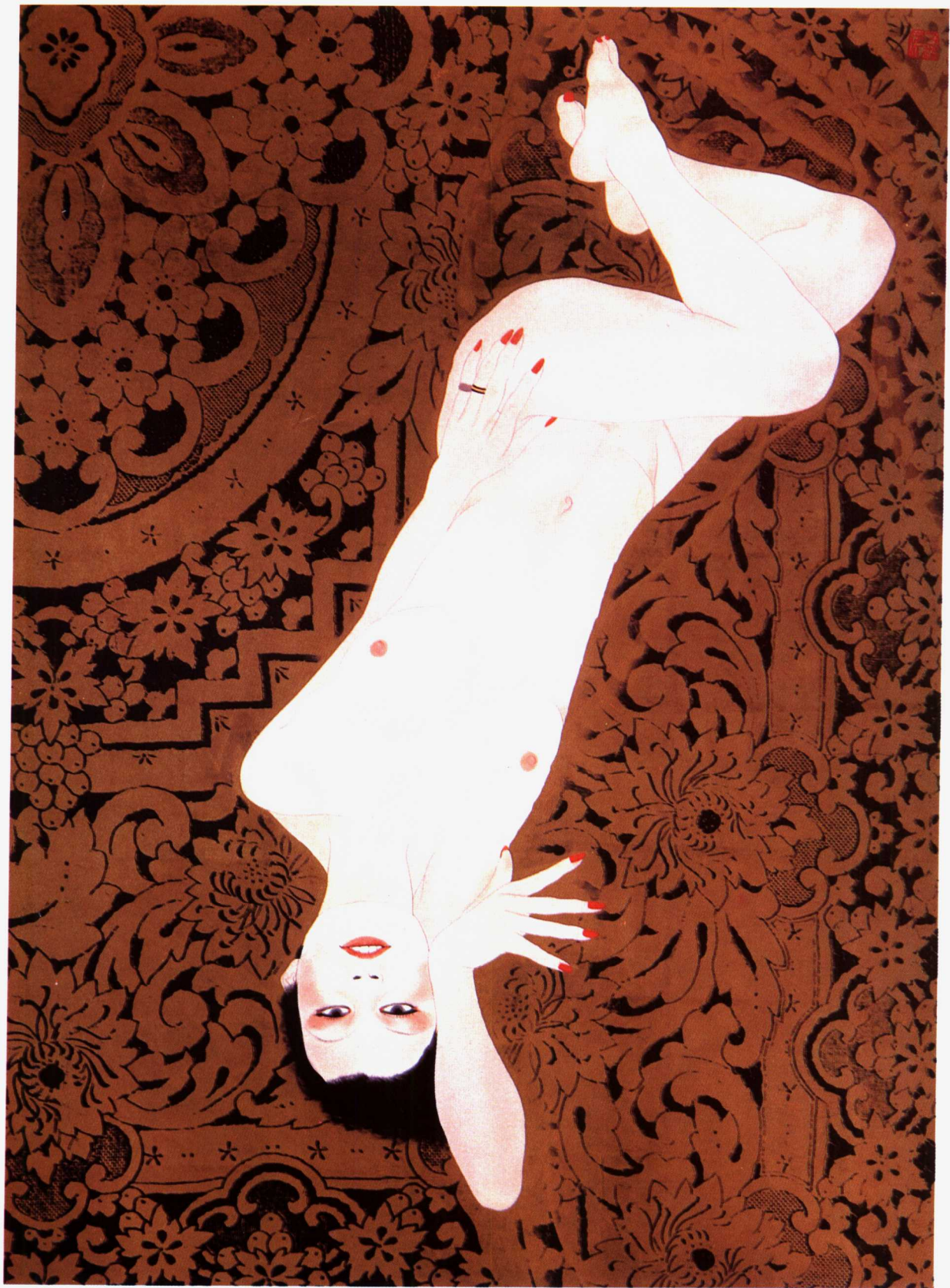
5. 裸妇习作 1976年 66.5×91.5cm