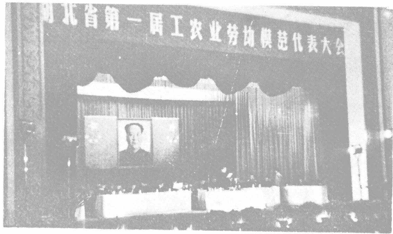
↑ 張体学省长致开幕词。