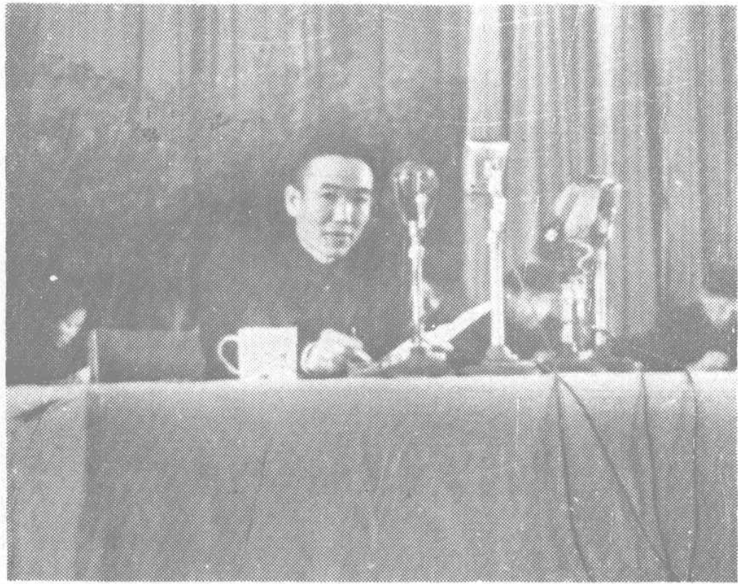
↑ 中共湖北省委书记王任重同志 在大会作总结报告。