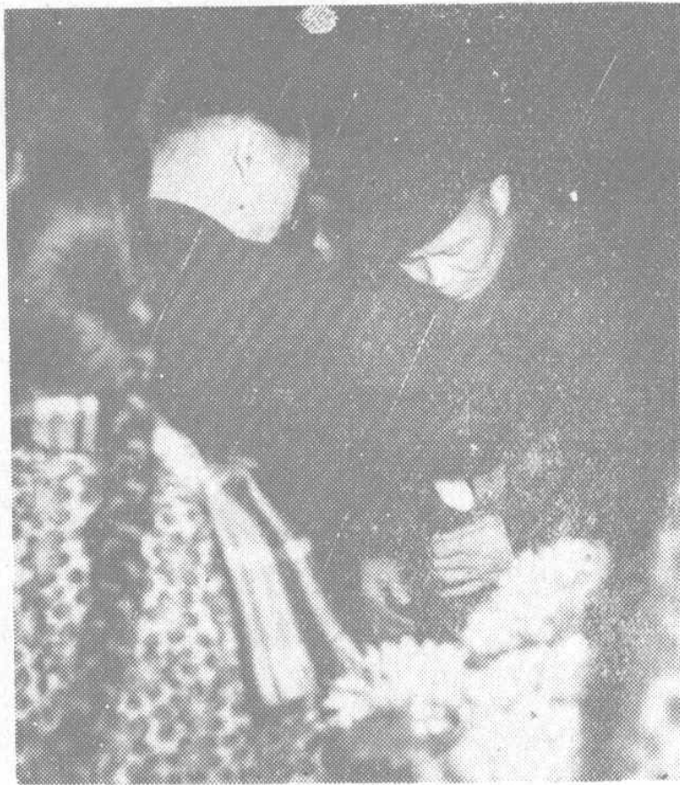
← 张体学省长为劳动模范挂光荣花。