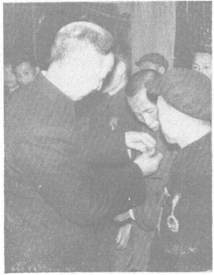
← 李明灏副省长为劳动模范挂光荣花。