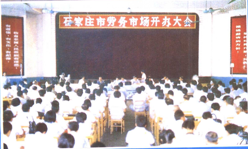
⑥ 1986年6月30日，河北省第一个劳务市场——石家庄市劳务市场正式开办