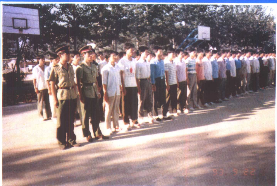
⑱ 河北职业技术学院新生进行 军训