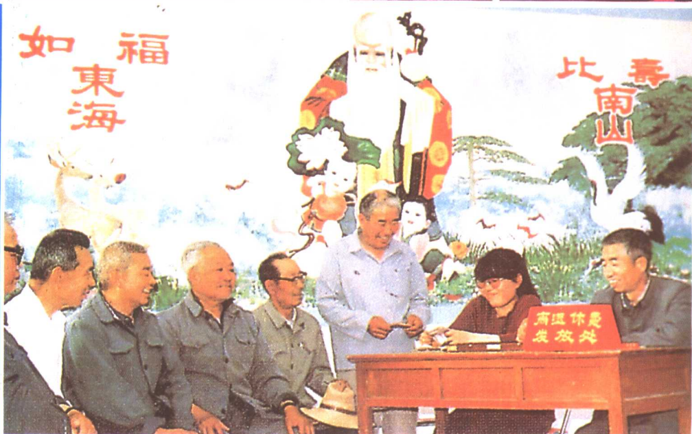
⑭ 河北省大部分县(市)实行了由社会 保险机构直接向离退休人员发放离休 退休费的办法,受到社会各界欢迎