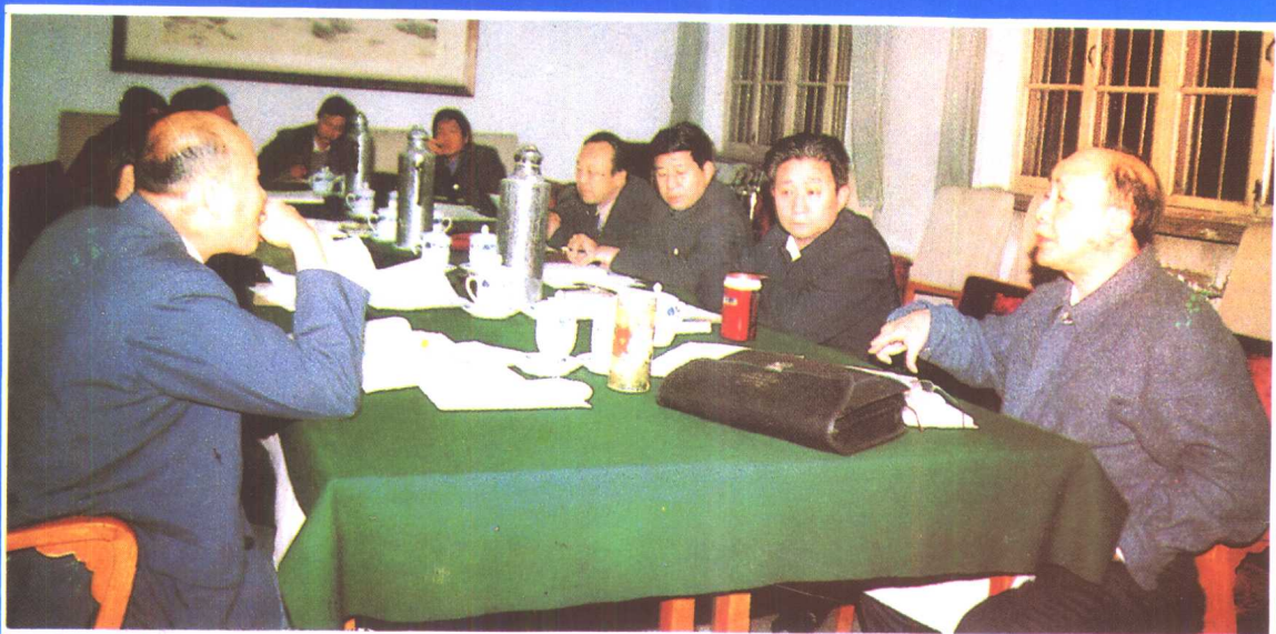
⑬ 副省长宋叔华(右一)同 省政府有关部门的领导研究 全省社会保险改革大计