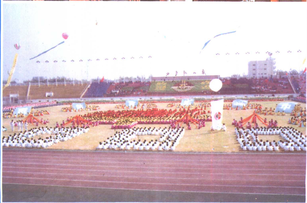
⑮ 1983年全省第二届技工学校运动 会在唐山市举行