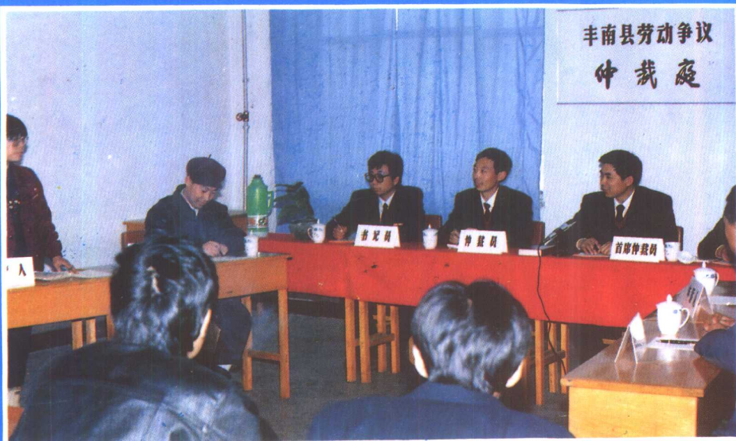
④ 丰南县劳动争议仲裁庭开庭