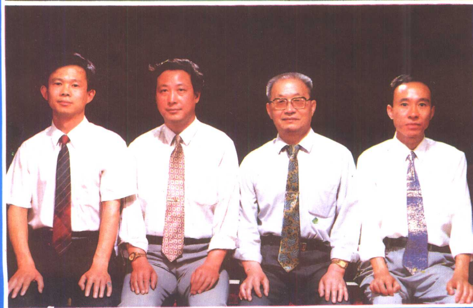
④ 《河北省志·劳动志》主编、副主编合影