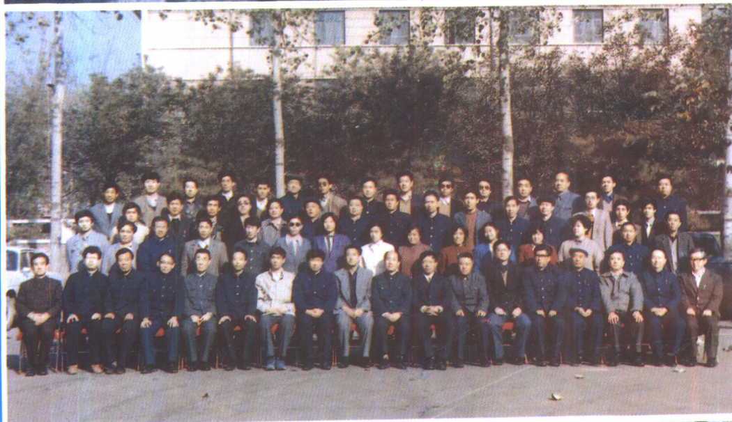
⑤ 1988年11月，全国首届职工待业保险工作座谈会在石家庄市召开