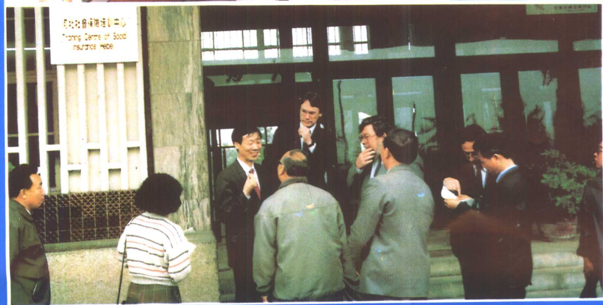
⑫ 河北省社会保险局、河北职业技术学院师范学院联合建立的社会保险培训中心