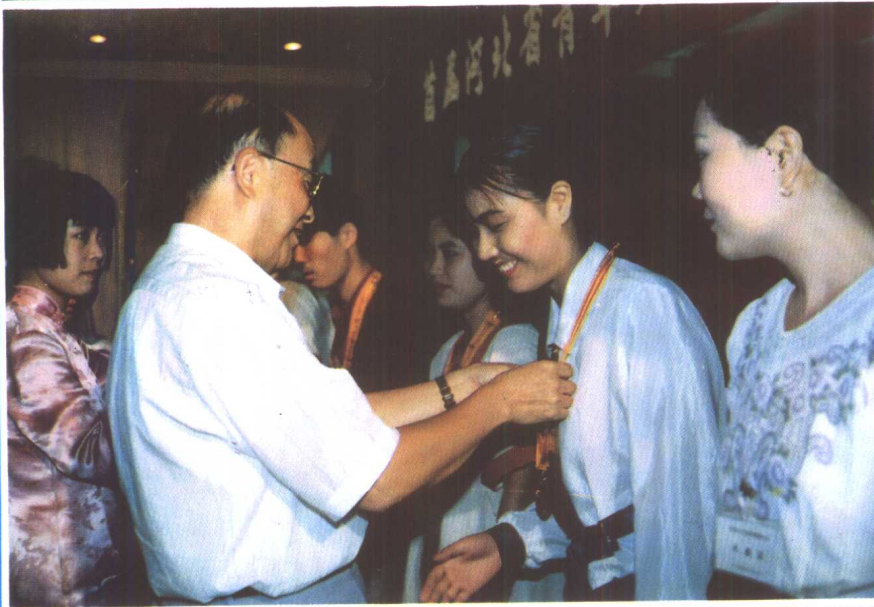
⑪ 副省长宋叔华为河北省首届青年 奥林匹克技能竞赛冠军颁发奖章