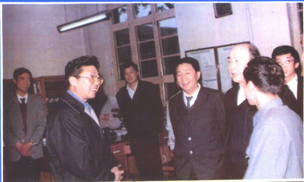
① 1992年，国家劳动部部长阮崇武 (左二)到河北省视察工作