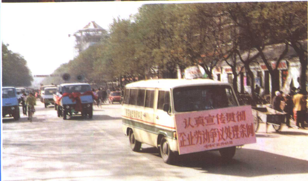
② 大力宣传企业劳动争议处理条例