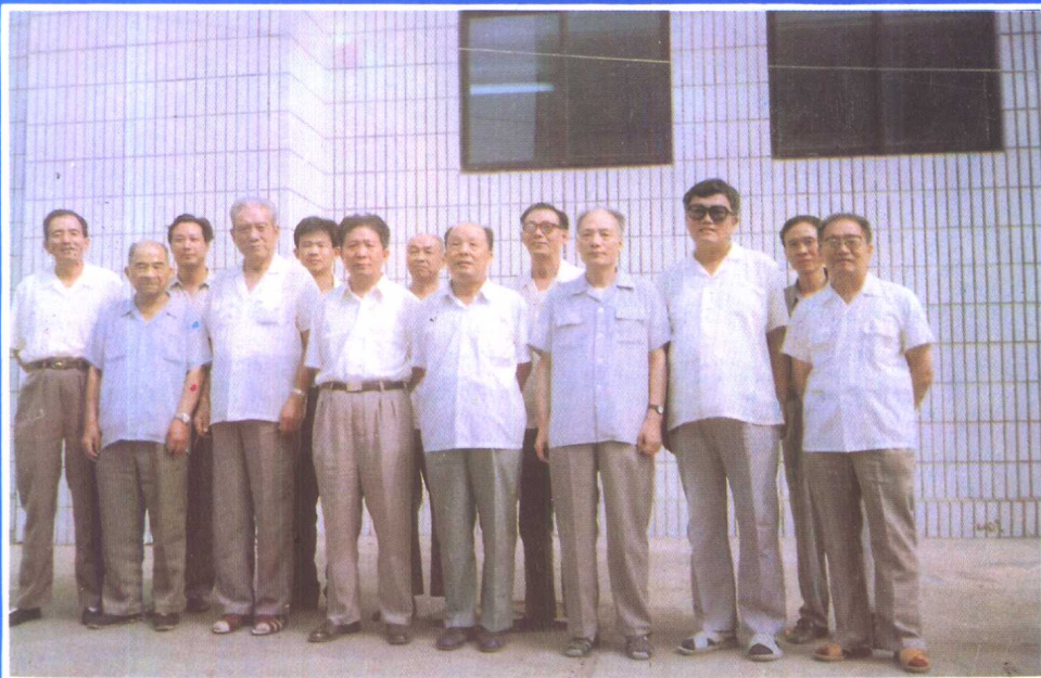
② 《河北省志·劳动志》评审委员会全体会员同该志编著者合影