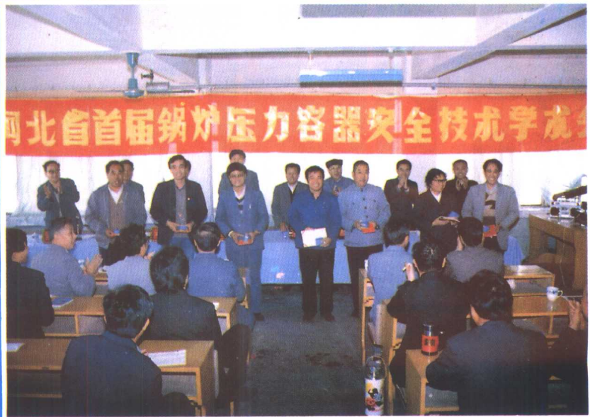
㉑ 1990 年 10 月 28 日, 河北省首届锅炉压力容器安全技术学术会议在邯郸市召开。会议为优秀论文奖获得者颁奖