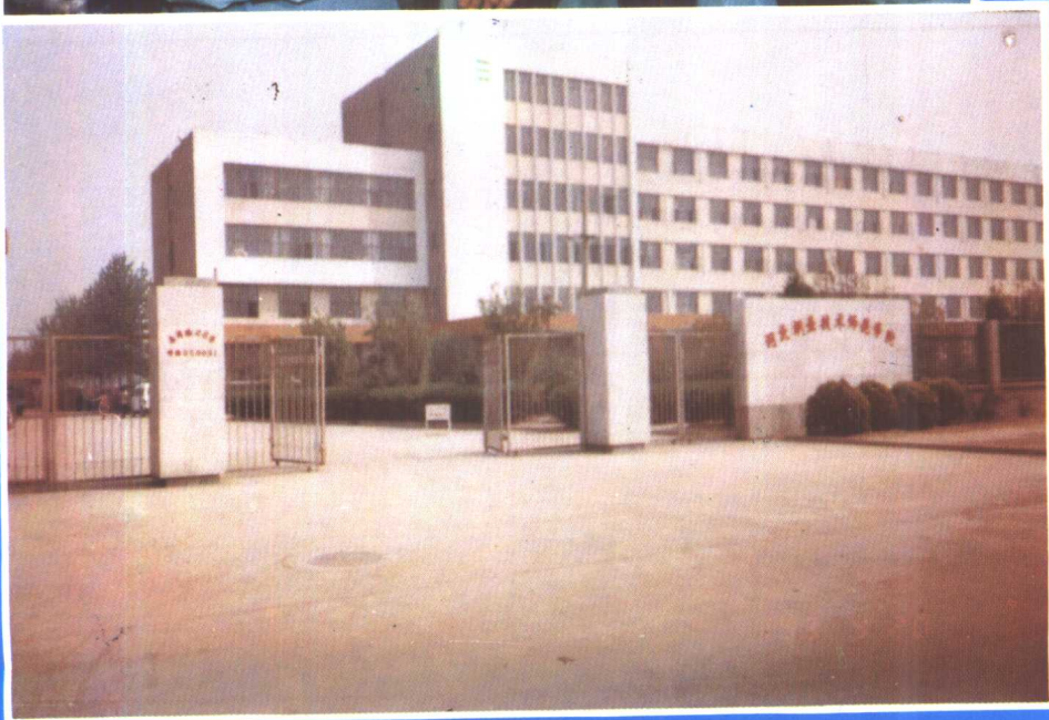
⑫ 河北职业技术学院教学楼