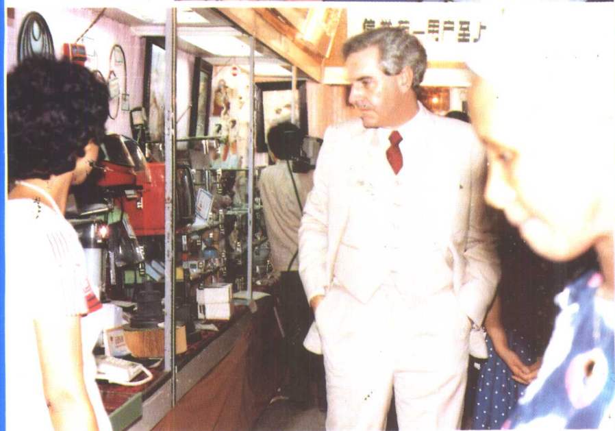
⑪ 1985年9月北京全国展销会期间，外国朋友到河北展厅参观，并对河北产品、成果表示赞赏