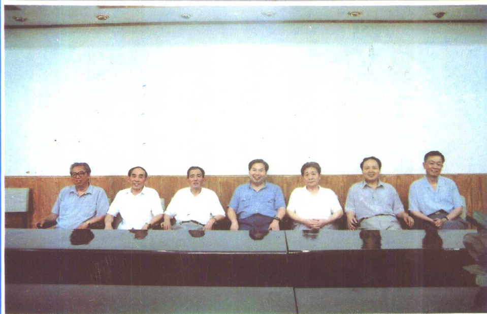
③ 《河北省志·劳动志》编纂委员会主任、副主任合影