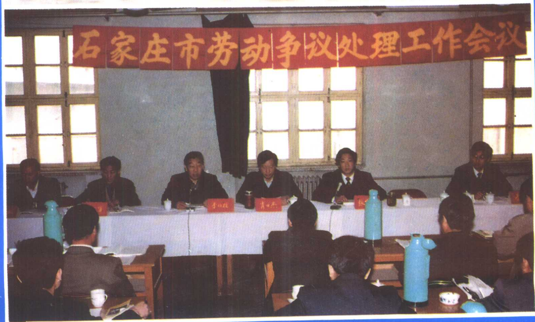
③ 石家庄市劳动局召开劳动争议处 理工作会议