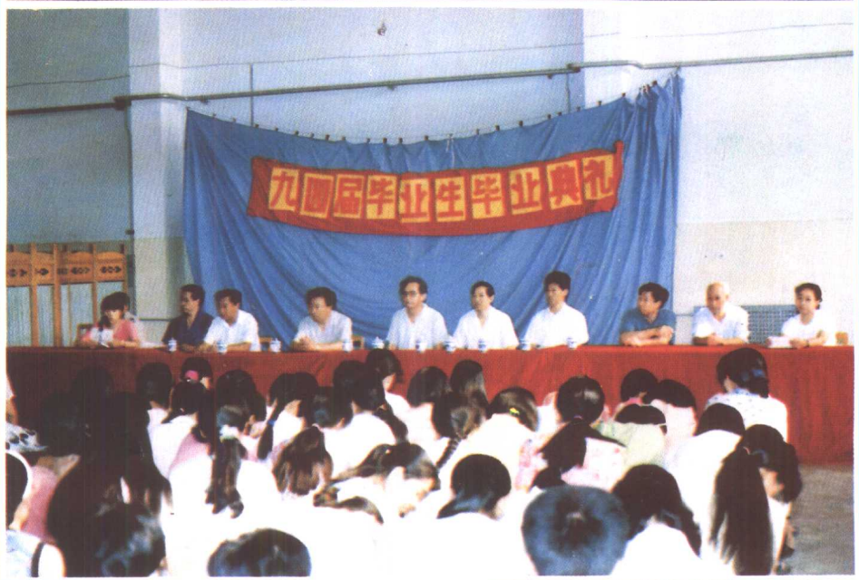
⑳ 河北职业技术学院 1994 年 毕业生毕业典礼