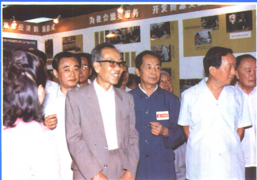
⑩ 1985年9月北京全国展销会期间，国务院副总理田纪云(右二)到河北展厅参观指导