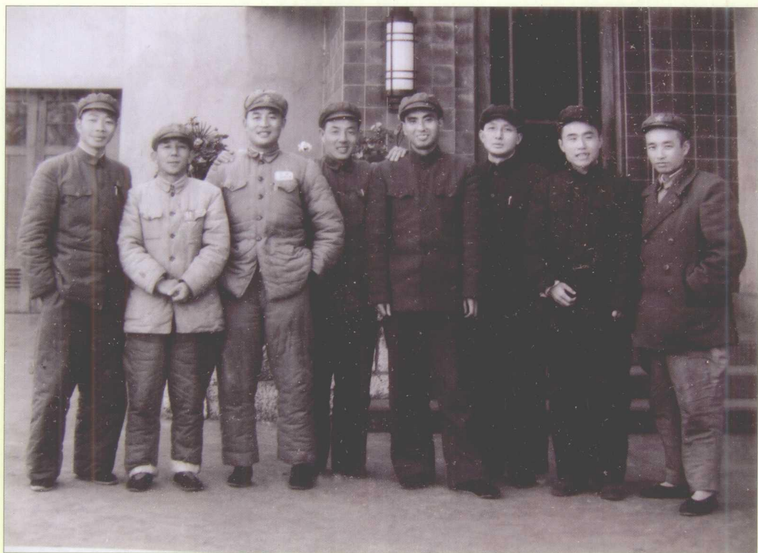
貴州解放初期，中共貴州省書記蘇振華（左四），副書記徐運北（右二）、曾固（即陳曾固，右三），常務委員楊勇（右四）、趙健民（左一）等合影