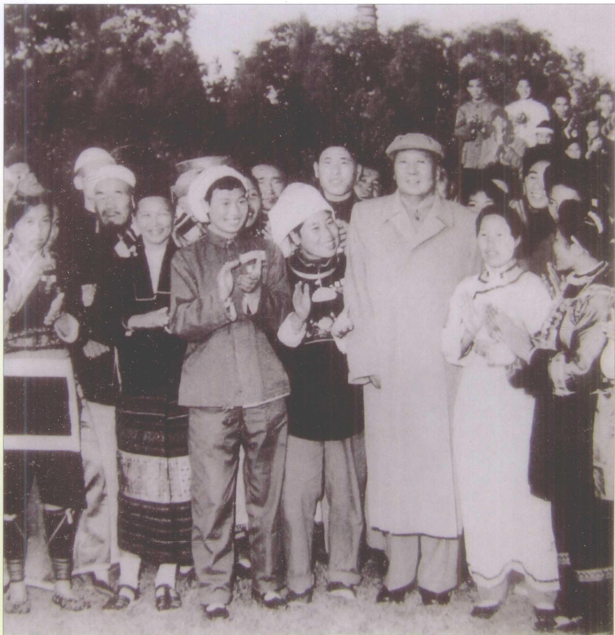
1959年10月，毛泽东在中南海接见贵州等地少数民族代表