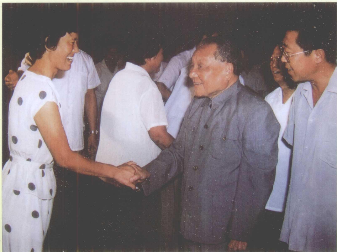
1987年7月，邓小平在北戴河接见贵州省知识分子代表李桂莲