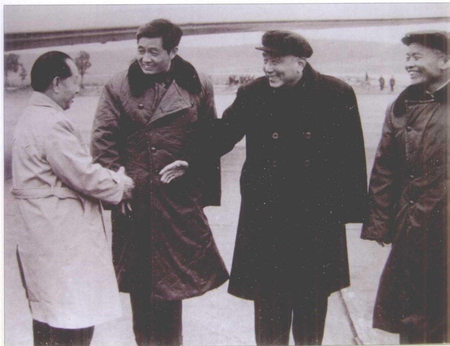
1986年2月，胡耀邦与贵州省领导同志在贵阳机场