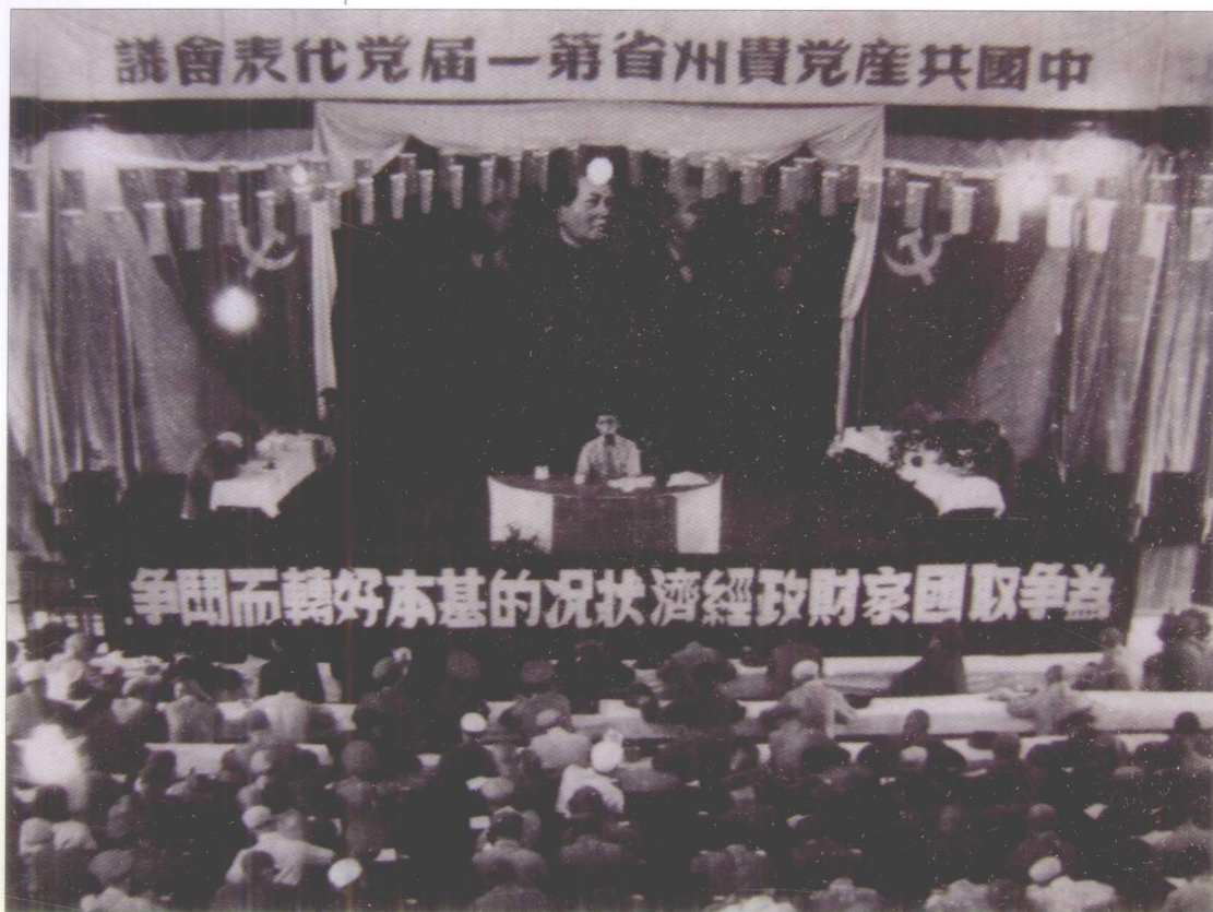
1950年8月，中國共產黨貴州省第一屆黨代表會議召開