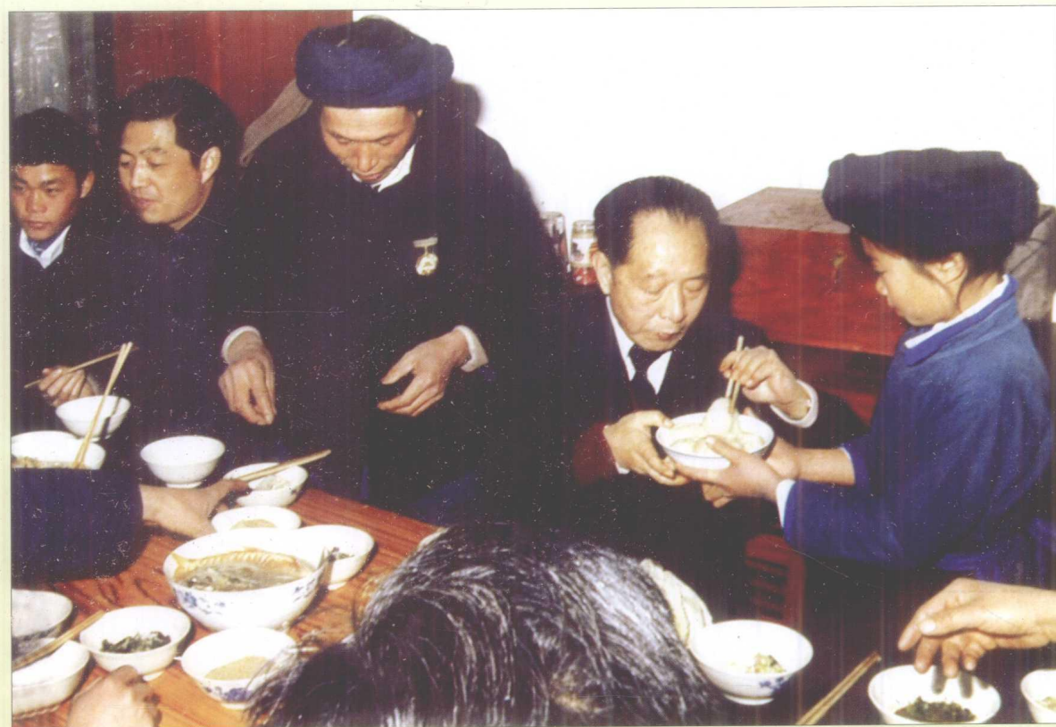
1986年除夕，胡耀邦在黔西南州兴义市马岭镇乌拉村布依族农民家中吃年夜饭