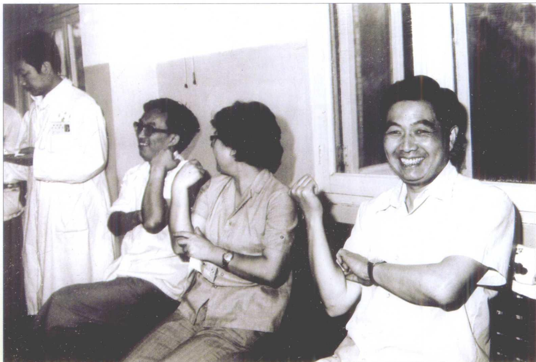
1987年夏，贵州省委书记胡锦涛在省血站献血