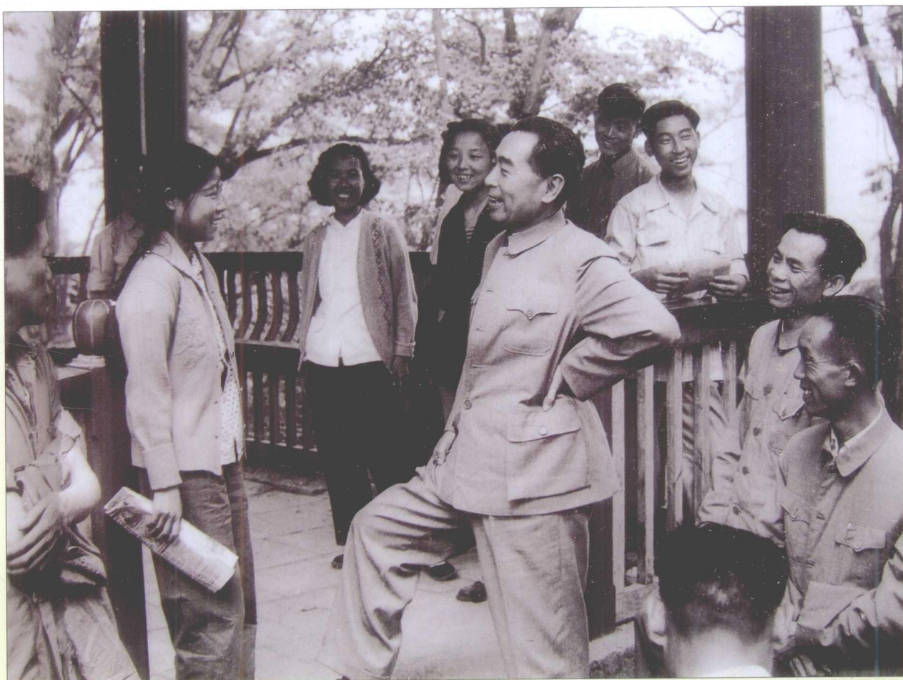
1960年5月，周恩来在贵阳市花溪与工人交谈