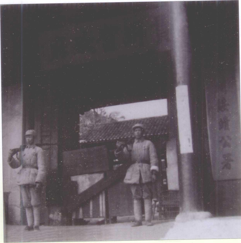
中国人民解放军接管 国民党贵州省政府