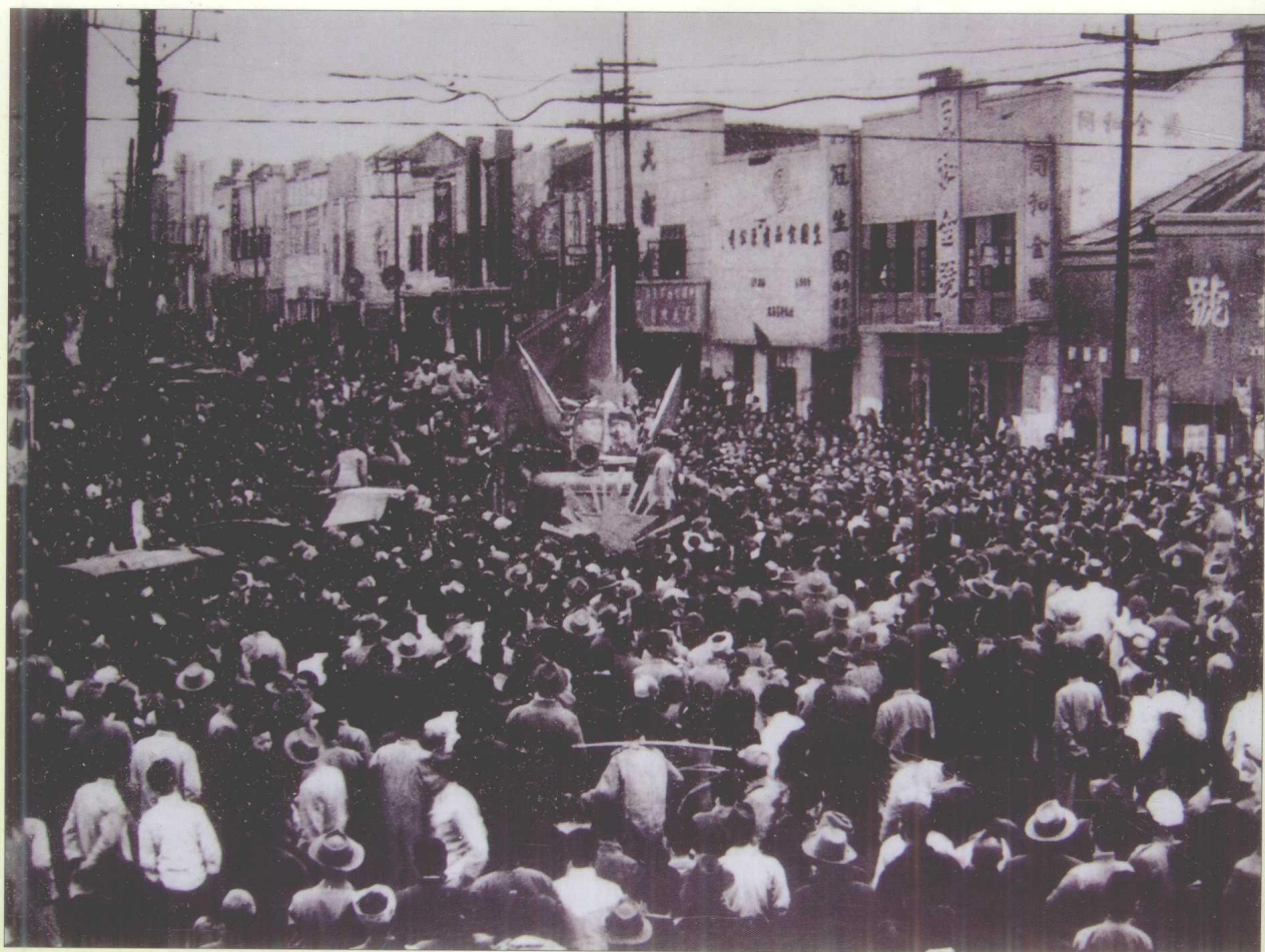
1949年11月15日贵阳解放，人民群众欢迎人民解放军入城