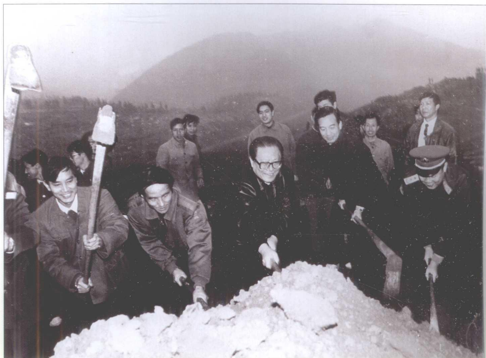
1991年12月， 江泽民在遵义县石板乡考察，参加坡改梯劳动