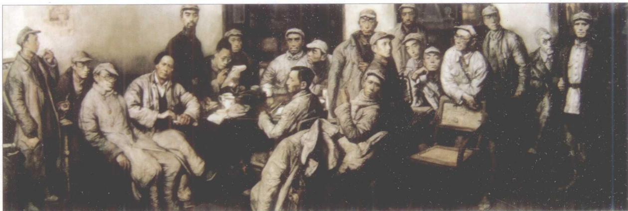
油画《遵义会议》(中国历史博物馆藏)