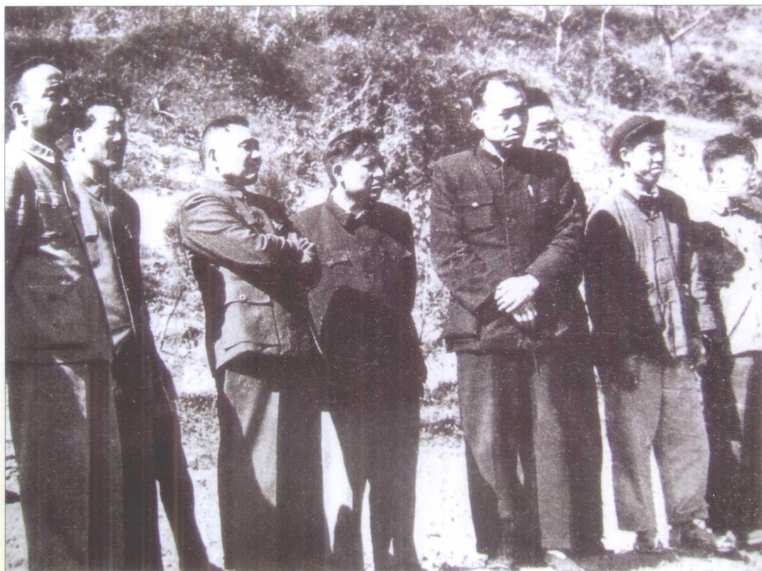
1958年11月，邓小平在贵州省遵义地区考察