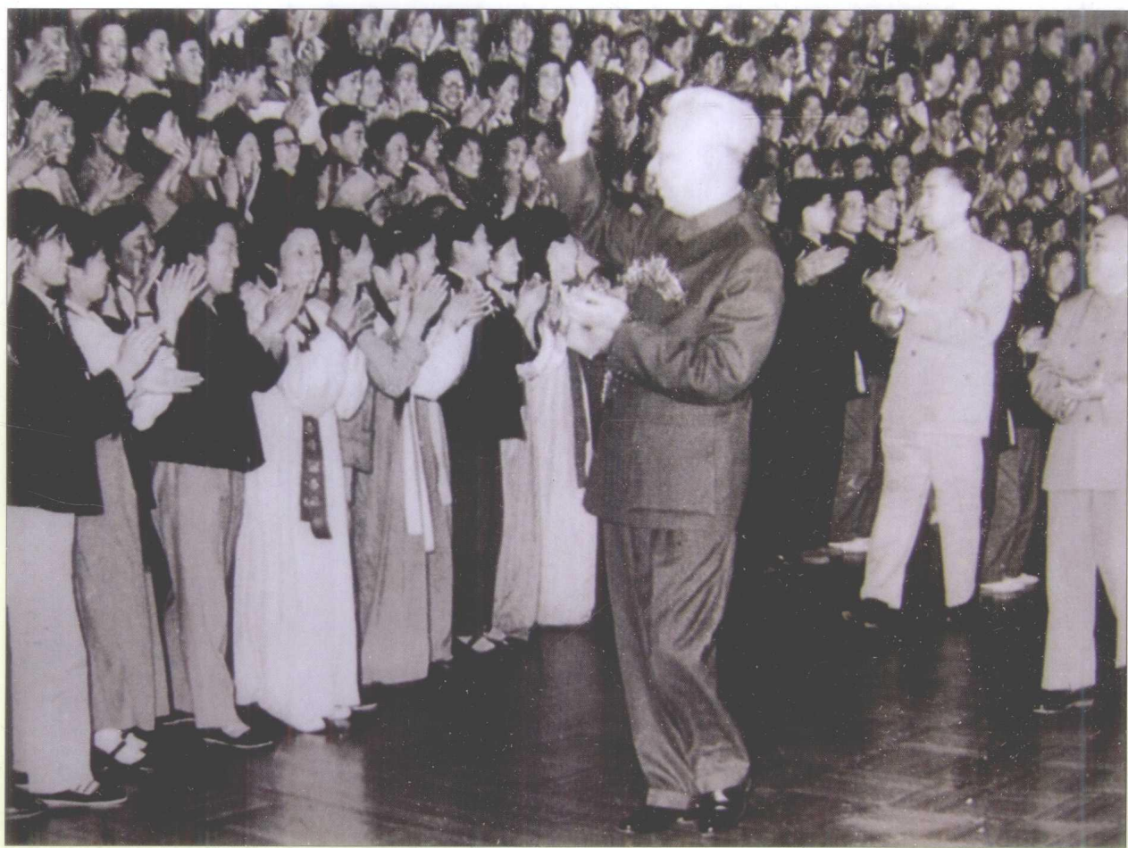
1964年5月，刘少奇、朱德、周恩来接见贵州省等地少数民族参观团