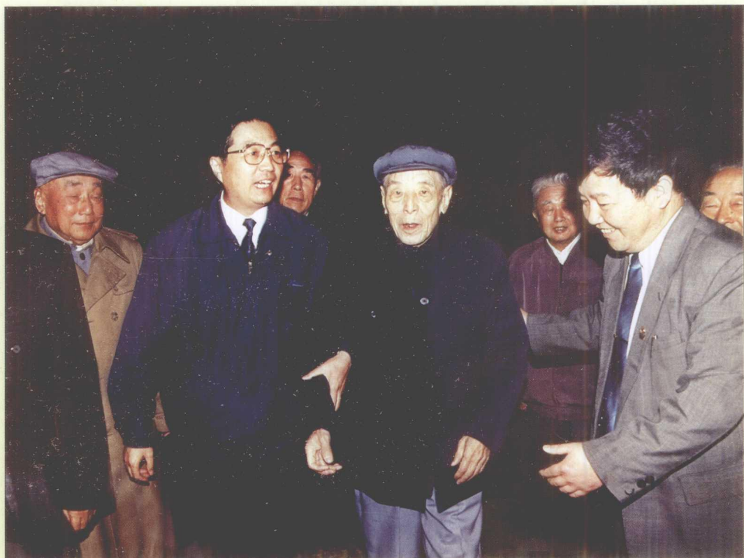
1996年，中共中央政治局常委、书记处书记胡锦涛在贵州考察。图为胡锦涛与离休老同志在一起