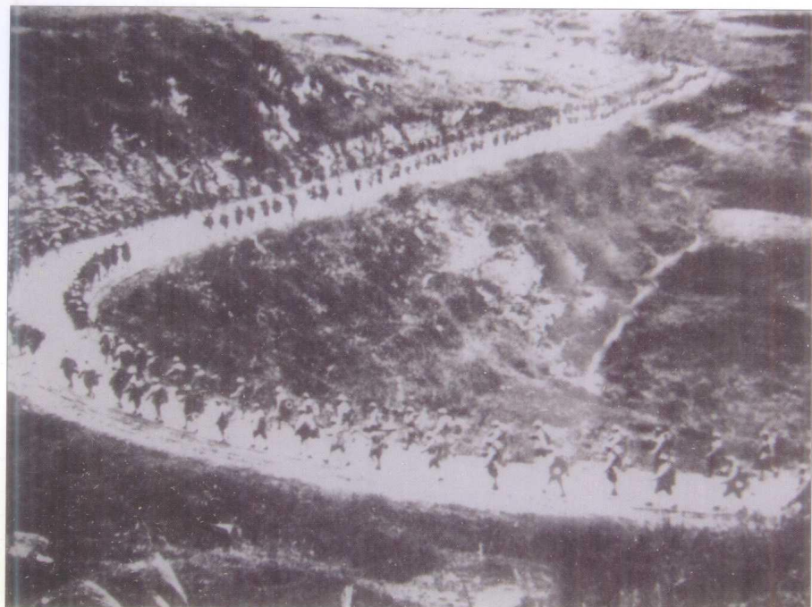
中国人民解 放军进军大西南