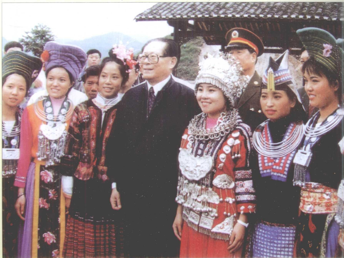
1996年10月，江泽民与贵州少数民族群众在一起