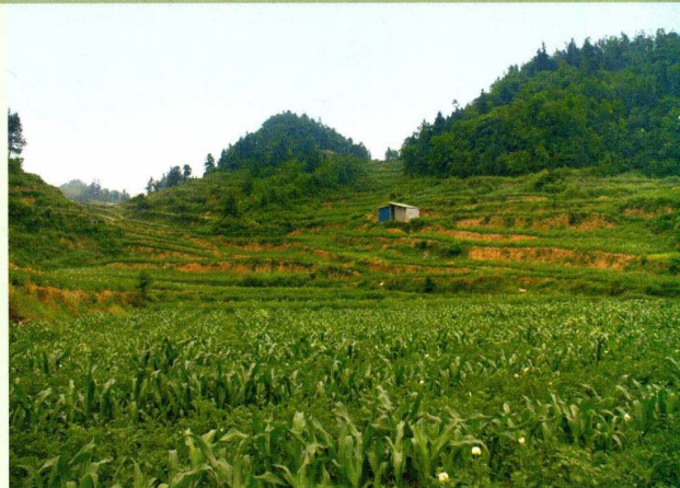
洪关马铃薯套玉米基地