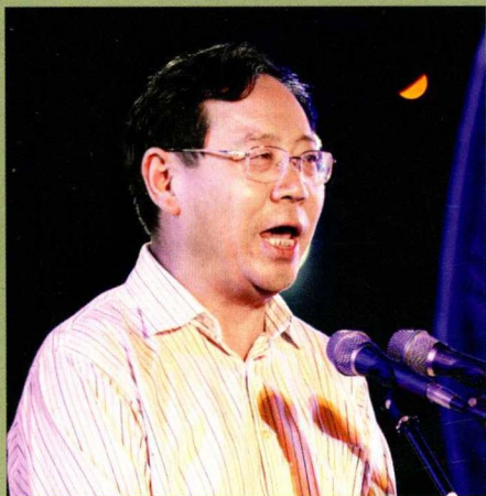
贵州省文化厅厅长徐圻宣布开幕