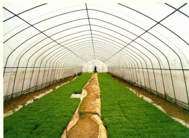
水稻机插秧集中育苗

遵义县 地处黔北腹地，属典型的传统农业大县。全县耕地面积98万亩，气候温和，属亚热带季风湿润气候，冬无严寒，夏无酷暑，雨量充沛且雨热同季，自然气候条件适宜水稻、玉米、马铃薯等粮食作物生长。素有“黔北粮仓”之称。