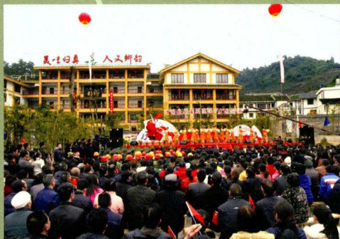
中国歌剧舞剧院在乡韵演出