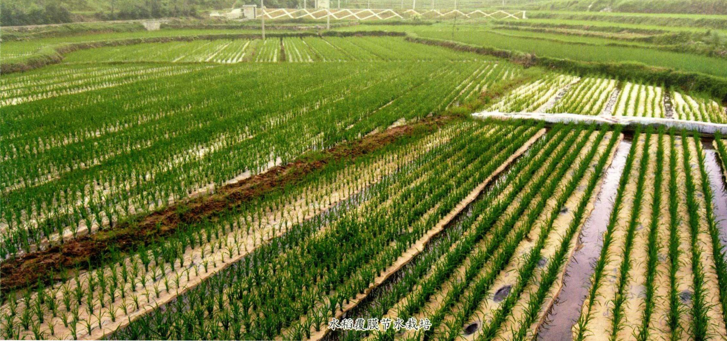
水稻覆膜节水栽培

2005年，遵义县把“三农”工作作为经济社会发展的战略重点，深入贯彻落实多给予农民补贴、少收取农民税费、放活农业经营体制的方针，深化农村改革；切实减轻农民负担，全县免征农业税，并对种粮农民继续实行财政直接补贴政策，提高农民种粮积极性。粮油生产实现新的跨越，粮食总产量达到6.10亿公斤，比上年增加0.45亿公斤，增长8.05%。农业人口每人平均占有粮食589公斤，比上年增加43.5公斤，增长7.4%。油菜籽播种面积49.85万亩，总产量6912.9万公斤，每亩平均单产138.7公斤。遵义县继2003年之后，第二次获得“全国粮食生产先进县”称号。被列为全国商品粮基地建设县，先后曾获“全国果菜标准化建设十强县”、“全国测土配方施肥工作先进单位”、“全国农田水利建设先进县”和“十一五”全省“三增一减”一等奖。2008年来农业农村工作综合目标考核均获全市一等奖。2011年农民人均纯收入6514元，农业总产值50.5亿元，粮食产量50.99万吨，第三次获得“全国粮食生产先进县”称号。