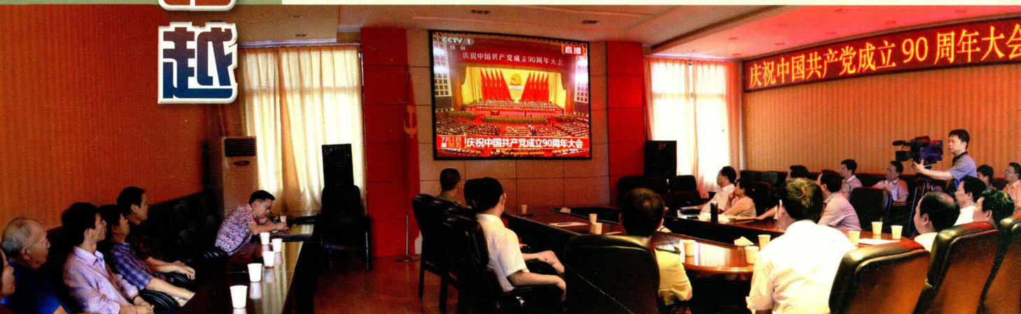
观看中国共产党纪念建党90周年庆典