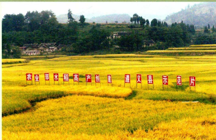
农业部水稻高产创建项目