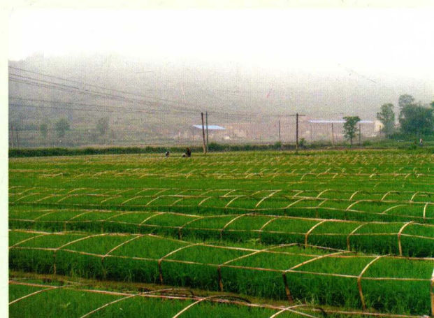
水稻生态早育秧集中育苗示范