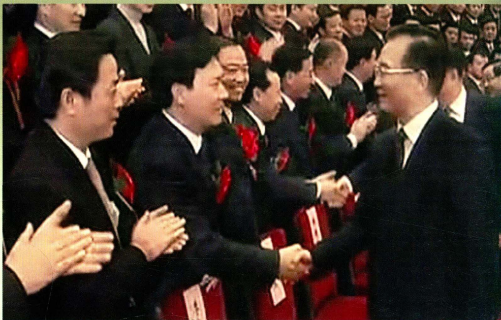
2011年12月26日,国务院召开全国粮食生产表彰奖励大会,总理温家宝(右)接见与会代表。市委常委、县委书记穆嵘坤(左二)参加大会。