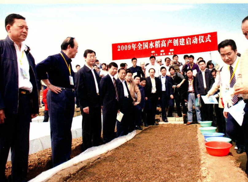
全国水稻高产创建启动仪式在苟江镇举行