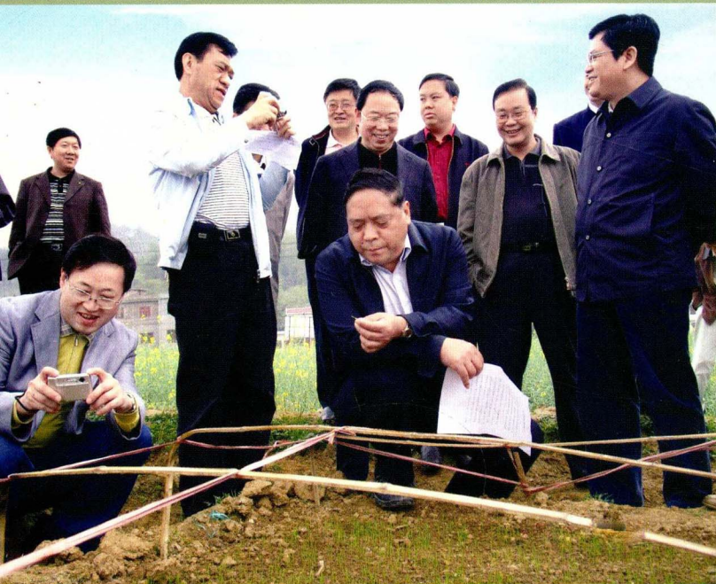
副省长禄智明（中）在遵义县调研粮食生产