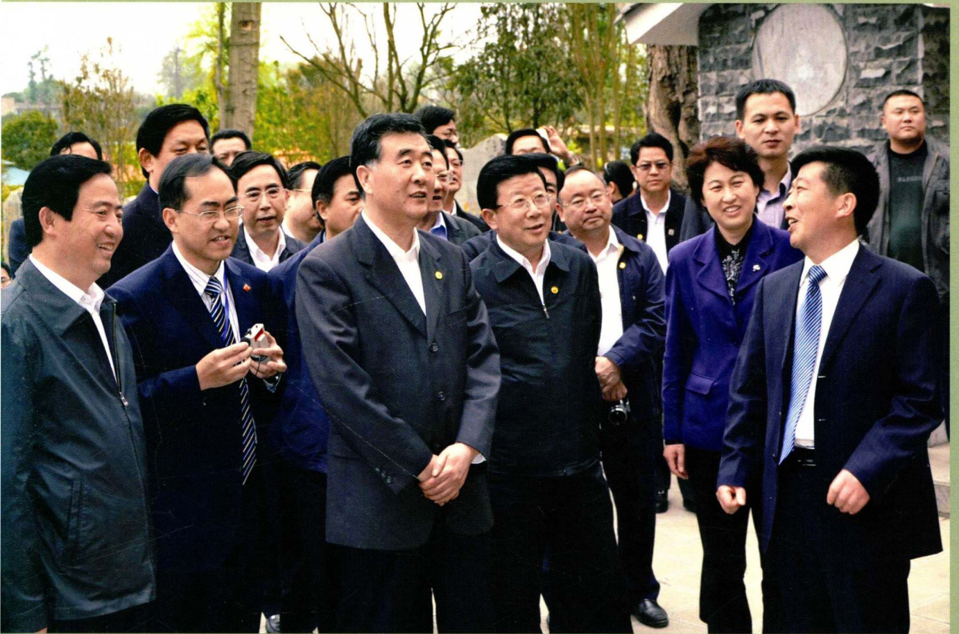
2010年4月15日，中共中央政治局委员、广东省委书记汪洋（左三）在乡韵参观。