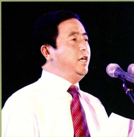
市委常委、县委书记陈志刚讲话