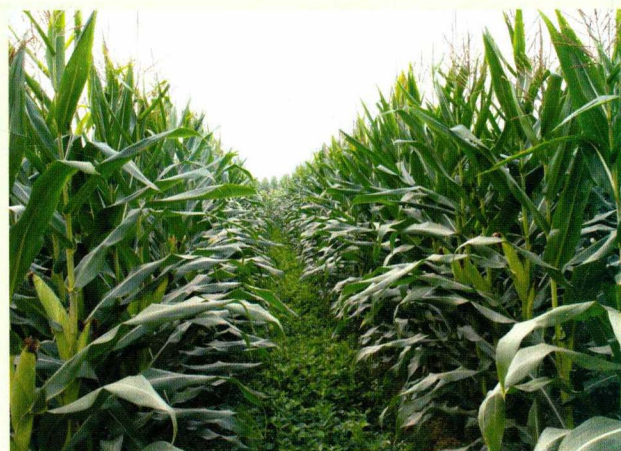
旱地宽厢宽带玉米套作花生