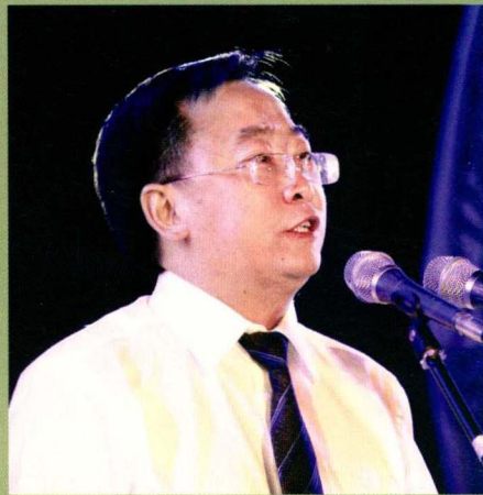
县长魏在平主持开幕式