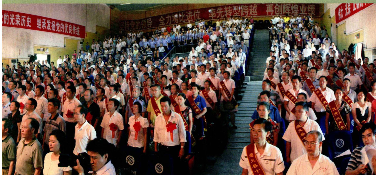
2011年7月1日,中共遵义县委在县城南白影剧院召开纪念建党90周年表彰大会。