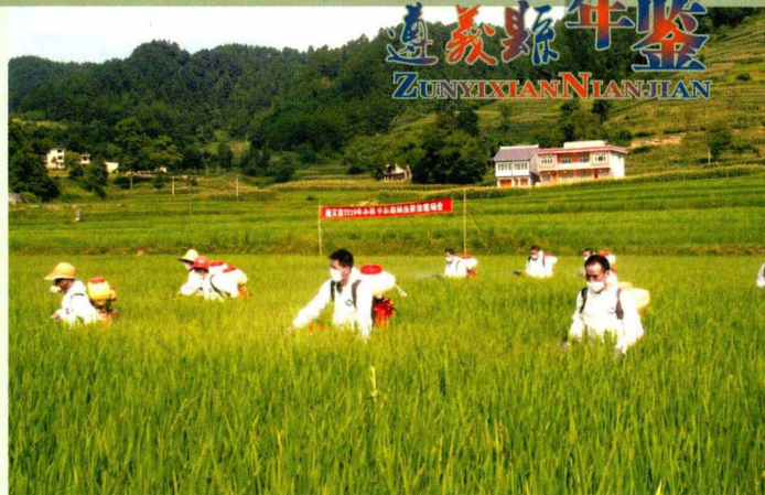
专业化防治病虫害

粮食生产事关经济安全和国计民生大局。县委、县人民政府严格按照“米袋子”县长负责制要求，牢固树立“无粮不稳”思想，把粮食生产作为发展农业农村经济的重点来抓。依靠农业科技，突出粮食标准化生产，注重提高粮食单产，强化资金投入，全力提升粮食综合生产能力，打破粮食生产长期徘徊局面，实现全县粮食产量持续增长，农民收入稳定增加，农业综合生产能力不断增强目标。1989年粮食总产量跨过4亿公斤。1994年，全县各级党政贯彻中央关于加强农业和农村工作的精神，积极实施科技兴农，改善农业基础设施，促进农业生产的发展。当年农业喜获丰收，粮食产量达5.30亿公斤，油菜籽产量0.53亿公斤。粮食超历史最高水平。1997年，农业生产条件不断改善，绿色产业开始起步，产业化经营兴起，科技兴农意识不断提高，农业生产投入增大，基础设施建设进一步加强。当年粮食产量创历史最高纪录，达6.13亿公斤，比上年增加0.17亿公斤，增长2.79%。农业人口每人平均粮食占有量446公斤。