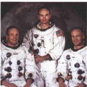
UNIDAD 4 第四课

agotar(se), agradable, aspecto, comunicar(se), conducir, descubrir, envolver, experimentar, imponer(se), recoger