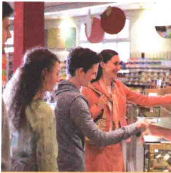
UNIDAD 1 第一课

cargar(se), conclusión, demostrar, facilitar, gastar, insistir, sobresaltar(se), suave, trato, vaciar