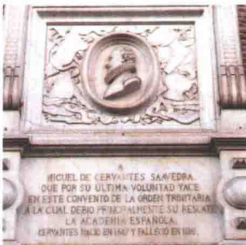
UNIDAD 2 第二课

ambos, asegurar, colocar(se), consistir, de acuerdo, lanzar(se), por fin, publicar, superar, tomar parte