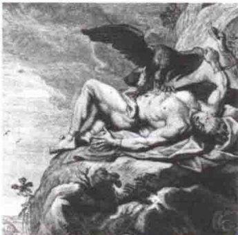
UNIDAD 3 第三课

a diferencia de, a fin de, destinar, determinar, entregar(se), manejar, privar, repartir, reservar, suceder