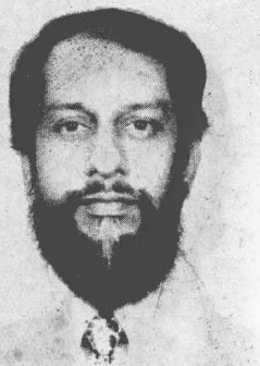
Tata Energy Research Institute (R K Pachauri)