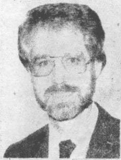
V B Hall