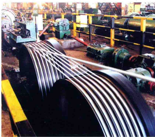
贵州钢绳股份有限公司

2009年，遵义市工业企业克服金融危机严重影响，实现平稳增长。全市工业增加值完成302.04亿元，同比增长13.2%，其中规模工业增加值254.5亿元，增长13.6%；规模工业实现销售收入502亿元，增长12%；全年实现利润73.69亿元。