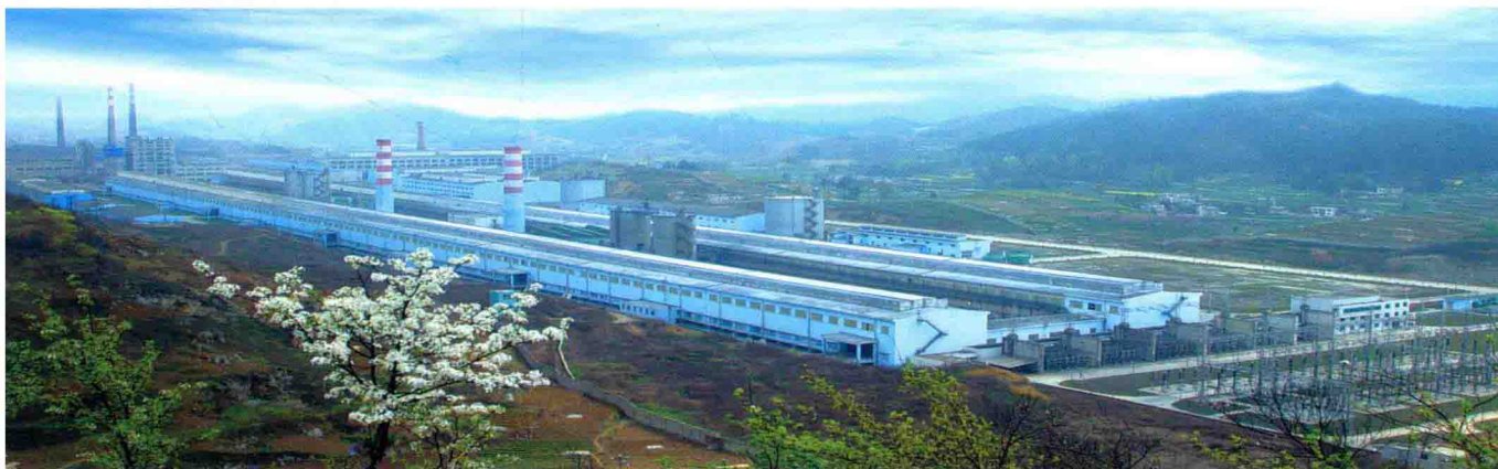
遵义铝业股份有限公司