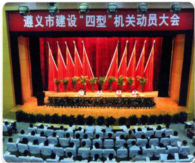
6月25日，遵义市“四型”机关动员大会召开