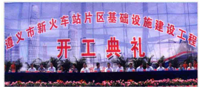
9月29日，遵义市新火车站片区基础设施建设工程在红花岗区长征镇新民村举行开工典礼