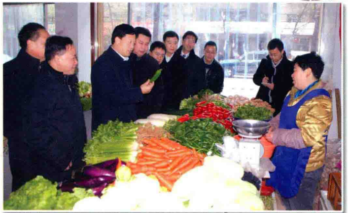
12月31日，遵义市人民政府市长王晓光（左三）视察遵义市中心城区农贸市场