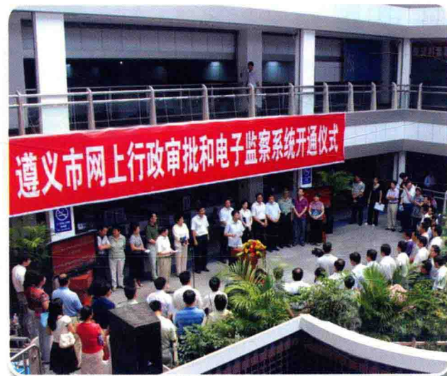
9月2日，遵义市网上行政审批电子监察系统开通运行