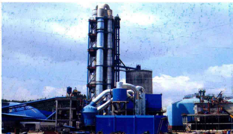
信贷支持的水泥厂

一增，即增量扩面，不断提高“三农”金融服务的充分性。 一是支农信贷投入逐年增加。2004年至2009年，累计发放涉农贷款分别为25.92亿元、29.44亿元、30.99亿元、32.35亿元、40.31亿元、76.15亿元，2009年增幅达88.9%。二是信用工程创建整体有序推进。全市成功创建信用乡镇4个、信用村107个、信用组1413个，发放信用证（卡）833103户，发证面为68.4%。累计发放小额农户信用贷款108.95亿元，