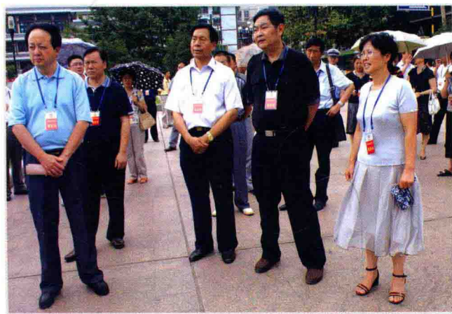
7月16日，遵义市政协主席陈凌华（右一）率常委会成员调研中心城区交通“三难”问题

2009年，中共遵义市委、市人民政府领导深入基层、深入群众、深入困难和矛盾集中的地方，坚持问政于民、问需于民、问计于民，切实关注民生、解决民困、保障民权，多谋富民之策，多办利民之事。坚持依法行政、为民施政、科学理政、从严执政，政府机关精神风貌明显改善、工作作风明显改善、行政效能明显提高、廉洁自律意识明显增强。