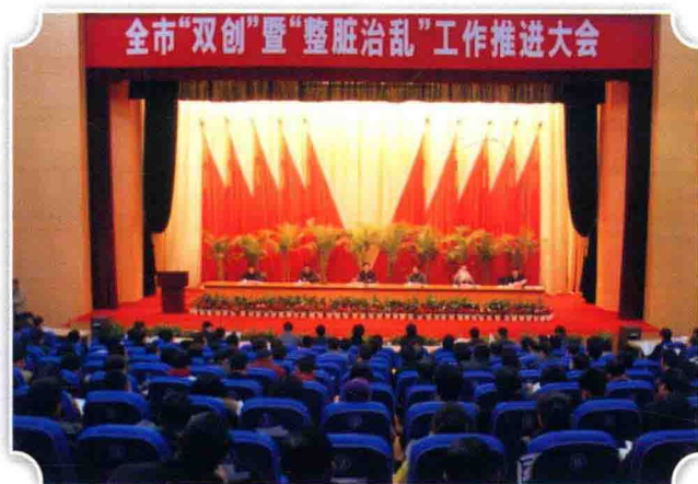
12月11日，全市“双创”暨“整脏治乱”工作推进大会召开