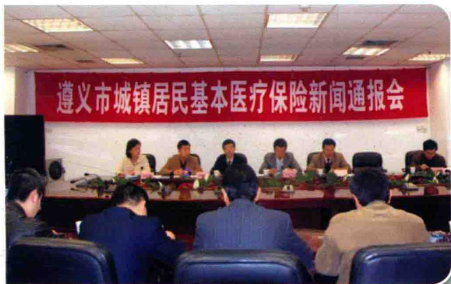
2月25日，召开全市城镇居民基本医疗保险新闻通报会