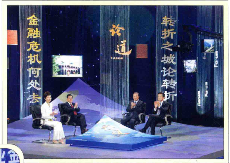
3月29日，遵义市人民政府、贵州电视台在遵义举办“金融危机何处去——转折之城论转折”高峰论坛

2009年，面对国际金融危机带来的一系列严峻挑战，全市上下解放思想，化危为机，统筹兼顾，突出重点，努力克服金融危机带来的困难，全力推进四大区域协调发展，成功举办“金融危机何处去——转折之城论转折”高峰论坛和“金融危机下的企业发展”论坛活动。通过一系列措施，全市经济社会保持了较快发展的良好态势。