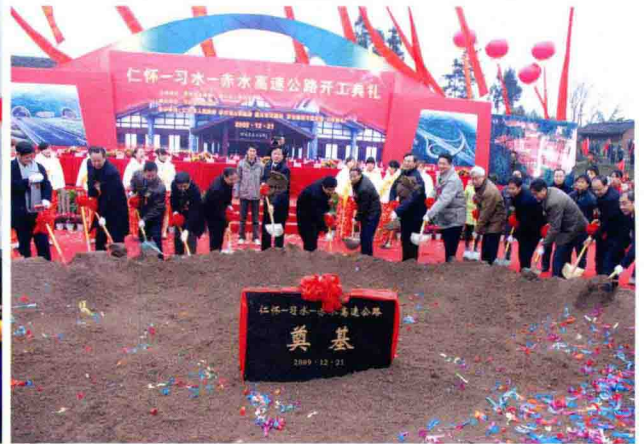
12月21日，仁赤高速公路在习水县东皇镇官坪村举行开工典礼

2009年，遵义市着力推进重点项目建设。茅台高速、习新公路等一批项目如期建成，杭瑞高速（遵毕段）、遵义灌区、桐梓煤化工等一批项目有计划推进，杭瑞高速（遵思段）、遵绥高速、绥阳煤电化、正安石峰水库等一批项目开工建设。全年安排调度的105个市列重点建设项目，累计完成投资122亿元，其中53个省列重点项目完成投资103亿元，为省下达计划的128%。全市50万元以上固定资产投资完成319.66亿元，增长19.1%。