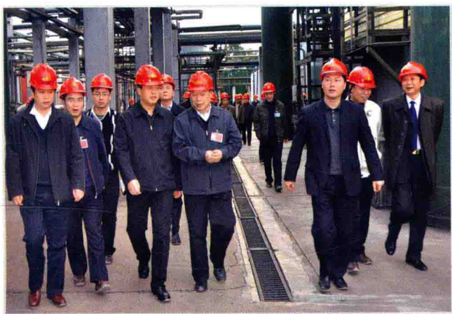
12月3日，遵义市人民政府市长王晓光（前左四）到仁怀、赤水、习水等县（市）调研