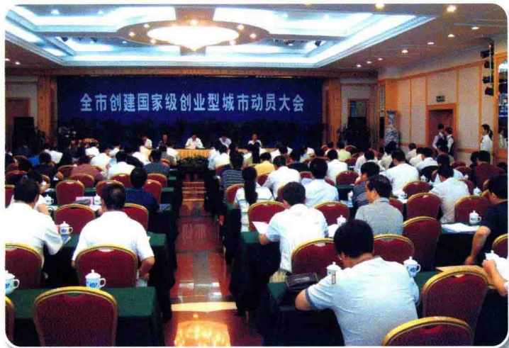
6月19日，全市创建国家级创业型城市动员大会召开