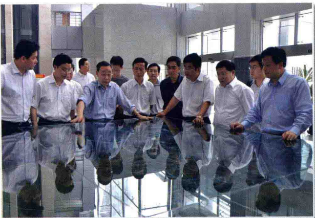
5月13日，贵州省人民政府省长林树森（前左三）调研遵义市城市规划