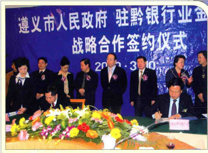
3月10日，遵义市人民政府市长王晓光（前右一）代表市政府与中行贵州省分行、工行贵州省分行、交行贵州省分行、农行贵州省分行等7家驻黔银行机构签订战略合作协议