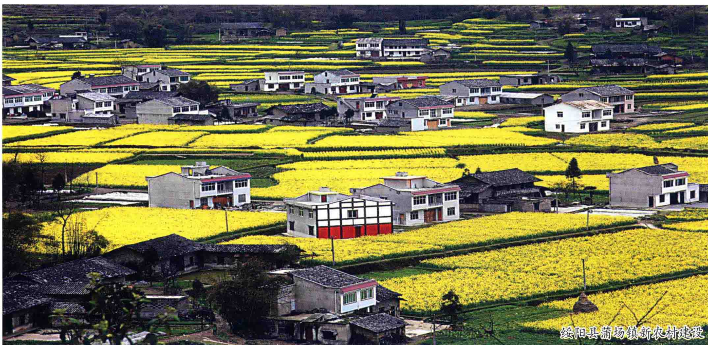
绥阳县蒲场镇新农村建设

截至2009年，全市“四在农家”创建活动覆盖232个乡镇、1300多个村，受益农民310万人，占全市农民总数的59.8%。通过“四在农家”创建活动，培育打造了1000个乡村旅游点（农家乐），累计接待游客500多万人次，实现旅游收入3.2亿元。通过创建，提升了农民综合素质，推动了农村经济社会全面发展。