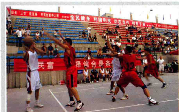
遵义市农村信用社首届“信合杯”篮球赛

2009年，累计向1329户中小企业发放贷款余额49.5亿元，其中涉农企业贷款余额23.1亿元。截至12月，全市农村信用社各项存款余额227.6亿元，占全市金融机构的24.7%；各项贷款余额147.1亿元，占全市金融机构的30.3%。5年来累计发放各类贷款356亿元，其中涉农贷款余额92.3亿元，占全市金融机构涉农贷款余额的95%以上，主要指标均居全市金融机构第一位。为推进遵义市“三新一强”建设，实现经济社会又好又快发展发挥了重要作用，成为支持遵义地方经济发展的金融主力军。