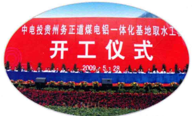
5月28日，中电投贵州务正道煤电铝一体化基地取水工程在务川自治县都濡镇杨村洋岗河大桥举行开工仪式

2009年，遵义市着力推进重点项目建设。茅台高速、习新公路等一批项目如期建成，杭瑞高速（遵毕段）、遵义灌区、桐梓煤化工等一批项目有计划推进，杭瑞高速（遵思段）、遵绥高速、绥阳煤电化、正安石峰水库等一批项目开工建设。全年安排调度的105个市列重点建设项目，累计完成投资122亿元，其中53个省列重点项目完成投资103亿元，为省下达计划的128%。全市50万元以上固定资产投资完成319.66亿元，增长19.1%。