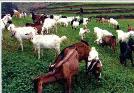
信贷支持的科技养羊项目