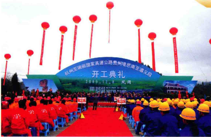
12月8日，杭瑞高速公路思南至遵义段在凤冈县何坝乡何坝社区举行开工典礼