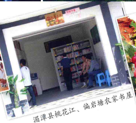
湄潭县桃花江、偏岩塘农家书屋