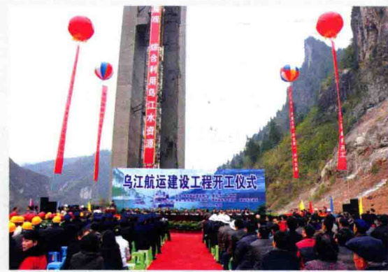
12月18日，国家和省重点项目乌江航运建设工程在余庆县大乌江镇大乌江码头举行开工仪式