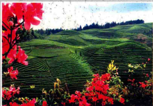
信贷支持的茶叶产业

1952年4月，贵州省第一家农信社在遵义市桐梓县元田坝设立。2003年，根据《国务院关于印发深化农村信用社改革试点方案的通知》要求，遵义农村信用社在中共遵义市委、市人民政府领导下，于2005年10月完成统一法人改革试点工作。全市14家县级法人单位共有金融服务网点400个，员工3261人，是遵义市营业网点和从业人员最多、服务范围最广的金融机构。