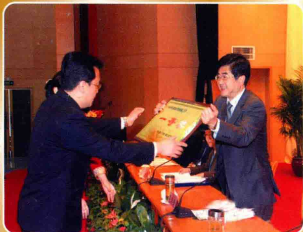
中共遵义市委书记慕德贵（右一）在全市金融工作会上向遵义农信社颁奖