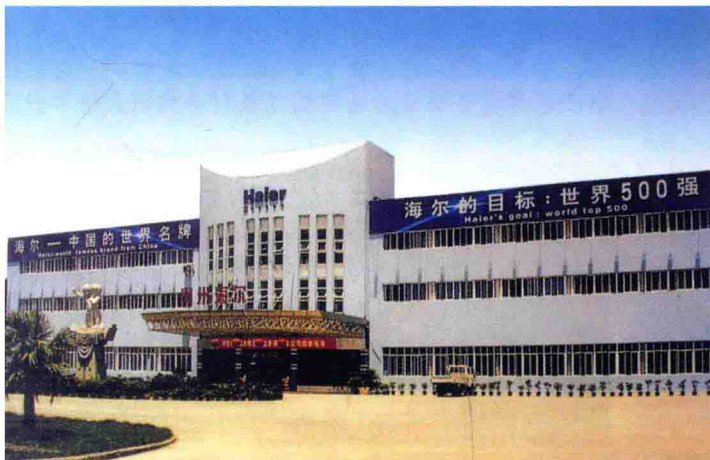
贵州海尔电器有限公司

2009年，遵义市工业企业克服金融危机严重影响，实现平稳增长。全市工业增加值完成302.04亿元，同比增长13.2%，其中规模工业增加值254.5亿元，增长13.6%；规模工业实现销售收入502亿元，增长12%；全年实现利润73.69亿元。