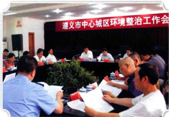
8月26日，遵义市人民政府召开中心城区环境整治工作会议