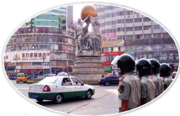
9月1日，对中心城区无牌、无证驾驶、非法营运和驶入禁行区域的摩托车进行集中整治

遵义市自2007年9月启动新一轮“双创”活动和2008年中共遵义市委、市人民政府提出“三抓六打造”及“一建双创”工作思路以来，通过全市人民共同努力，取得阶段性成果。2009年，先后获“创建全国文明城市工作先进城市”、“第二届全国未成年人思想道德建设工作先进城市”等称号；“创模”工作重点指标有新进展；“整脏治乱”专项行动和“满意在贵州”工作连续两年在全省考核中获一等奖。