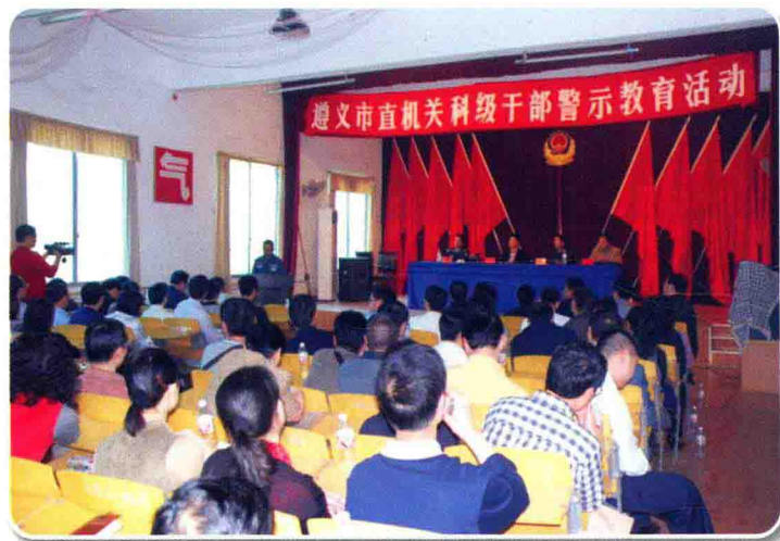
4月14日，遵义市直机关开展科级干部警示教育活动

2009年，中共遵义市委、市人民政府以“打造廉洁高效的政务环境”为核心，以建设“政治坚定、务实高效、勤政廉政、和谐文明、人民满意的机关”为目标，在全市党政机关及履行行政职能的事业单位中启动“学习型、服务型、效能型、廉洁型”机关建设，成效显著。市级行政许可项目由484项压缩到203项，压缩58.1%；市级非行政许可审批项目由122项压缩到24项，压缩80%；市级便民服务项目由56项调整为45项。