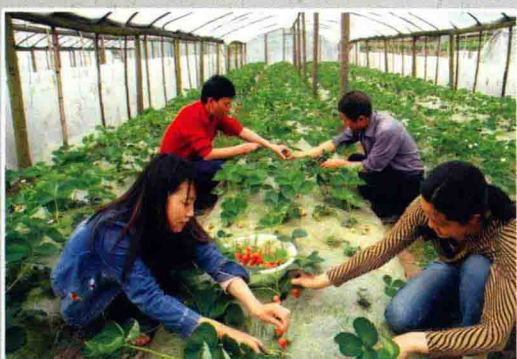
信贷支持的大棚种植草莓