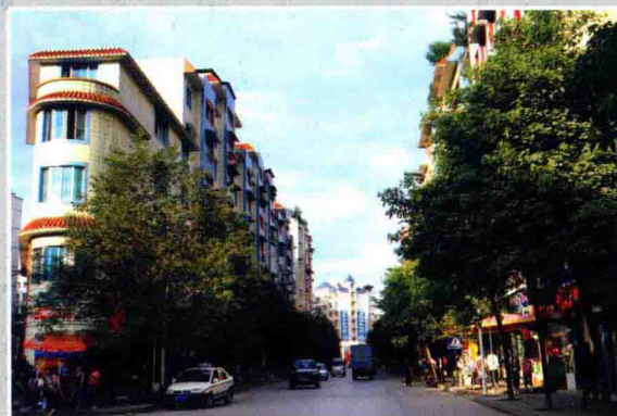
信贷支持的城镇建设