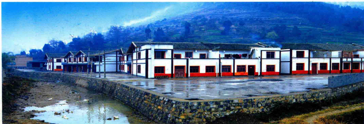
道真仡佬族苗族自治县联社信贷支持的上坝乡双河村“黔北民居”一条街