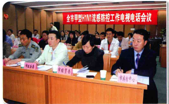
10月9日，召开全市甲型H1N1流感防控工作电视电话会议