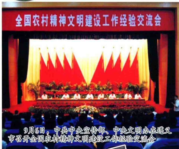
全国农村精神文明建设工作经验交流会

9月6日，中共中央宣传部、中央文明办在遵义市召开全国农村精神文明建设工作经验交流会