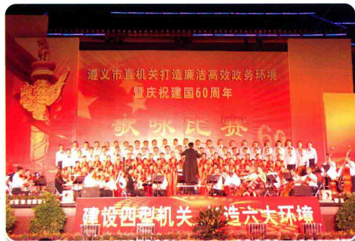
9月24日，举办遵义市直机关打造廉洁高效政务环境暨庆祝建国60周年歌咏比赛

2009年，中共遵义市委、市人民政府以“打造廉洁高效的政务环境”为核心，以建设“政治坚定、务实高效、勤政廉政、和谐文明、人民满意的机关”为目标，在全市党政机关及履行行政职能的事业单位中启动“学习型、服务型、效能型、廉洁型”机关建设，成效显著。市级行政许可项目由484项压缩到203项，压缩58.1%；市级非行政许可审批项目由122项压缩到24项，压缩80%；市级便民服务项目由56项调整为45项。