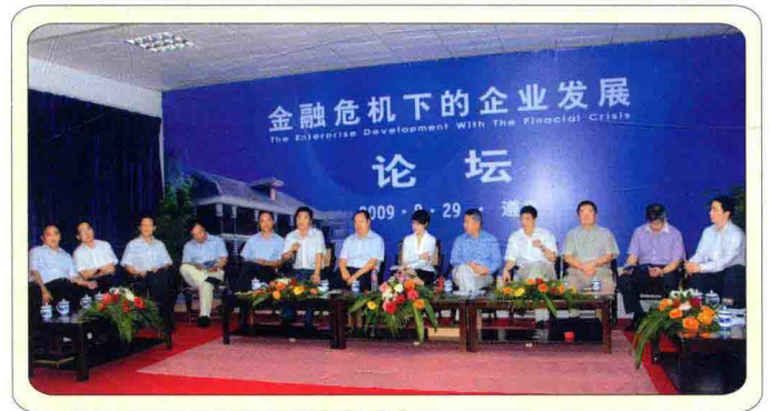
8月29日，“金融危机下的企业发展”论坛在遵举办