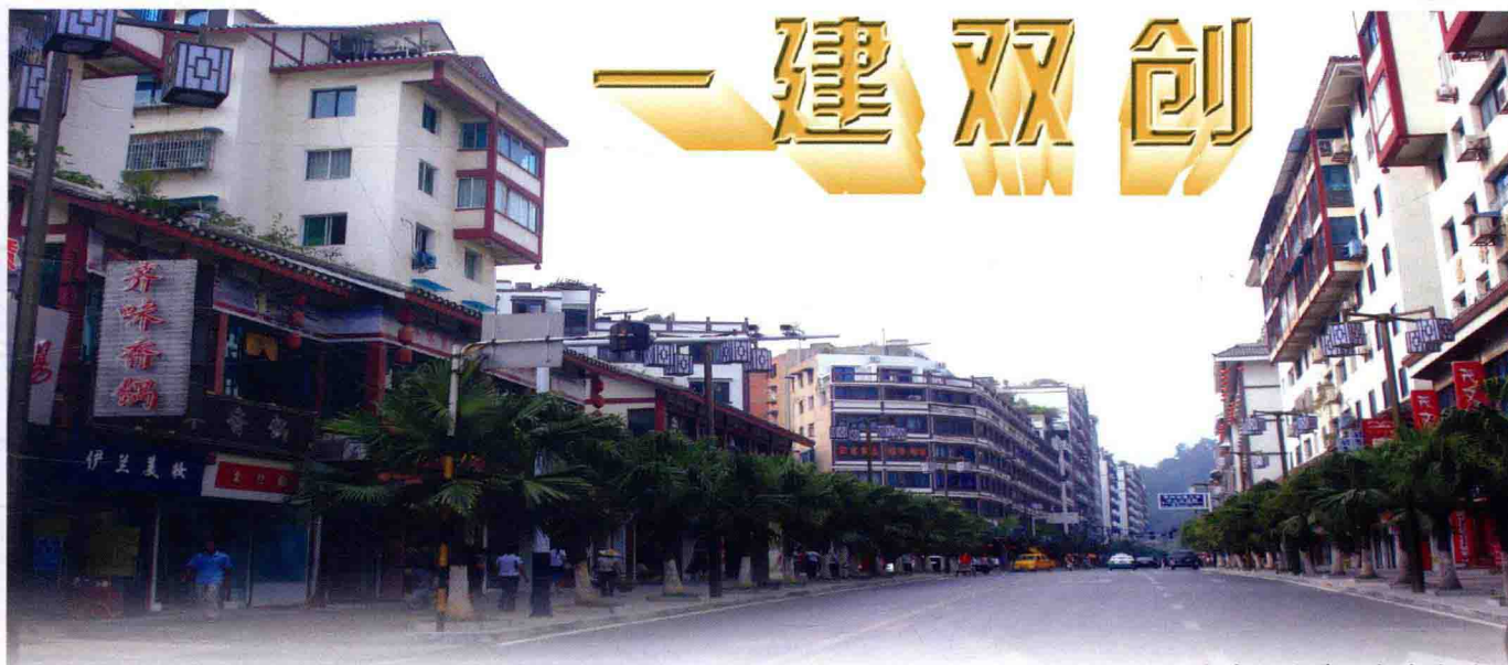
改造后的遵义老城街道