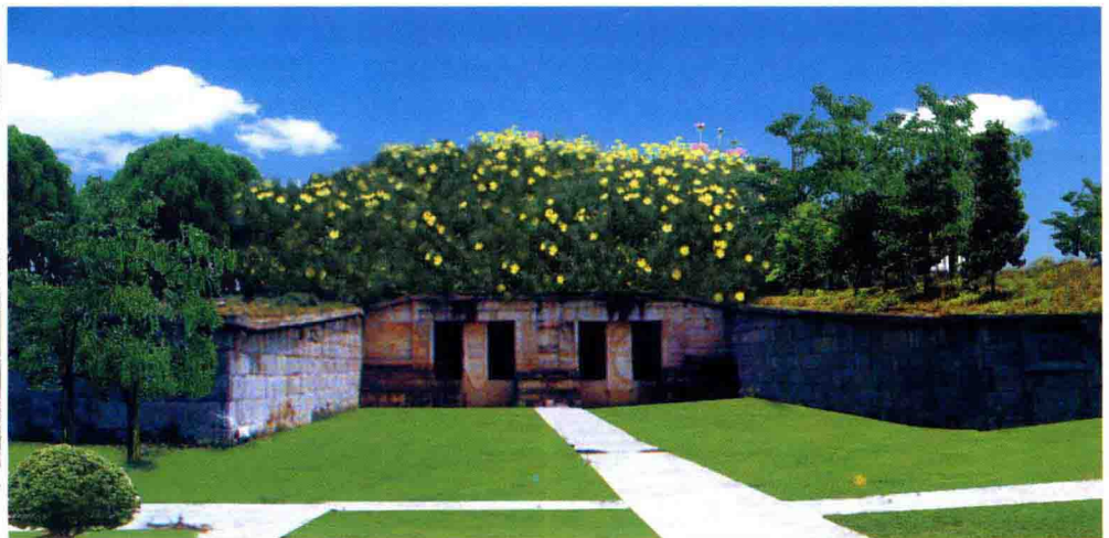
全国重点文物保护单位杨桲墓