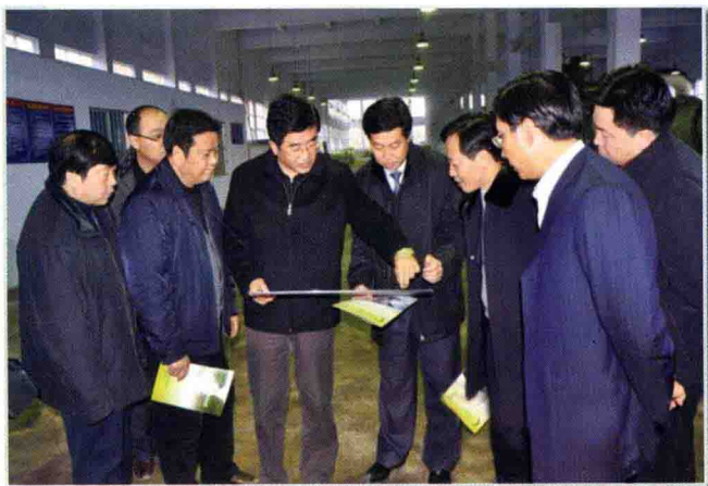
12月，中共遵义市委书记慕德贵（前左三）先后到凤冈县贵州老鸱山生态产业有限公司、水河茶叶基地、贵州凤冈净宇生物科技有限公司调研

2009年，中共遵义市委、市人民政府领导深入基层、深入群众、深入困难和矛盾集中的地方，坚持问政于民、问需于民、问计于民，切实关注民生、解决民困、保障民权，多谋富民之策，多办利民之事。坚持依法行政、为民施政、科学理政、从严执政，政府机关精神风貌明显改善、工作作风明显改善、行政效能明显提高、廉洁自律意识明显增强。