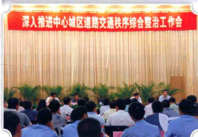
8月14日，深入推进中心城区道路交通秩序综合整治工作会议召开