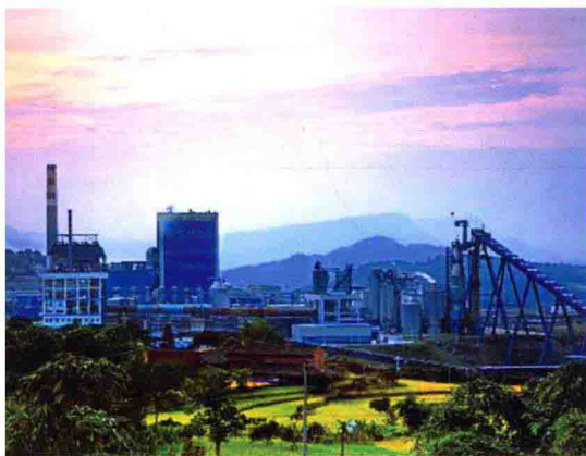
贵州赤天化纸业股份有限公司25万吨竹浆厂