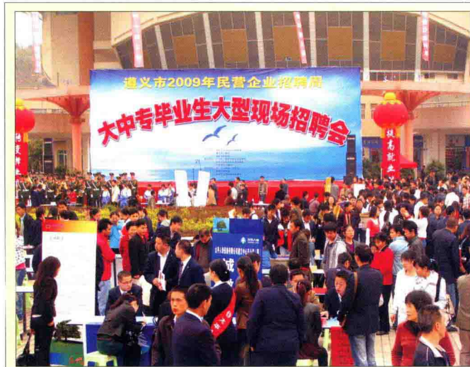
3月24日，举办遵义市2009年民营企业招聘周“大中专毕业生大型现场招聘会”