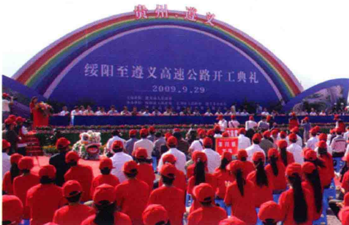
9月29日，遵绥高速公路在绥阳县蒲场镇高方子村举行开工典礼