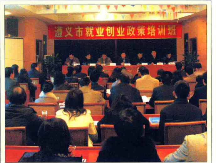
11月25日—27日，遵义市第二期就业创业政策培训班在