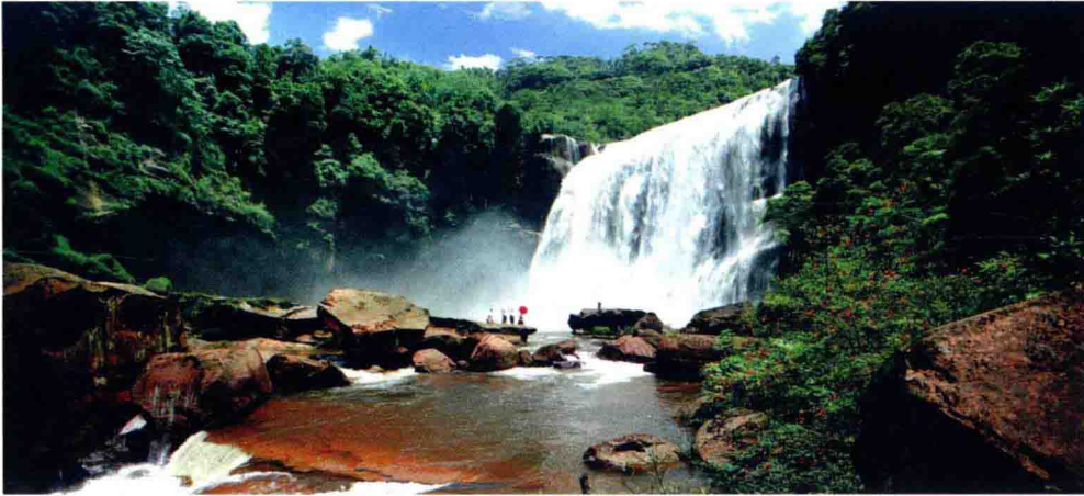
赤水十丈洞大瀑布