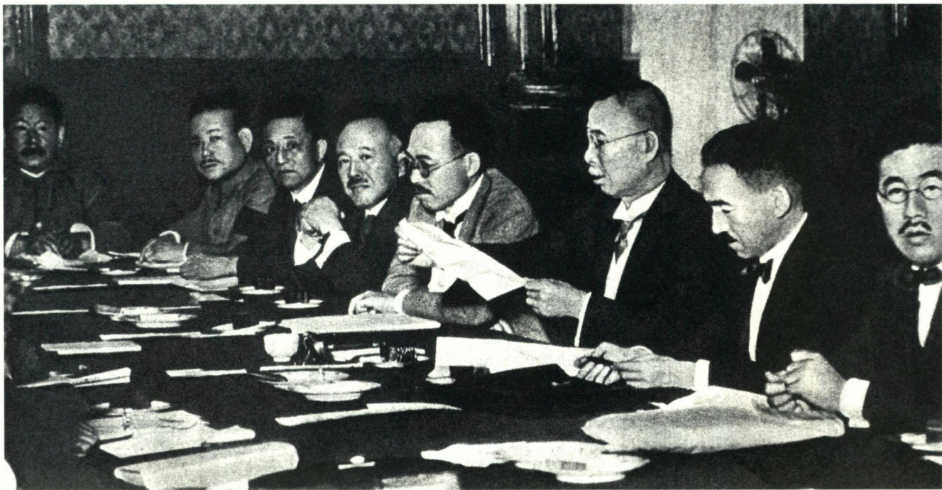
1927年6月27日至7月7日，日本首相田中义一（右3）在东京主持召开东方会议，确立先占领“满蒙”，进而侵占全中国、称霸世界的侵略扩张政策。图为会议现场。