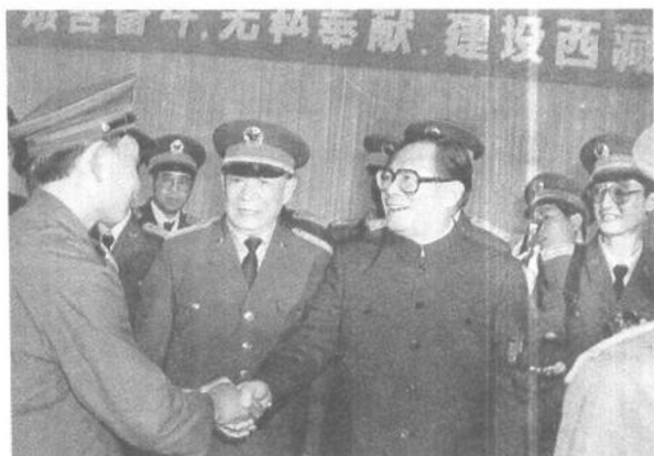
1990年7月23日，江澤民與遲浩田在拉薩西藏軍區與駐藏部隊新戰士談話