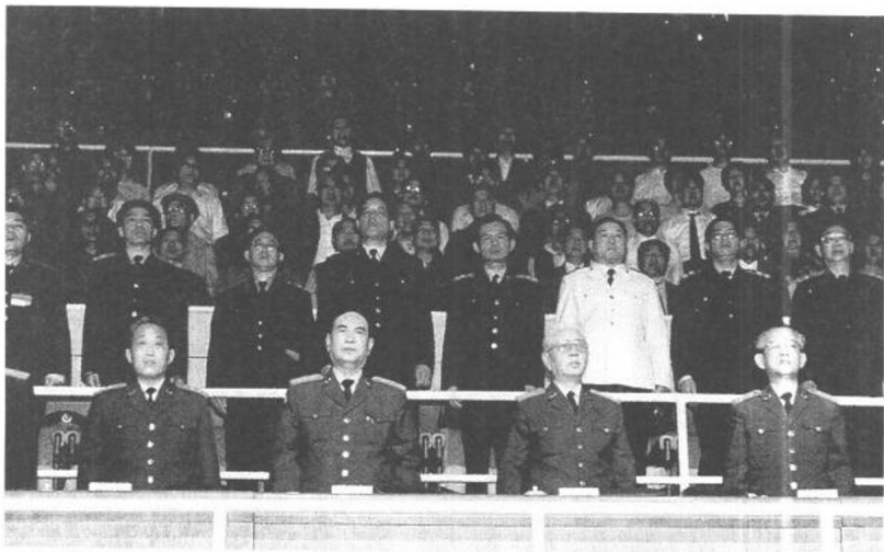
劉華清、張萬年、于永波和全體官兵同聲高唱《八路軍進行曲》