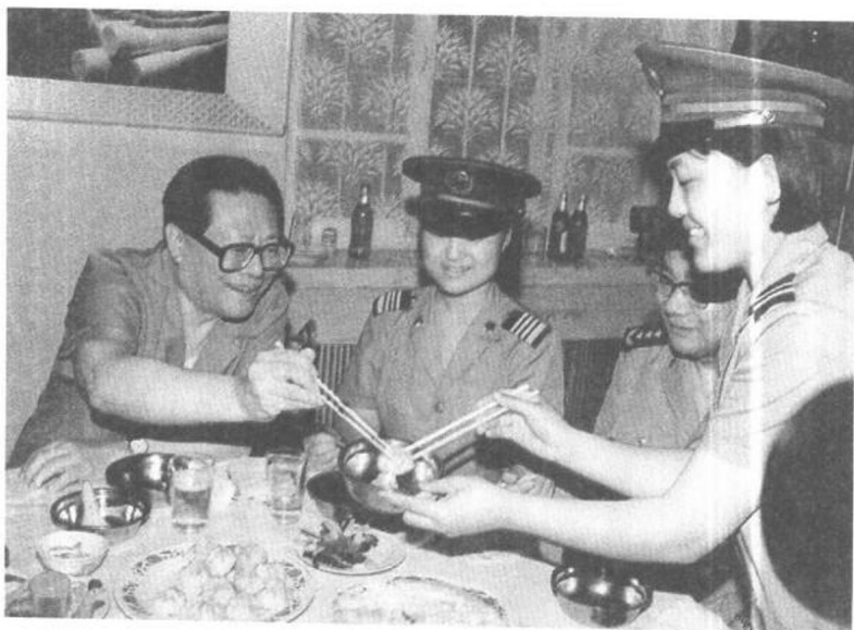
江澤民來到沈陽軍區某部長話連，看望全體幹部戰士。圖為江澤民在連隊與女戰士共進午餐。