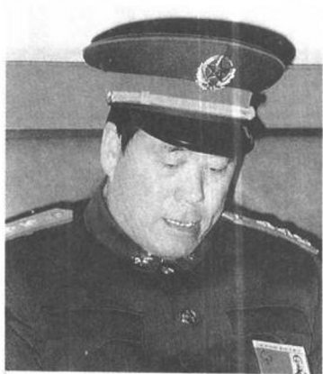
傅全有 中央軍委 中央委員 總參謀長