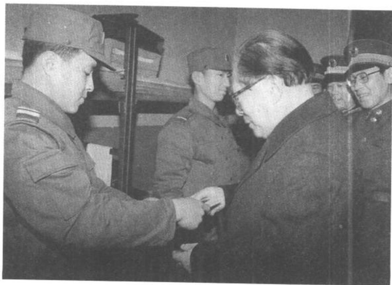
江澤民來到北京軍區某部三連看望戰士