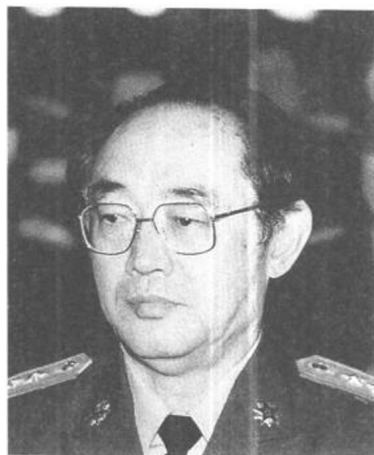
王瑞林 中央軍委委員 鄧小平辦公室主任