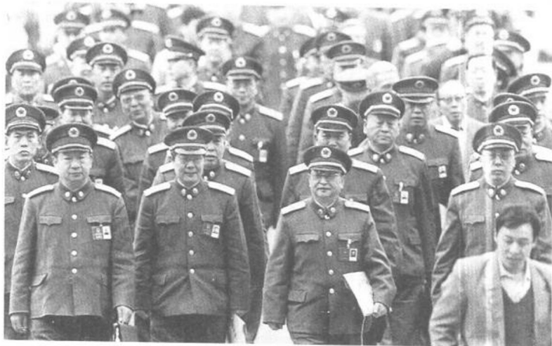
解放軍將領出席人大會議