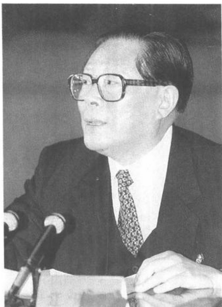
江澤民 國家主席 中央軍委主席