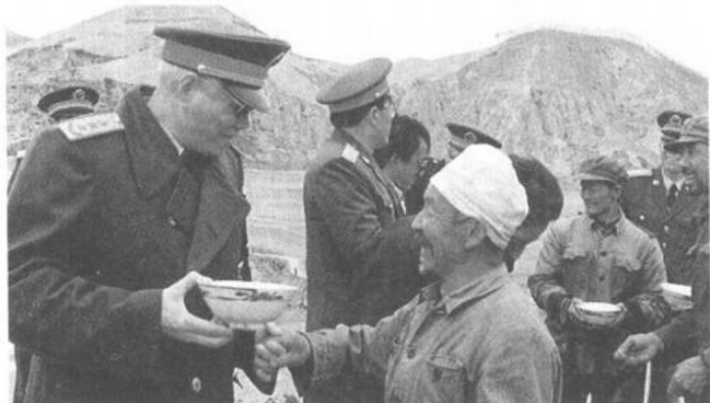
1991年1月5日，中央軍委副主席張震任國防大學校長時帶領該校500名將校軍官，赴延安參觀和實地見學。