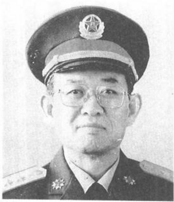
于永波 中央軍委 中央委員 總政治部主任