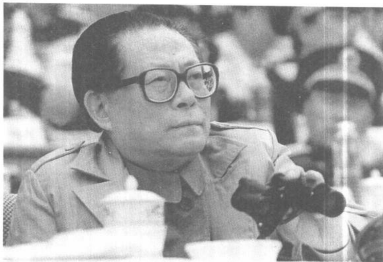
中央軍委主席江澤民在觀看演習