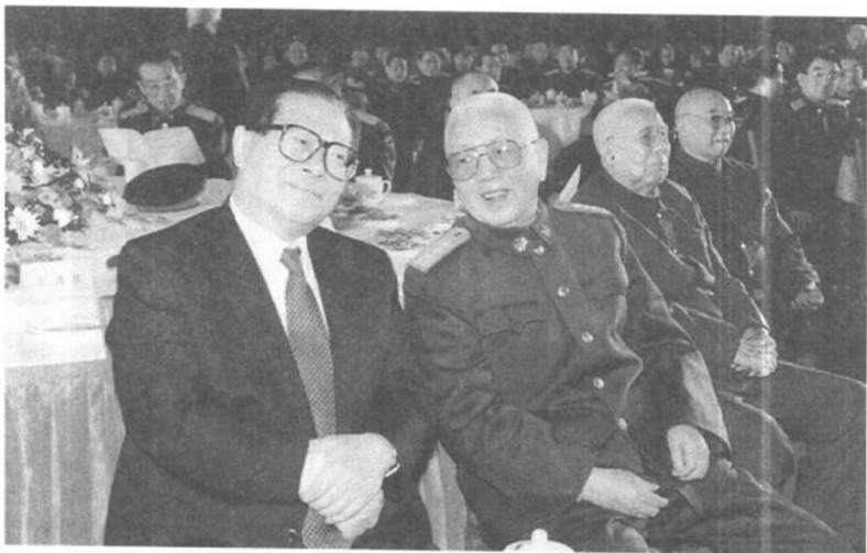
江澤民、劉華清在春節茶話會上觀看文藝節目