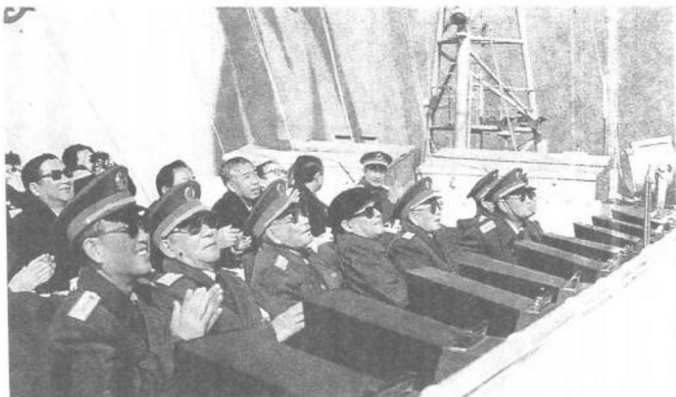
軍委領導在指揮艦上觀看海上演習