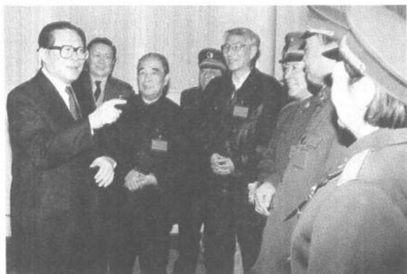
1994年1月，在全軍文化工作座談會上，江澤民會見全軍部分老藝術家