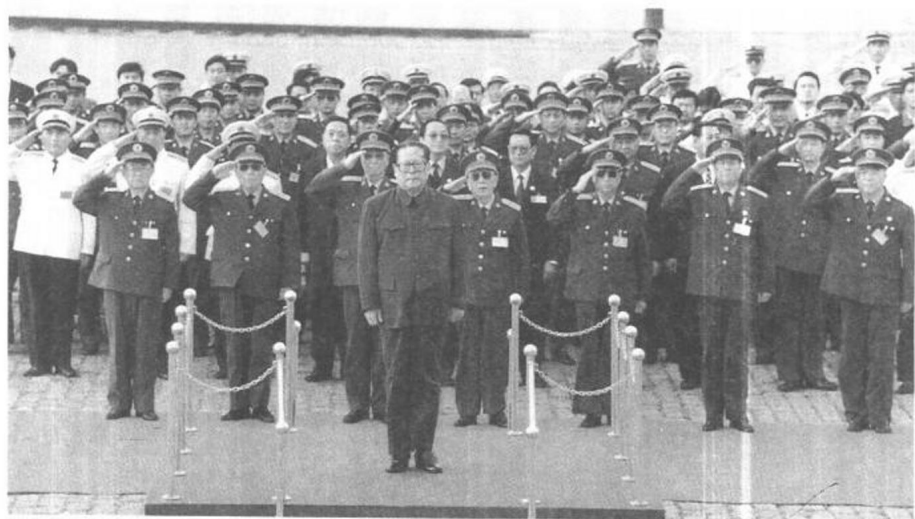
江澤民與新軍委成員檢閱部隊