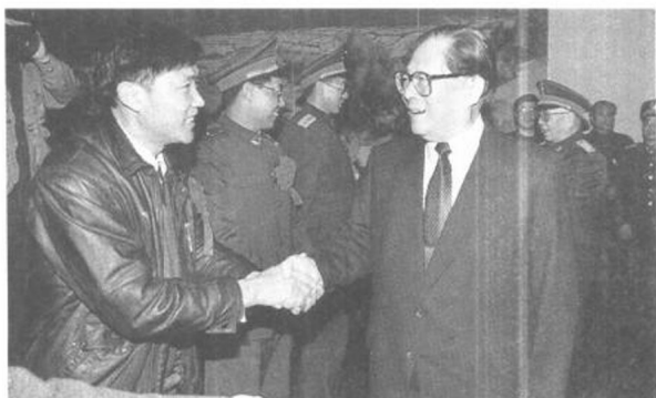
1994年2月5日，中央軍委主席江澤民在京接見全國雙擁模范代表。