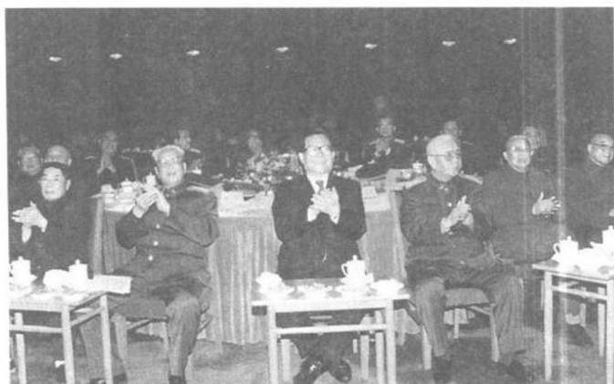
江澤民、劉華清、張震同部隊老幹部一起觀看春節聯歡節目