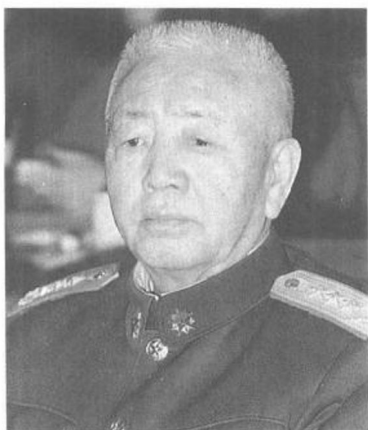
劉華清 政治局常委兼軍委副主席