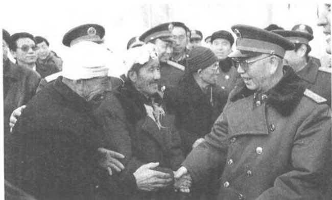
1991年1月10日，中央軍委副主席劉華清會見毛澤東當年在棗園村時的村長謝宏光等。