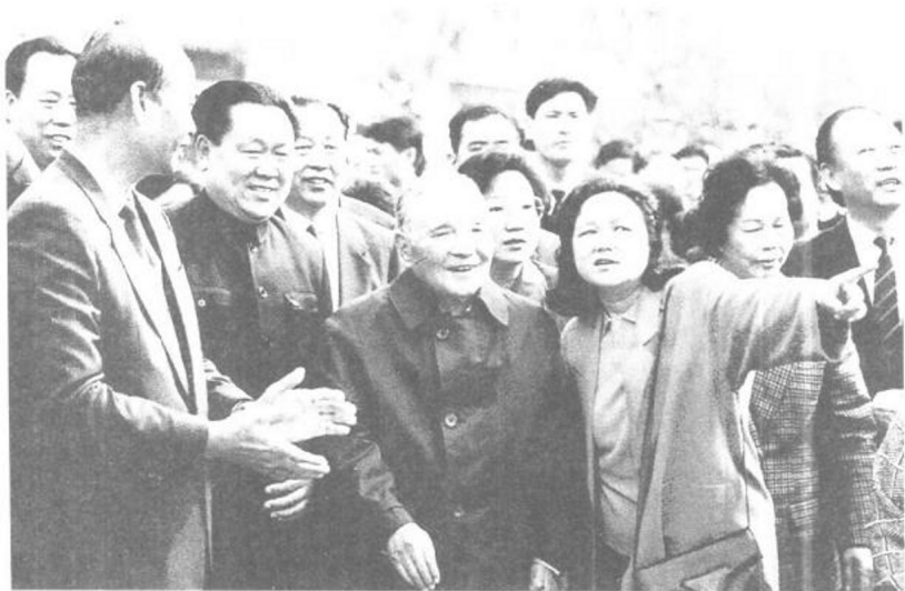
中央軍委委員王瑞林(左二)與鄧小平