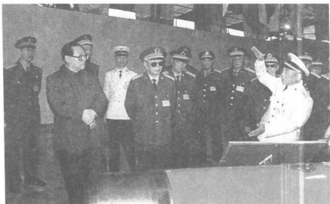
江澤民等軍委領導聽取海軍司令員張連忠上將的匯報