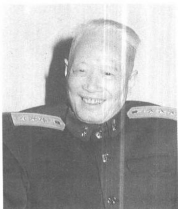
張震 中央軍委 中央委員 國家軍委副主席