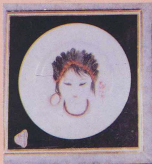
△用羽毛制作的羽毛画