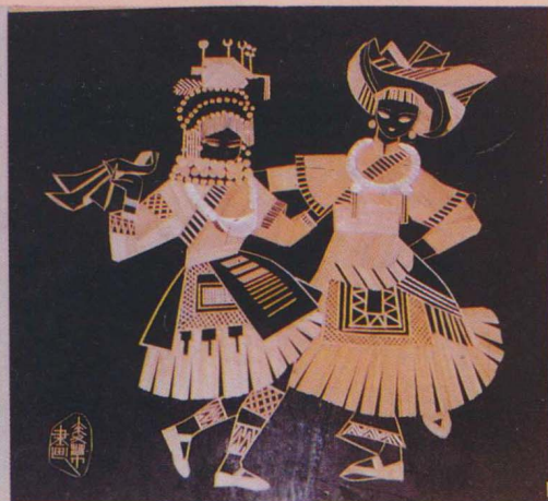
△用稻麦草制作的草画