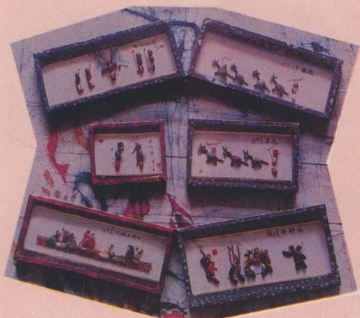
△用多种豆类制作的别具一格的豆画