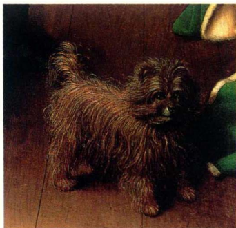
扬·凡·艾克的 《阿尔诺菲尼夫妇》局部 (见212页—213页)

到16世纪中期，出版了几本关于肖像学的书，而那之前，没有一本具有权威性的字典来解释视觉符号的含义，对于那些象征意义的东西的解释也没有统一的标准。即使在那以后，赞助人、画家和他们的指导者对美术作品中故事的出处也达不成一致。创作之源不止一个，总会有想象的空间。因此，肖像学的学生们在探究其意义时，必须小心谨慎。尽管创作